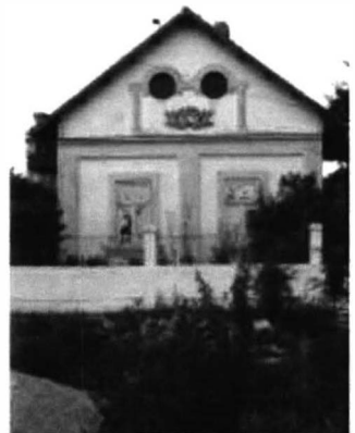
Cogealac – case, biserici