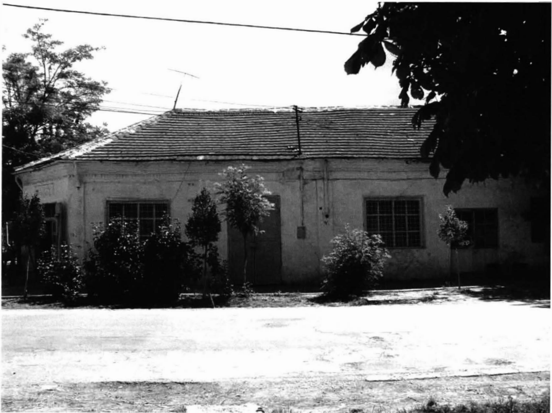
Cogealac – centru, prăvălii 5