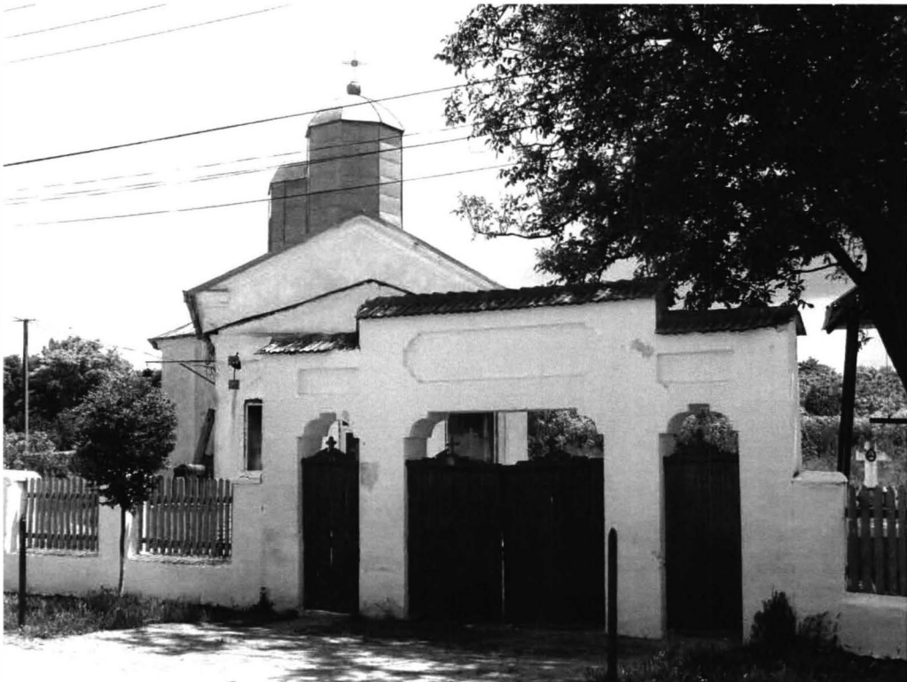
Cogealac – biserică ortodoxă 4