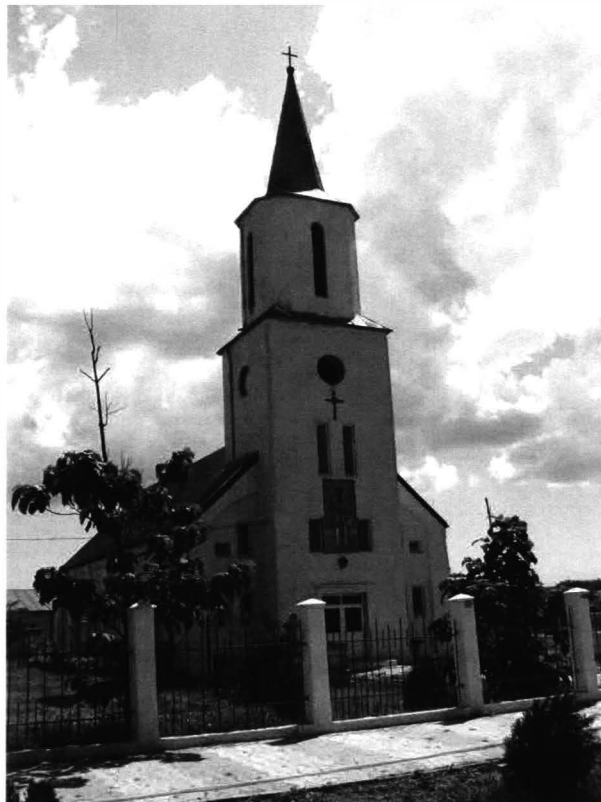
Cogealac – biserică nemțească 3