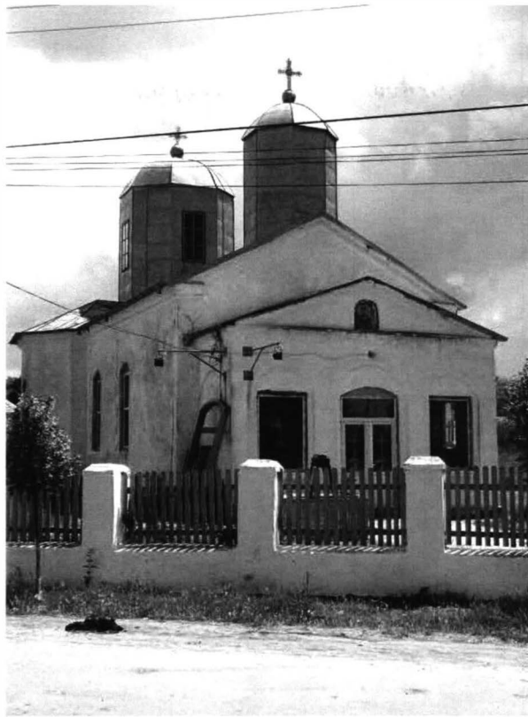
Cogealac – biserică ortodoxă 4