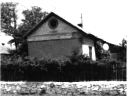
Cogeaalac – case, biserici