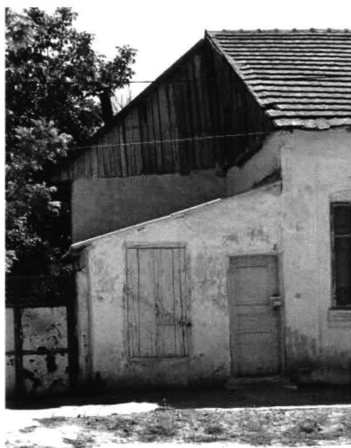
Cogealac – ateliere meșteșugărești 6