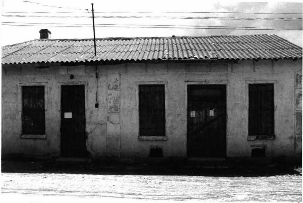
Cogealac – centru, prăvălii 5