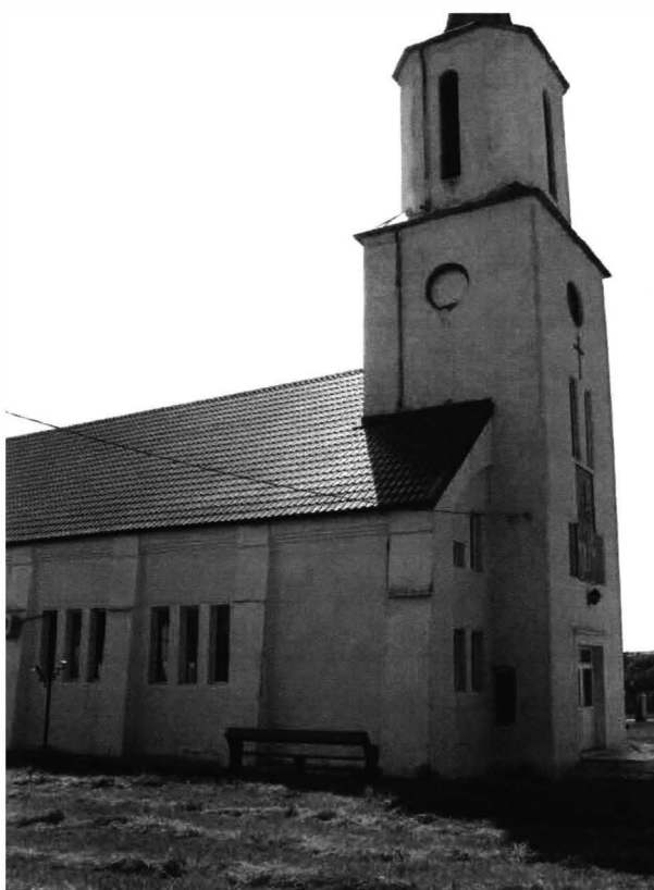
Cogealac – biserică nemțească 3