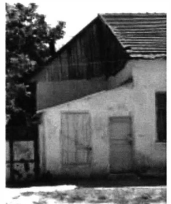
Cogealac – case, biserici