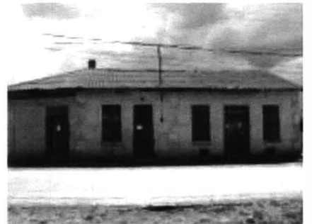
Cogealac – case, biserici