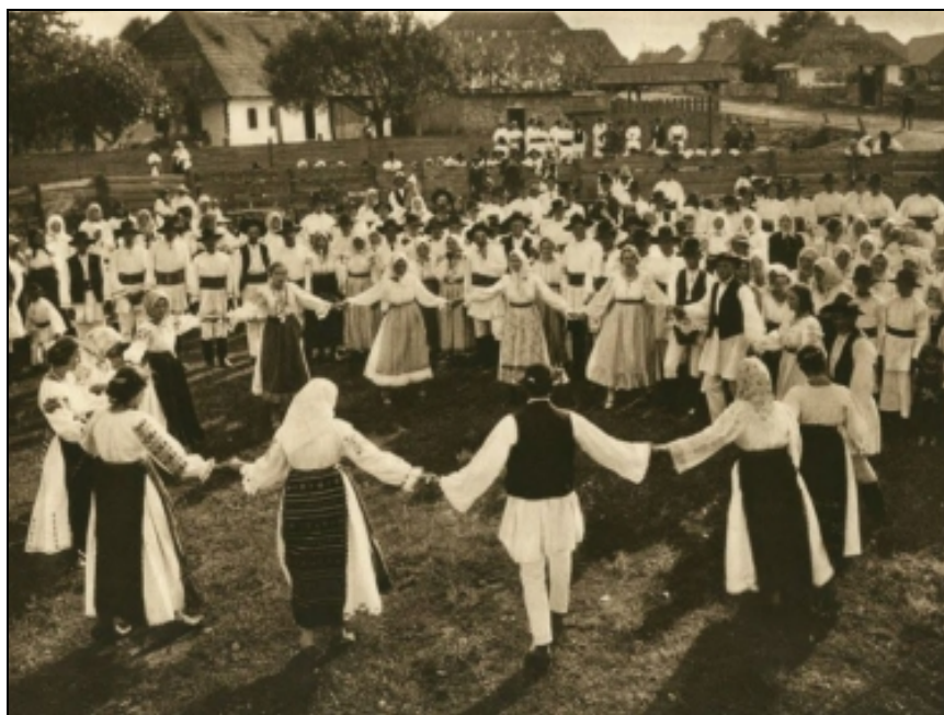
Horă duminicală – Borgo-Bistrița (începutul sec. XX)