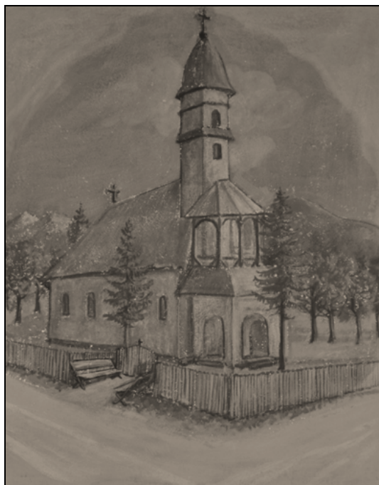
Biserica ortodoxă din Borgo-Bistrița – sec. XIX