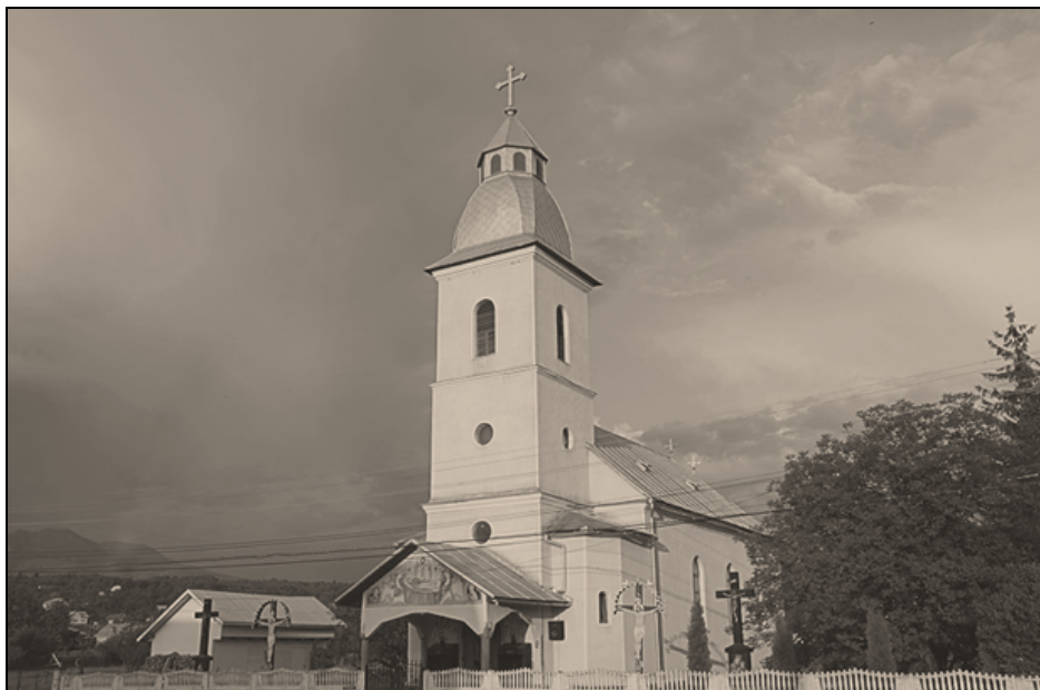
Biserica greco-catolică din Borgo-Bistrița