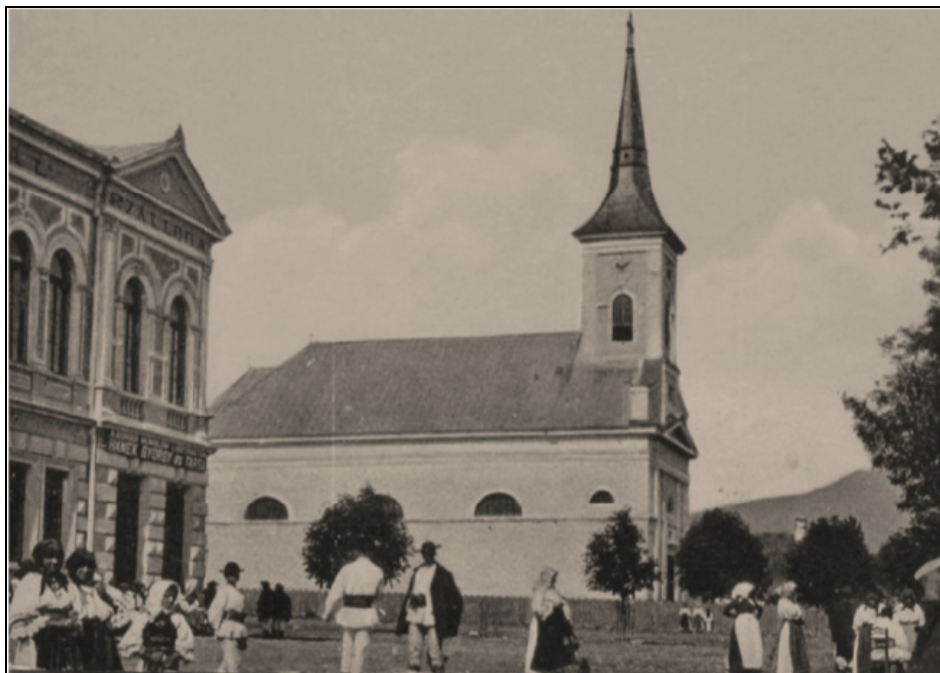
Biserica ortodoxă din Borgo-Prund (începutul sec. XX)