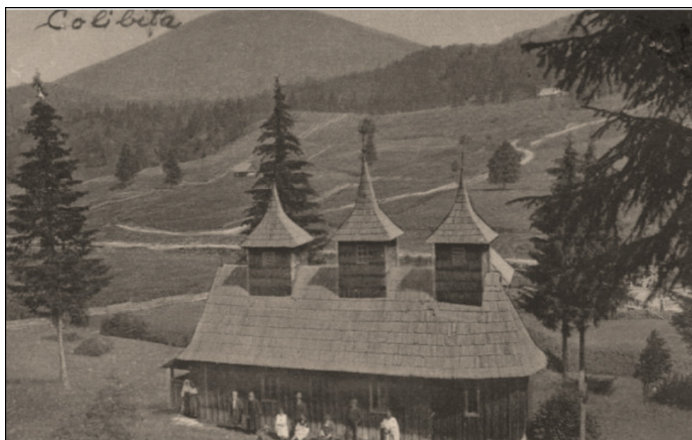
Biserica ortodoxă din Colibița (sec. XIX)