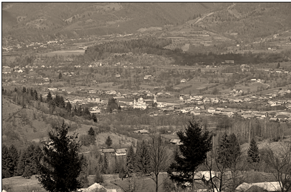
Borgo-Bistrița – panoramă, începutul sec. XX