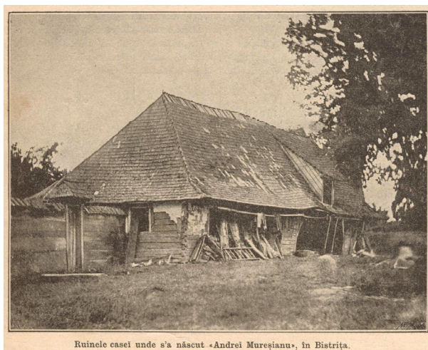
Ruinele casei unde s'a născut «Andrei Mureșianu», în Bistrița.

Casa părintească a poetului Andrei Mureșanu Bistrița, str. Andrei Mureșanu (începutul sec. XX)