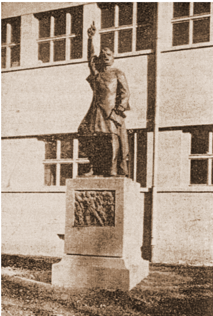
Statuia poetului Andrei Mureșanu în fața Liceului de fete „Domnița Ileana” din Sibiu (1940)