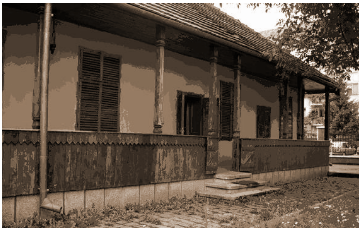
Casa memorială „Andrei Mureșanu” Bistrița