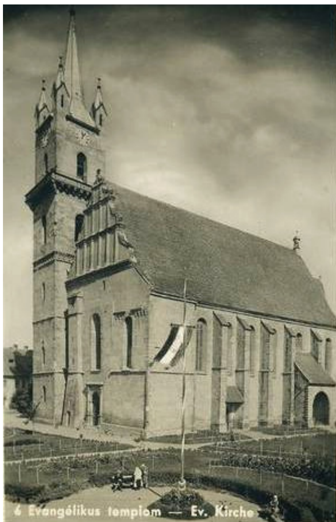
Tricolorul maghiar – 1940 Bistrița, Piața Regele Ferdinand (actuala Piață Centrală)