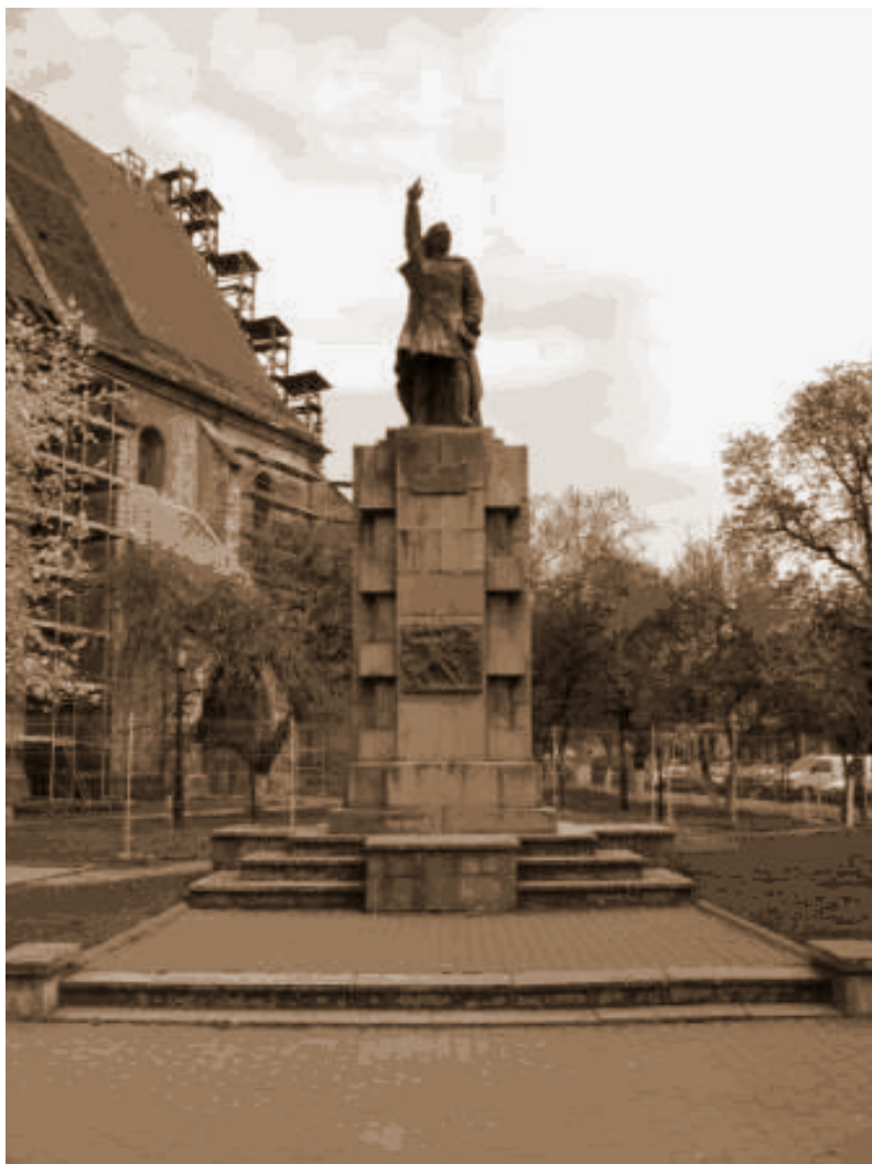
Statuia poetului Andrei Mureșanu Bistrița, Piața Centrală (1 martie 1947)