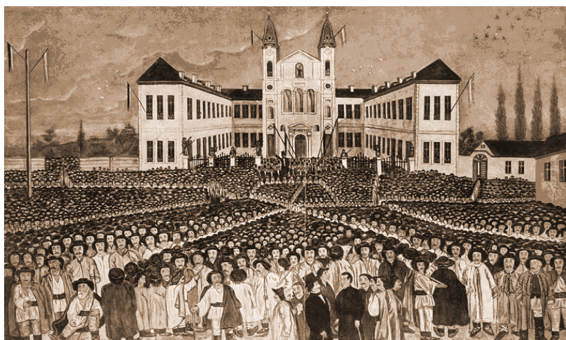
Adunarea de la Blaj, 1848 5

d-a se teme” („crestarea”, după obiceiul de însemnare a animalelor din turme), dar dacă nu-ți vine-n minte că „patria se vinde și vița a stârpit”, memoria mai realizează și că Brutus înfige fierul în cine e pe cale de a suprima libertățile în Roma, „muza” e invitată în aceeași manieră să aștepte-n liniște pieirea iminentă a celui „ce nu simte”, „demn de-a sa pieire”. Modificările de mentalitate, de procedee se produc totuși, se succed, sau, survenite în realitate, sunt reflectate fidel, în hotarul de ajuns al confruntării deschise, e strecurat și acest reproș: „Ma, nu-mi spui pe ce cale se capătă dreptatea”, parcă semn de intrare răspunsului, din același an: „cu lancea lui Horea” 4 .