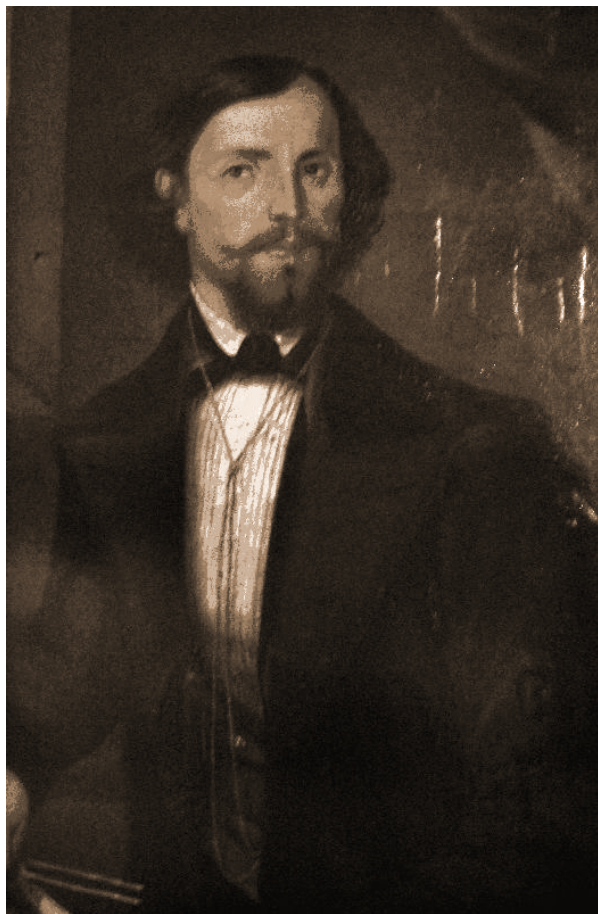
George Ucenescu (1830–1896)

La capătul acestor investigații, sub deviza biblică „ să dăm cezarului ce-i al cezarului ”, trebuie să conchidem cu cuvintele cărturarului Constantin Lacea că: „ Numele acestui minunat protopsalt al Bisericii Sf. Nicolae din Brașov (n.r. – George Ucenescu) va rămâne pe veci legat de zguduitorul imn național «Deșteaptă-te, Române!» al lui Andrei Mureșianu ”.