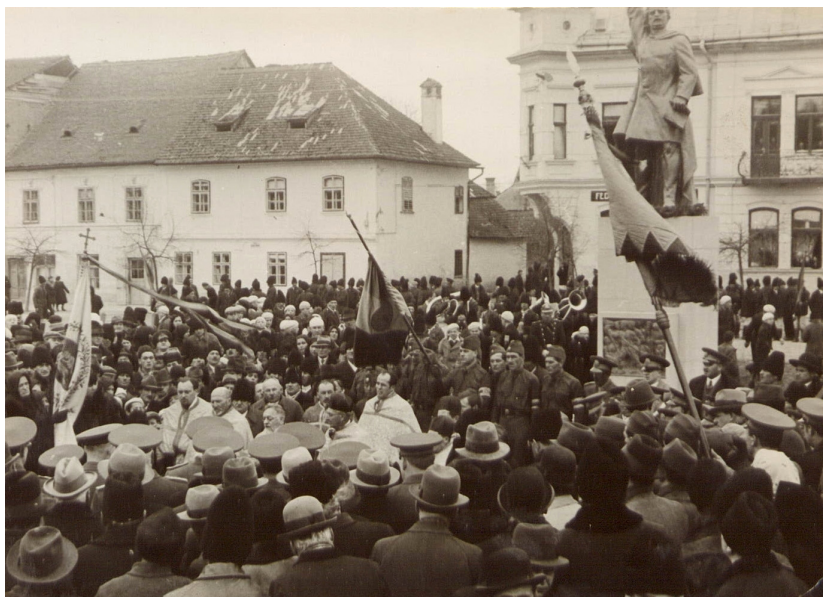
Solemnitatea dezvelirii statuii lui Andrei Mureșanu Bistrița, Piața Unirii (27 noiembrie 1938)