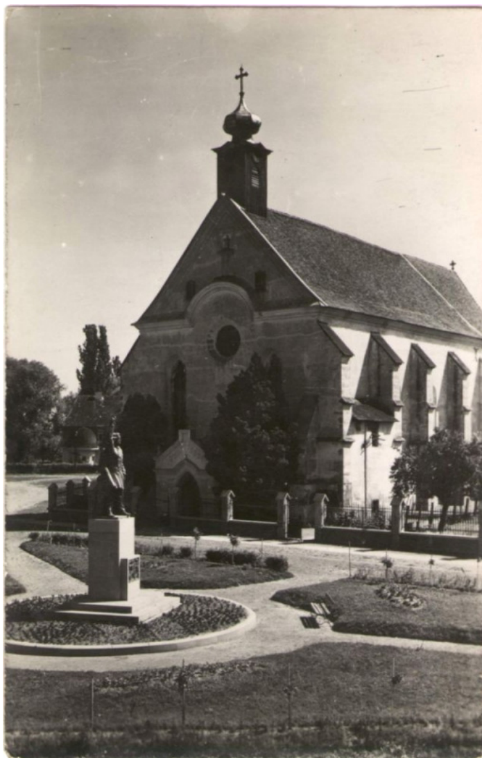
Statuia poetului Andrei Mureșanu Bistrița, Piața Unirii (1939)