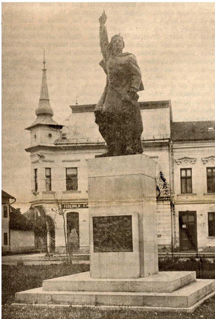
Statuia poetului Andrei Mureșanu Bistrița, Piața Unirii (decembrie 1938)