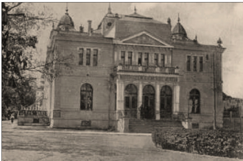
Fig. 11. Gewerbeverein Bistrița – începutul sec. XX