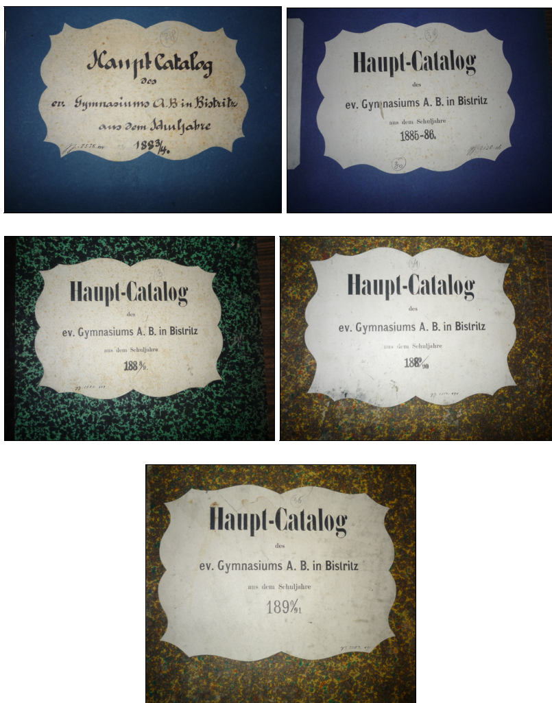
Fig. 5. Cataloagele Gimnaziului Evanghelic Bistrița, în care apare elevul Alexandru Vaida-Voevod