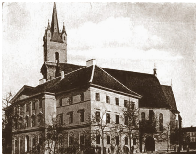
Fig. 4. Gimnaziul Evanghelic Bistrița – 1900