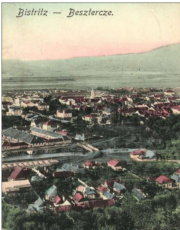
Fig. 2. Podul Budacului, Bistrița – 1918