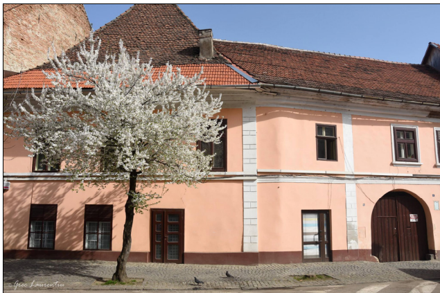
Fig. 1. Casa Shelley, Ungargasse (azi, str. Nicolae Titulescu), Bistrița