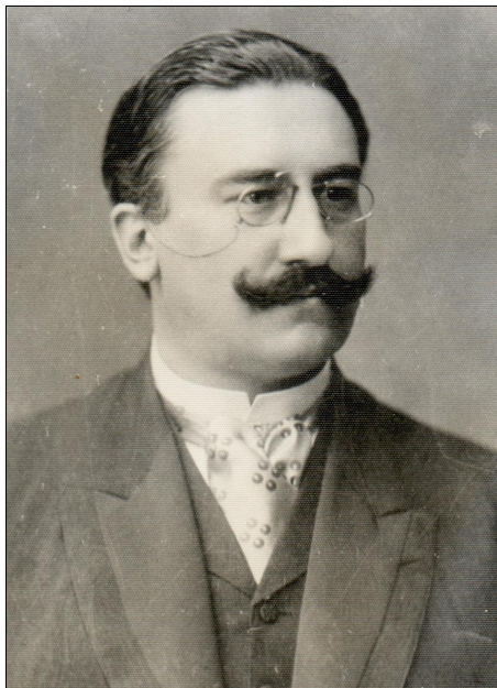
Fig. 10. Alexandru Vaida-Voevod Bistrița – 1919