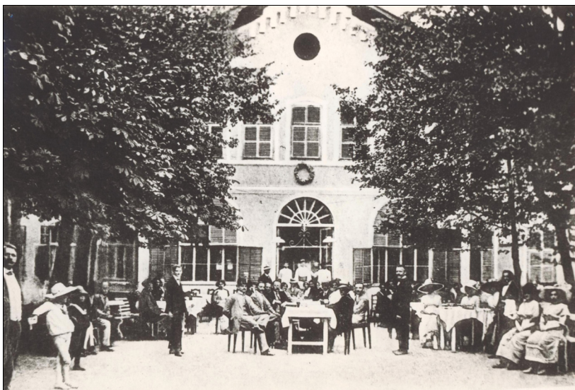
Fig. 7. Terasa Hotelului „Hebe”, Sângeorzul Român – începutul sec. al XX-lea