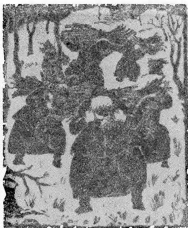
5. Femei cu vreascuri — 10.234