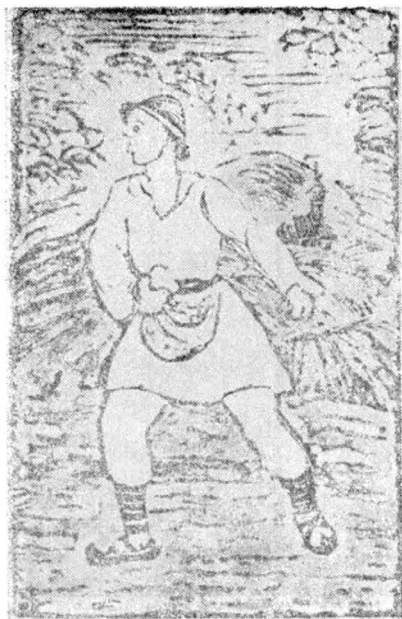
6. Semănătorul — inv. 10.222