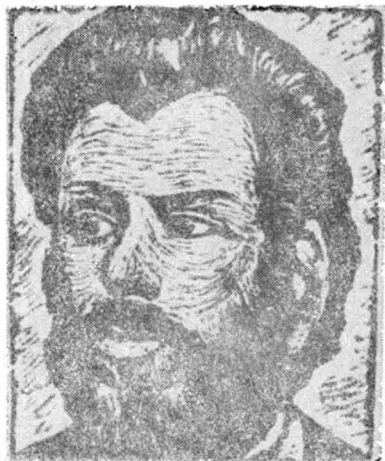
9. Ion Creangă — inv. 10.213