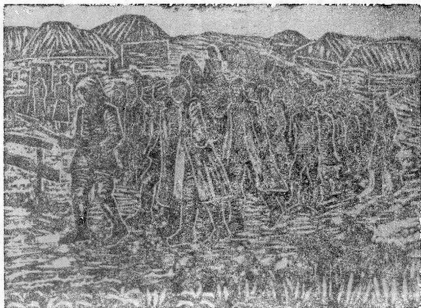
12. Convoi de prizonieri — inv. 10.278