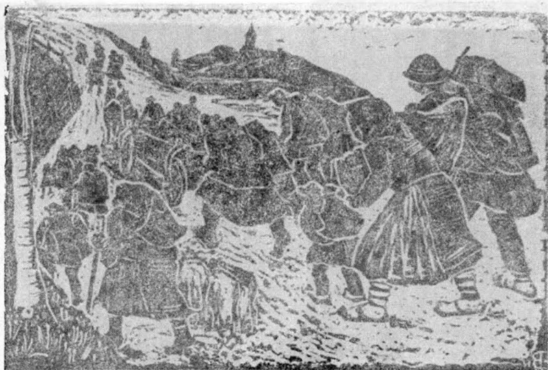
4. Refugiați — inv. 10.203