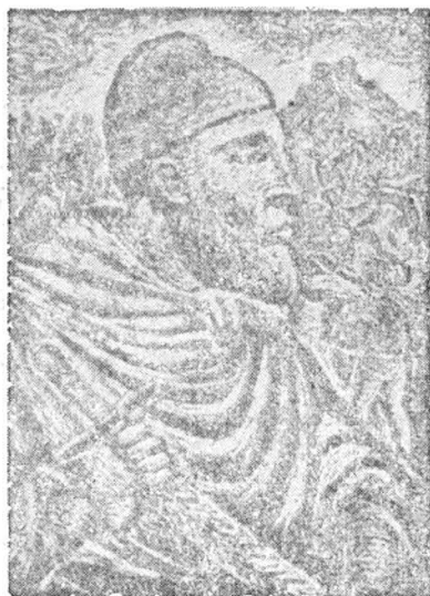
8. Decebal — inv. 10.216