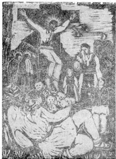
2. Din Ardealul subjugat — inv. 10.236