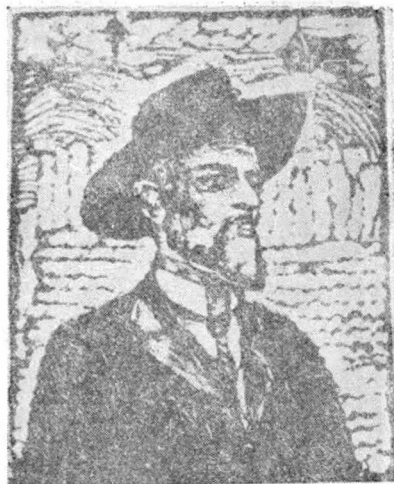
10. George Coșbuc — inv. 10.212