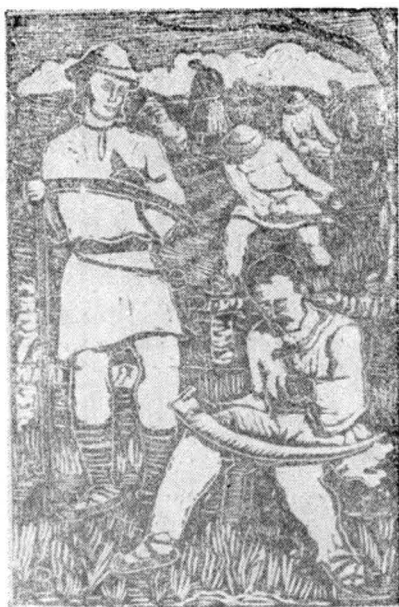
7. Cosașii — inv. 10.230