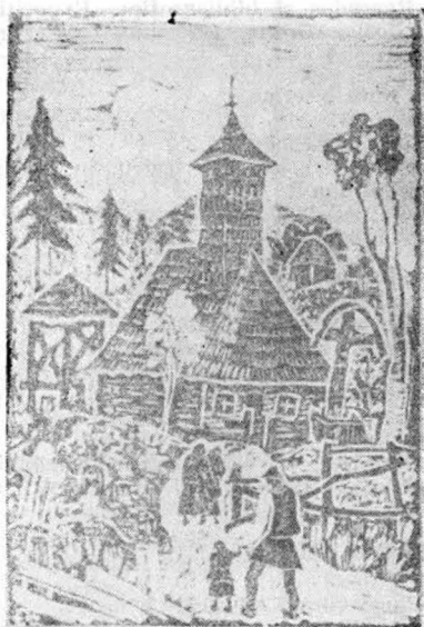
1. Biserica din Maramureș — inv. 10.25