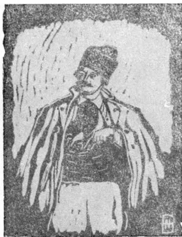
11. Avram Iancu — inv. 10.214