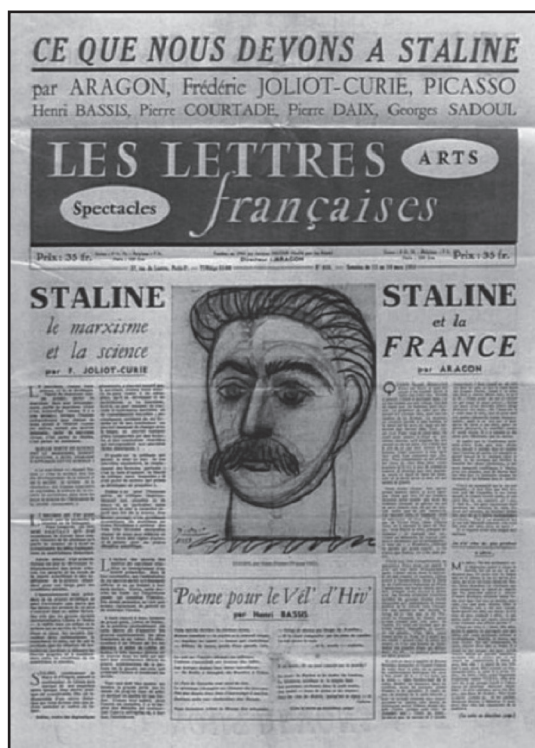
Fig. 6, Pablo Picasso, Portretul lui Stalin în Les lettres francaies