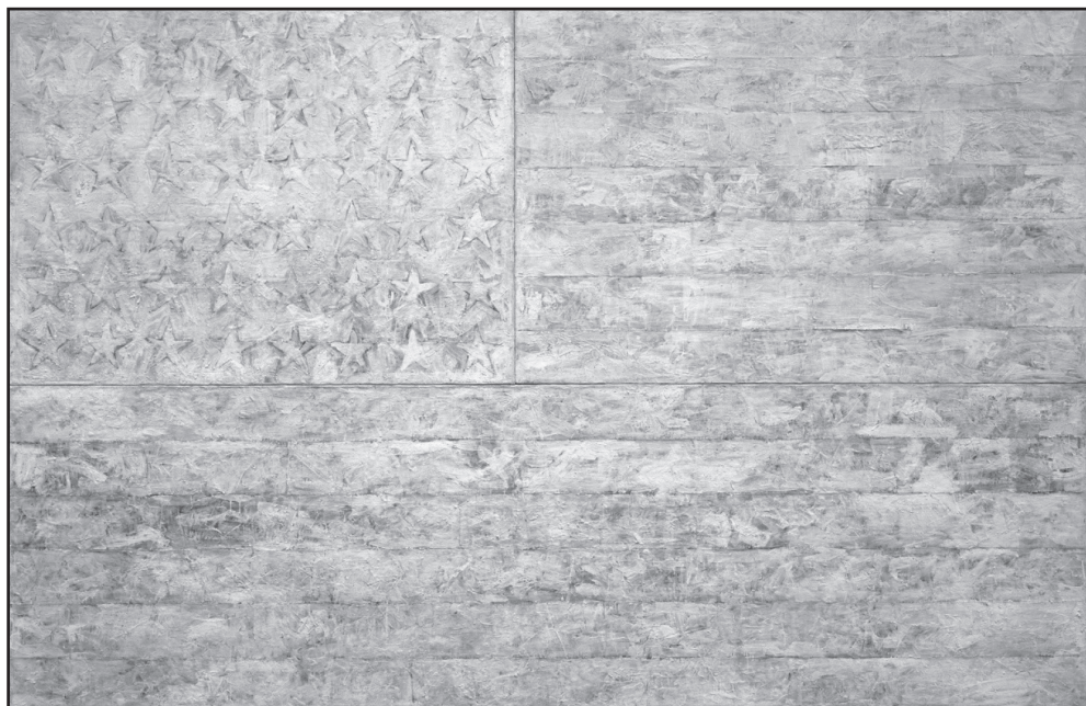
Fig. 3, Jasper Johns, White Flag (Steagul Alb)