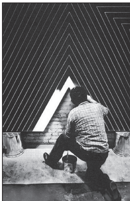
Fig. 2, Frank Stella working on a Black Painting (Frank Stella lucrând la Picturi Negre )