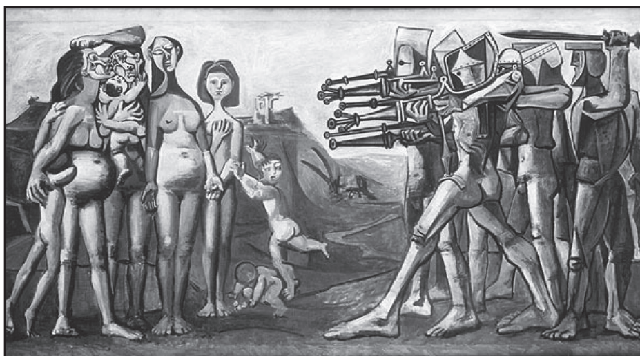
Fig. 5, Pablo Picasso, Massacre in Korea, 1951