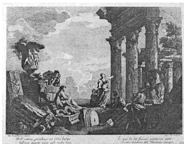
11.) SACRE COLONNE DE VACCINIO CAMPO