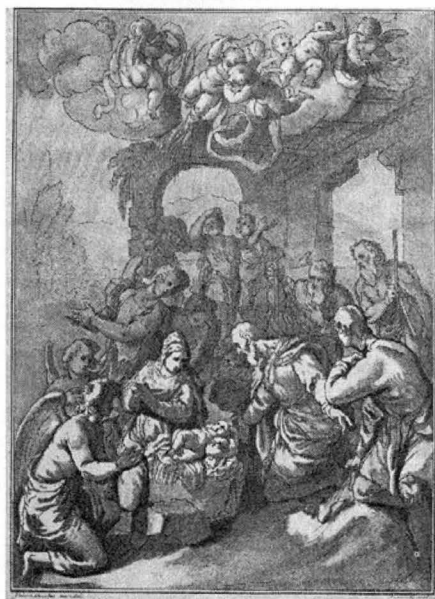
21.) ADORAȚIA PĂSTORILOR