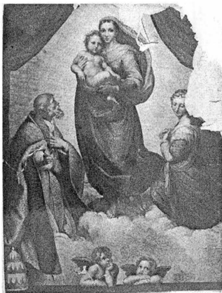
5.) MADONA SIXTINA