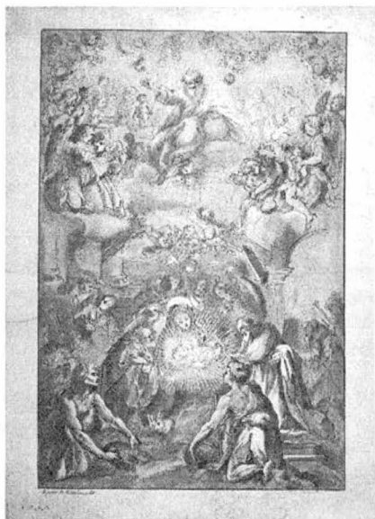
20.) ADORAȚIA PĂSTORILOR