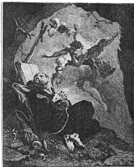
2.) SFÂNTUL FRANCISC PRIMIND STIGMATELE