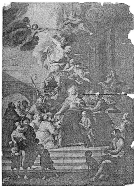
8.) ÎMPĂRȚIREA DE DARURI SĂRACILOR