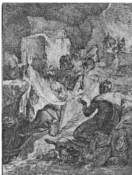
7.) PETRECEREA LUI LOT