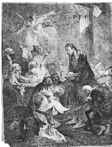
1.) CINA CEA DE TAINĂ

TICOZZI, Stefano, Dizionario degli architetti, scultori, pittori, intagliatori in rame ed in pietra, coniatori di medaglie, musicisti, niellatori, intarsiatori d'ogni età e d'ogni nazione , Milano, Presso Gaetano Schieppatti, MDCCCXXX, 4 vol.