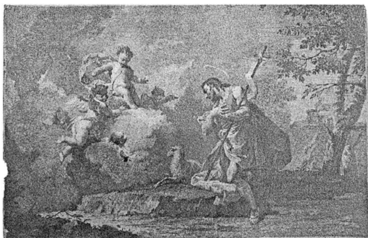
6.) IOAN BOTEZĂTORUL