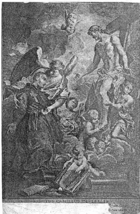
14.) SANCTUS CAMILLUS DE LELLIS

13.) VIZITA LUI FERDINAND AL III -LEA, DUCE DE TOSCANA LA PAPA PIUS AL VI-LEA