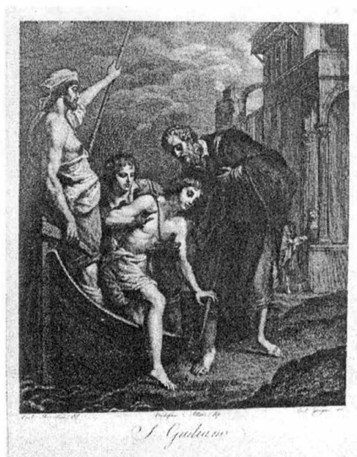
15.) S. GIULIANO