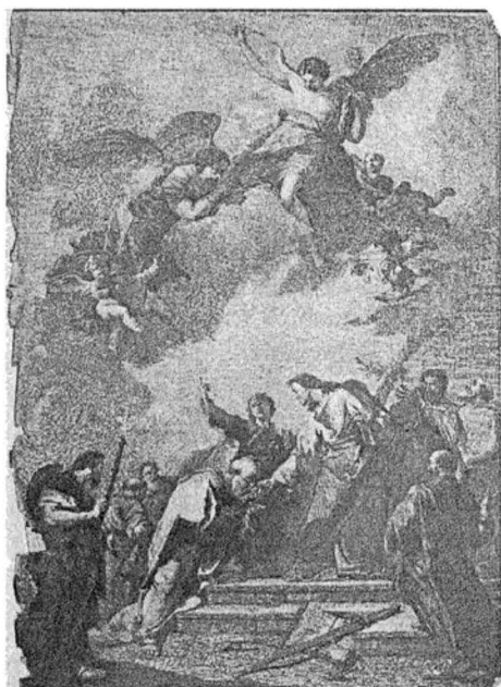
4.) IISUS DĂ CHEIA APOSTOLULUI PETRU