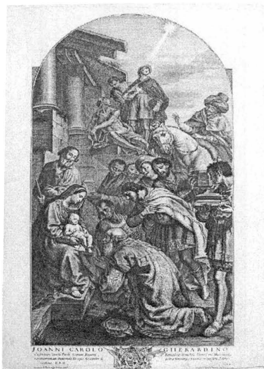
12.) ÎNCHINAREA MAGILOR