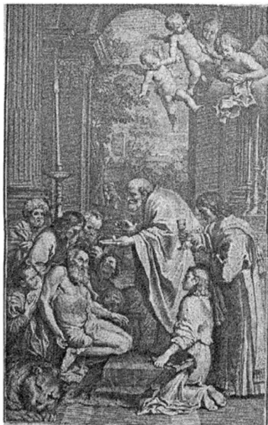
3.) ÎMPĂRTĂȘANIA SFÂNTULUI IERONIM