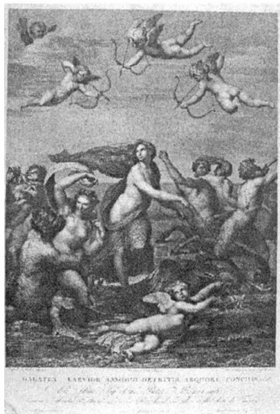
19.) TRIUMFUL GALATEEI