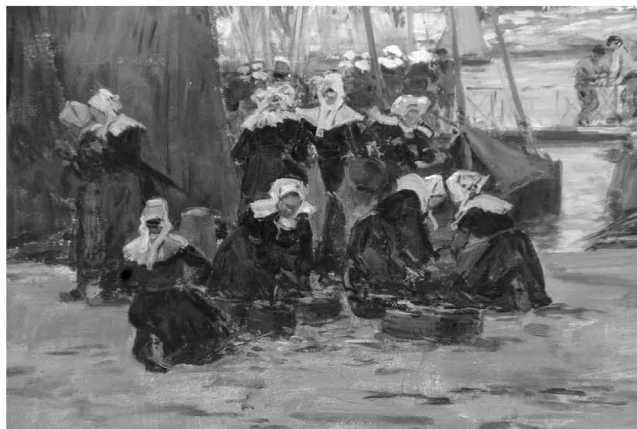
Fig.nr.6. Le Gout Gerard Fernand, Vedere dintr-un port breton ,detaliu