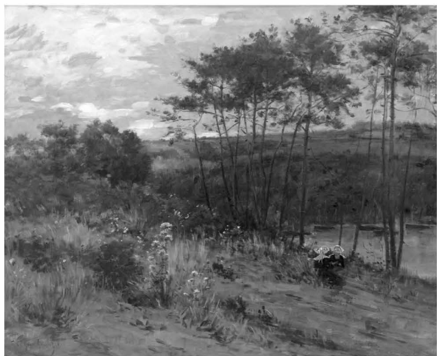
Fig.nr. 7. Le Gout Gerard Fernand, Femei pe malul apei , ulei / pânză, 385x465mm, semnat stânga jos cu roșu F. Le Gout Gerard, datat 1897, inv. 580