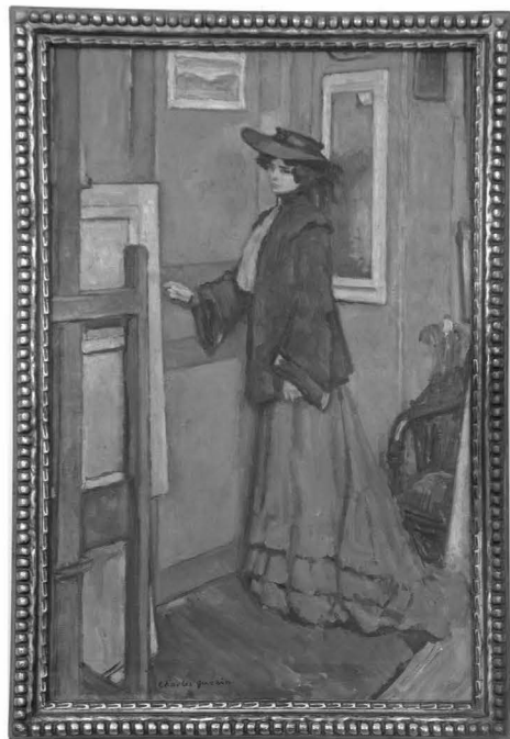
Fig. nr.10. Guérin Charles Francois Prosper, Hélène , ulei / pânză, 925x605mm, semnat stânga jos cu negru Charles Guérin, nedatat, inv.18