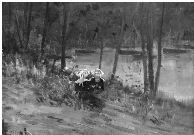
Fig.nr. 8. Le Gout Gerard Fernand, Femei pe malul apei , detaliu