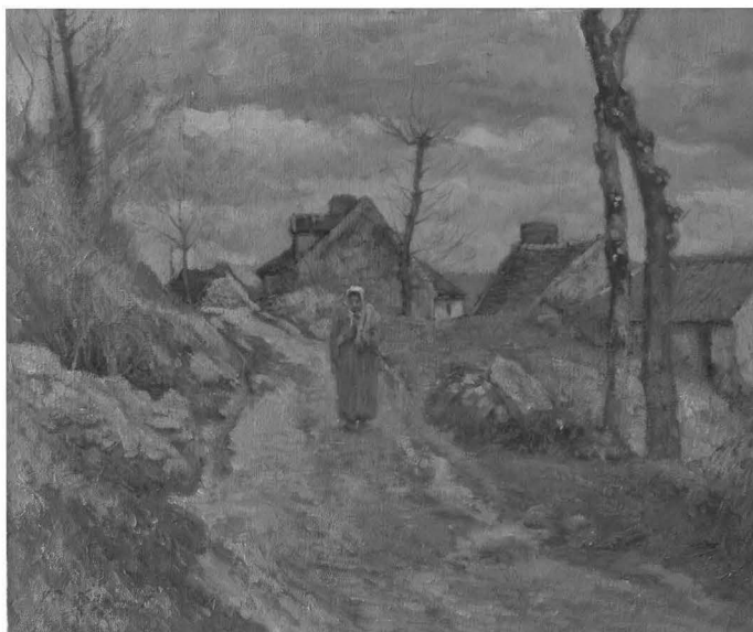
Fig. Nr. 4. Victor Vignon, Vechiul drum la Saint Nicolas , ulei / pânză, 325x405mm, semnat stânga jos, cu negru V. Vignon, nedat, inv. 5