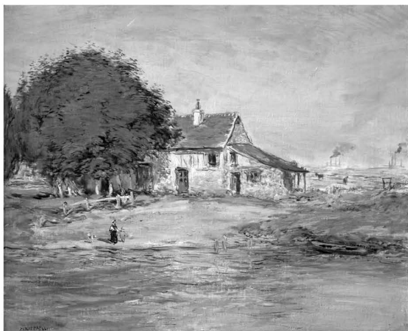
Fig. Nr.9. Casă pe malul apei , ulei și creion / pânză, 385x470mm, semnat stânga jos cu negru Raffaelli, nedatat, inv.8