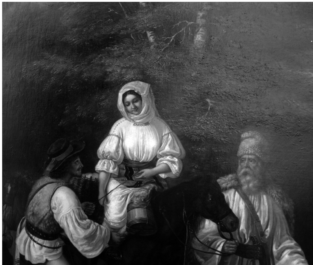
Fig. nr. 2. Barabás Miklós, Familie de țărani sălișteni mergând la târg , detaliu