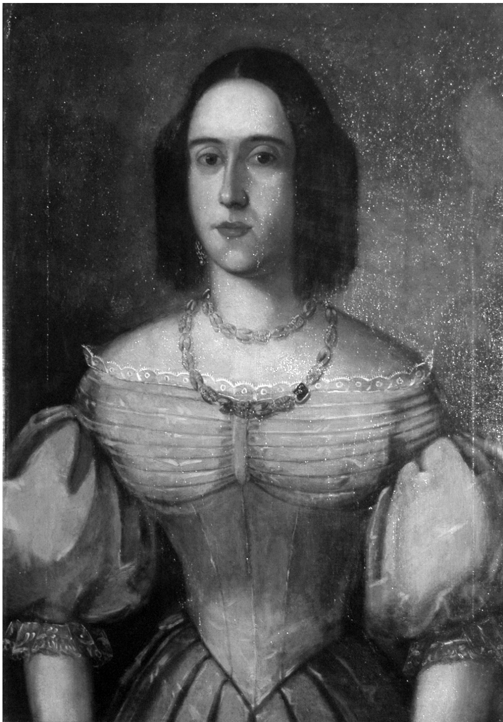
Fig. nr. 5. Anonim austriac, Femeie în albastru , ulei pe pânză, 700x550mm, Prov. Sfatul popular al orașului Oradea, inv. 123