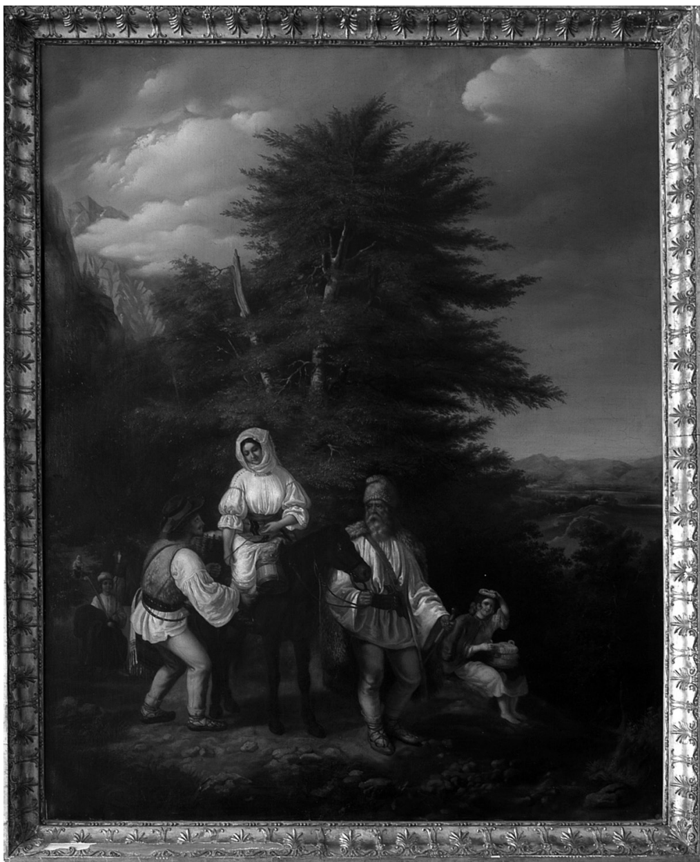
Fig. nr. 1. Barabás Miklós, Familie de țărani sălișteni mergând la târg , ulei pe pânză, 1480x1190mm, Transfer de la Muzeul de Artă al României, nesemnat, nedatat, inv. nr. 581