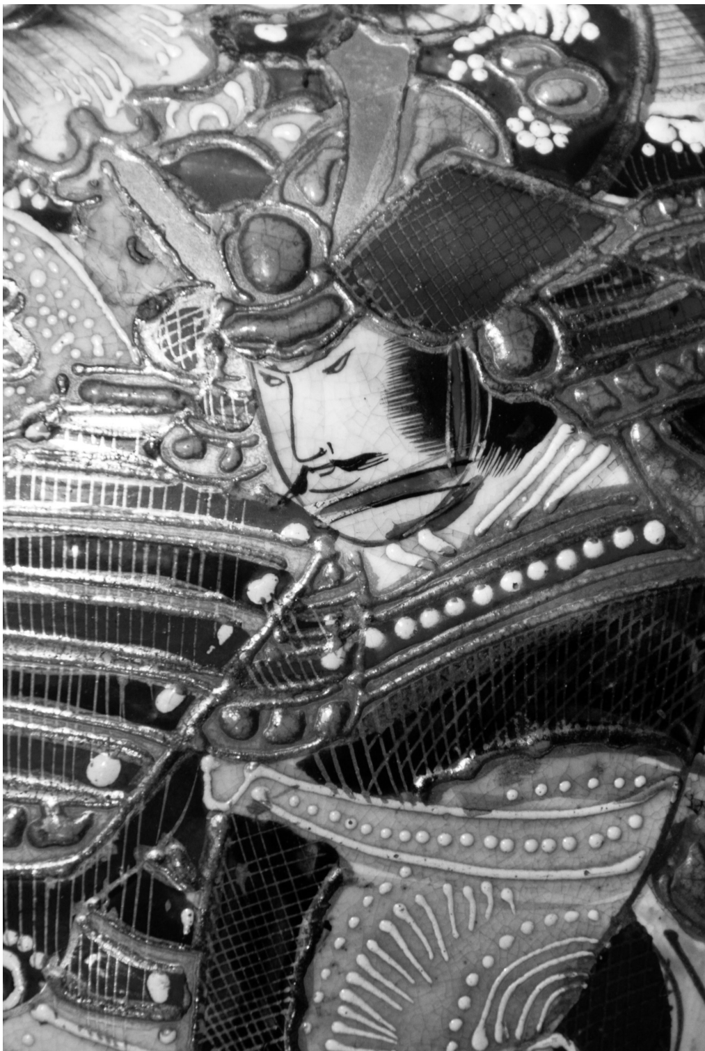
Fig. 2. Detaliu samuraiul Saigo Takamori