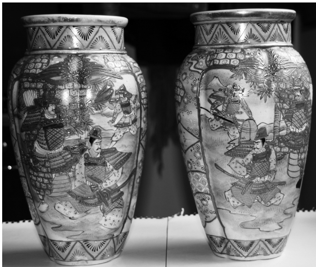
Fig. 7. Vaze în oglindă pentru Flori, faianță Sarsuma, înc. sec. al XX-lea col. M.Ț.Cr. Oradea