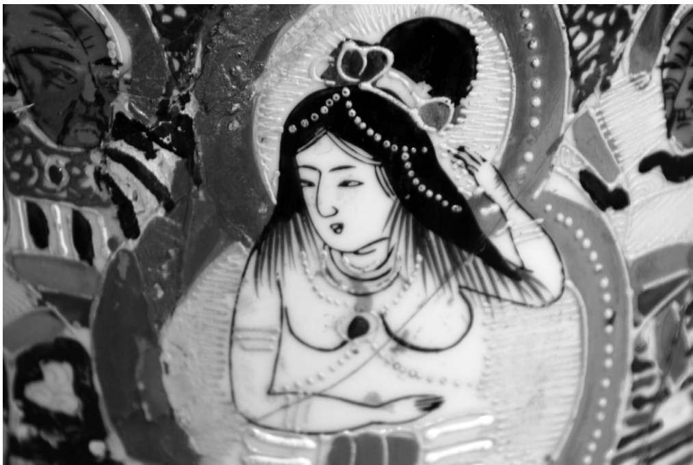
Fig. 11. Detaliu zeița Amaterasu