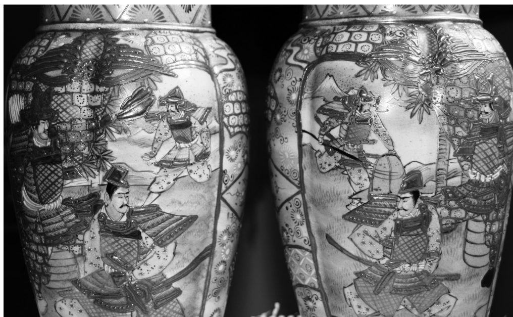
Fig. 8. Detaliu samurailor Saigo Takamori și Kido Koin