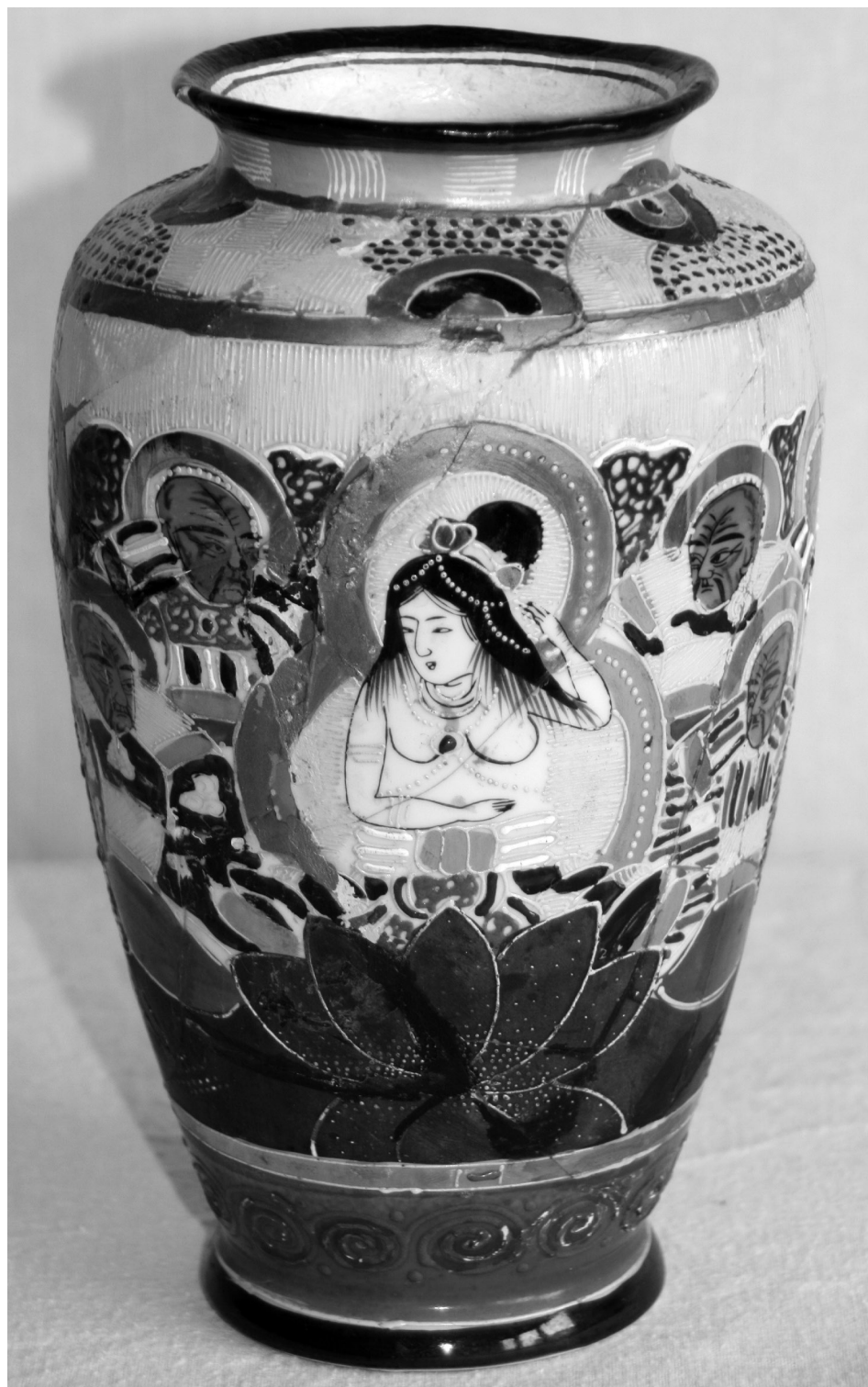
Fig. 10. Vază pentru flori „Nemuritorii”, faianță Satsuma, înc. sec. al XX-lea, col. Tamas Alice, Oradea