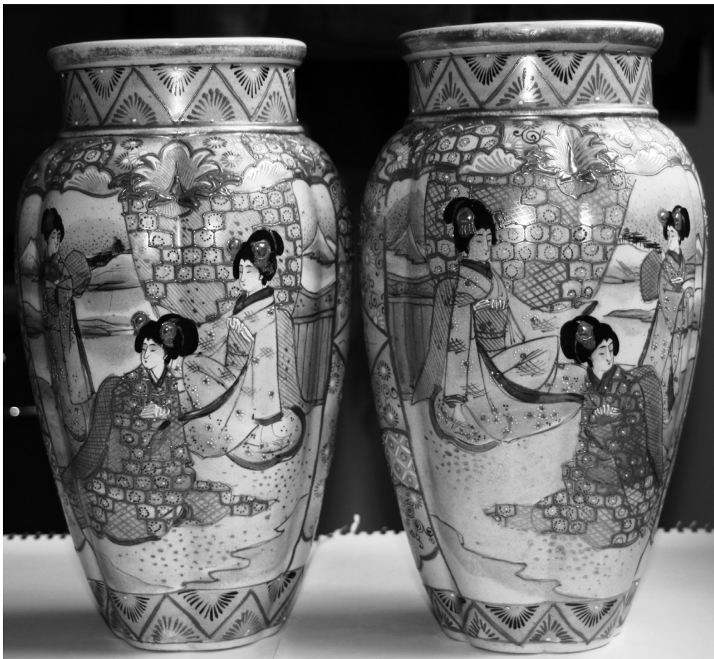
Fig. 9 Detaliu peisaj cu geishe