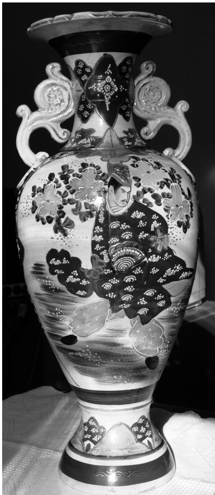
Fig. 1. Vas de podea, faiantă Satsuma, sf. sec. al XIX-lea, col. M.Ț.Cr. Oradea