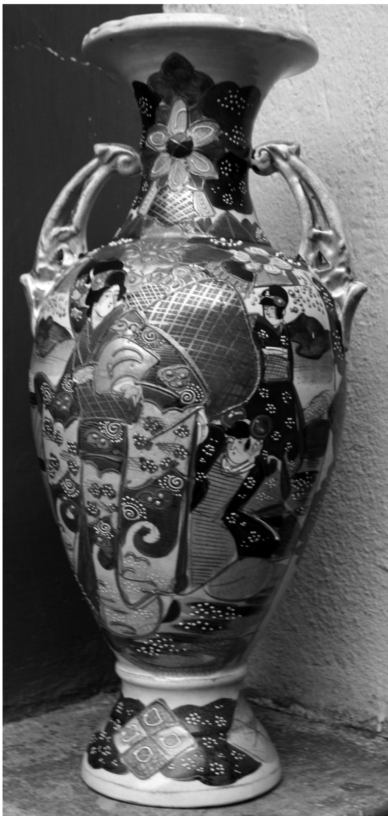
Fig. 4. Vas de podea, faianță Satsuma, sf. sec. al XIX-lea, col. Paul Indig Oradea