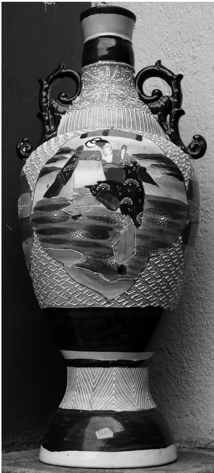
Fig. 6. Vas de podea , faianță Satsuma, înc. sec. al XX-lea, col. Paul Indig Oradea