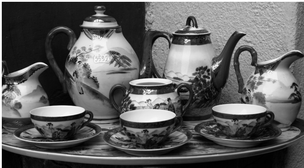
Fig. 13. Servici de ceai „Eggshell”, porțelan, peisaj cu geishe, înc. sec. al XX-lea, col. Paul Indig, Oradea