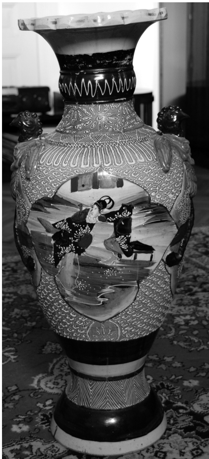
Fig. 5. Vas de podea, faianță Satsuma, înc. sec. al XX-lea, col. Anca Luana Ionescu, Oradea