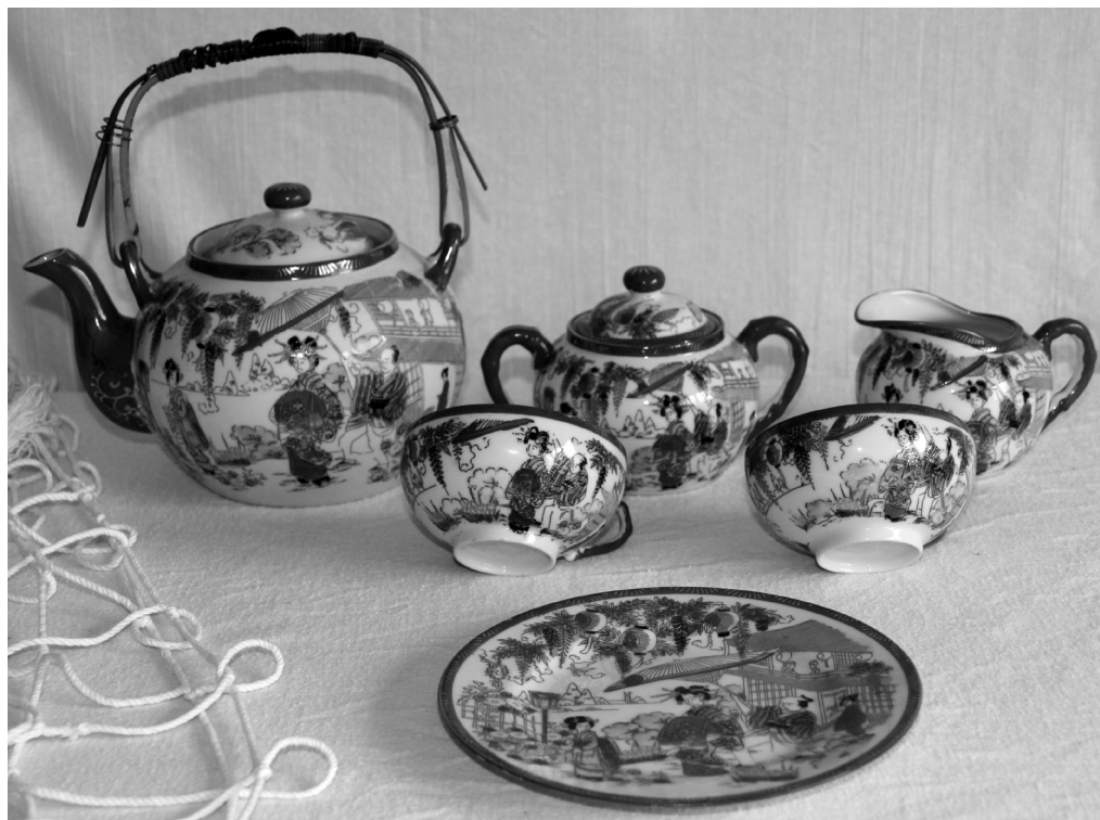
Fig. 14. Servici de ceai „Eggshell” ,porțelan, peisaj cu geishe, înc. sec. al XX-lea, col. Tamas Alice, Oradea