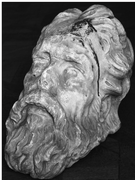
Fig. 2 Cap de profet, detaliu, semiprofil stânga