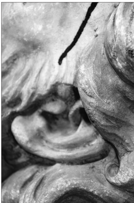
Fig.7. Cap de profet,detaliu, lobul urechii stângi