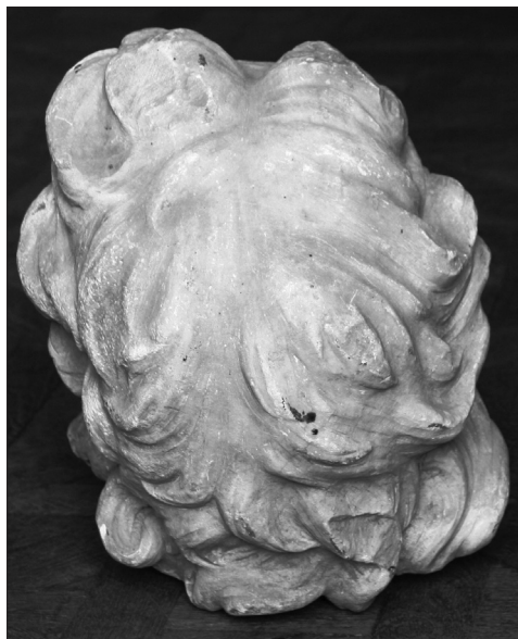
Fig. 3. Cap de profet, detaliu, coafura din partea occipitală