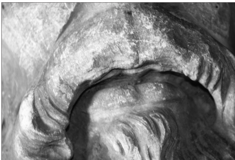
Fig.6. Cap de profet, detaliu gură