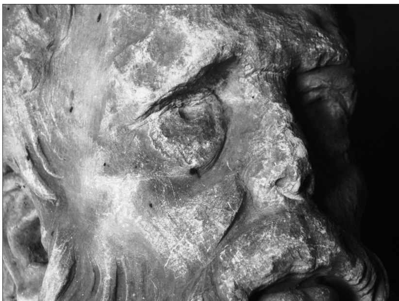
Fig.5. Cap de profet, detaliu portret