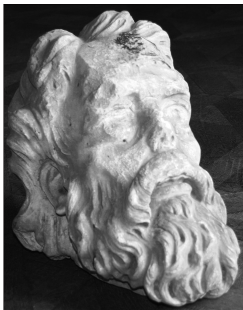
Fig.1. Cap de Profet, inv. S.327, nesemnat, nedatat, sec. XV(?), atelier transilvan, marmură, Colecția de sculptură a Muzeului Țării Crișurilor Oradea.

Lucrarea se evidențiază prin expresivitatea feței redată în momentul unei revelații, sugerată prin capul și privirea ridicate spre cer. Proporțiile capului (din punct de vedere antropologic de tip oligocefal din aria nord germanică) sunt mult prea exagerate față de canoanele clasice grecești, prin alungirea feței și nasul mult prea scurt. Epiderma în pliuri asemănătoare icoanelor medievale, evidențiază o față slăbită, osoasă pentru redarea cât mai fidelă a stării ascetice și a vârstei înaintate. Fruntea este prelucrată cu volume mari, plate, nefinisate, ochii cu privirea spre lumea transcendentă fiind abia schițați, aplatizați pentru impresia de iluminare în timpul unei viziuni. Cu zone nefinisate și zone șlefuite pe obraz, gura este întredeschisă într-o stare de rugăciune, evlavie; urechile specifice unei vârstei juvenile, sunt reprezentate naturalist, iar părul, mustățile, barba sunt descrise amănunțit prin bucle voluminoase