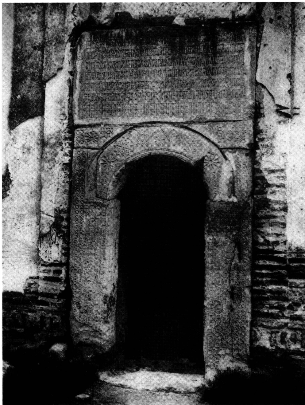
Mănăstirea Plăviceni - Portalul cu ancadramentul sculptat în piatră și pisania -