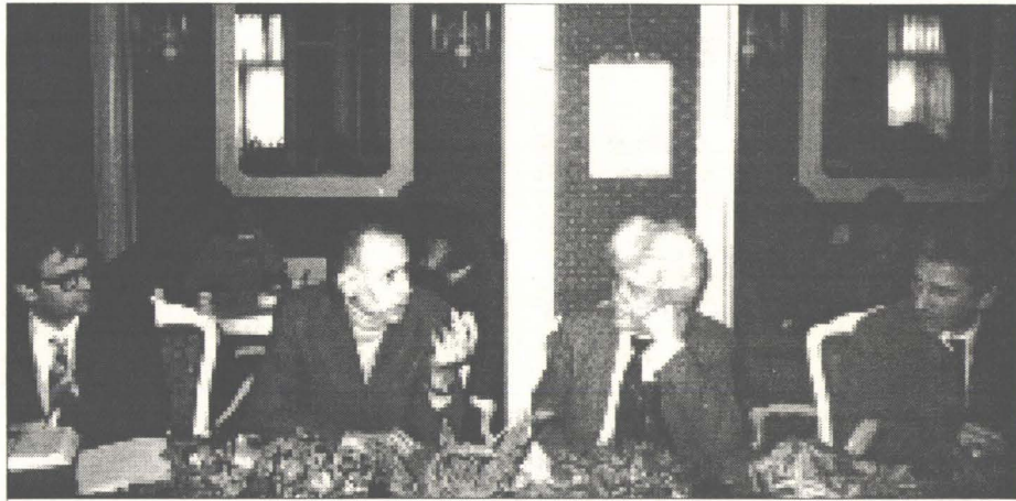
Masă rotundă: „Platforma Prieteniei la 5 ani“