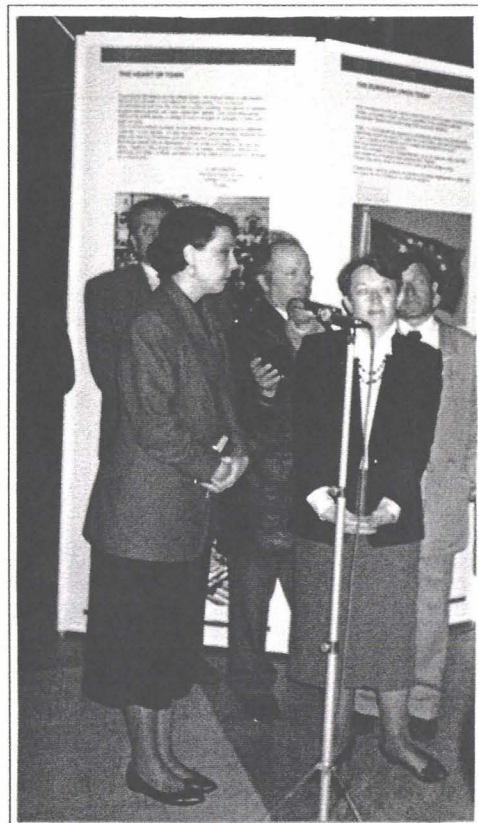
Karen Fogg, ambasadoarea Uniunii Europene, vernisînd expoziția Piețele Orașelor Europene

numele, a rostit celebra frază: "Europa nu se va face printr-o lovitură, nici printr-o construcție de ansamblu: ea se va face prin realizări concrete creînd mai întîi o solidaritate de fapt". În numele acestei "solidarități de fapt" care a transformat Europa războaielor în Europa bunăstării - aniversînd totodată și cincizeci de ani de la sfîrșitul războiului mondial -, a organizat și Centrul Inter-