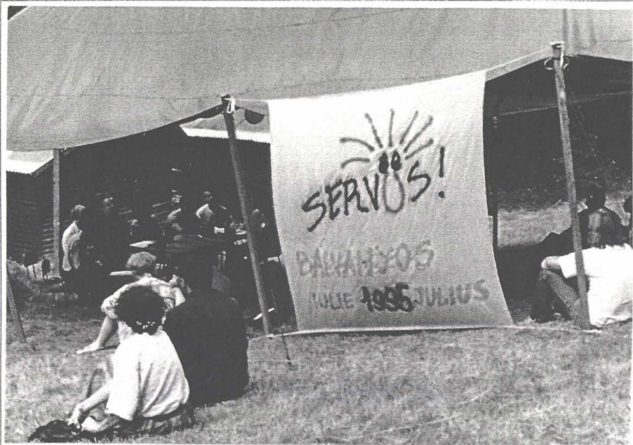
Un salut atotcuprinzător...

zgomotul asurzitor al muzicii rock, la taclale, amestecînd cuvintele și descoperindu-și gusturi comune, au neutralizat stereotipii și s-au pregătit psihologic pentru a-lîntzege și respecta pe celălalt. În paralel, în holul Hotelului Carpați, se desfășurau înfîlnirile informale dintre intelectuali, politicieni și lideri de opinie din cele două țări, animați de bună-voință, dar și temeri sau suspi-