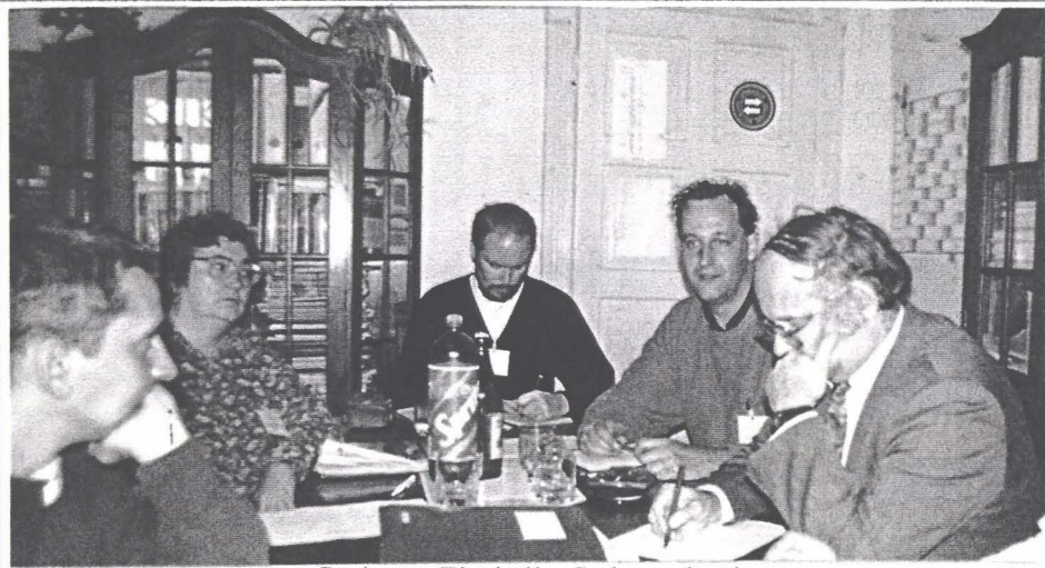
Sesiunea Ziaristilor Independenți

Întîlnirea de la Tîrgu Mureș a prilejuit un schimb benefic de idei, sincronizarea activi-