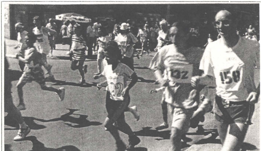
Crosul Pro Europa la a III-a ediție

Dar nu sîntem romantici, nu sîntem fanatici, și nu ne amăgim.