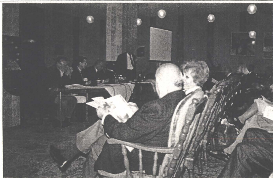
Conferința ecologică internațională „Limpezimea rîurilor comune”

Chiar dacă cuantificarea impactului social al proiectelor noastre este imposibilă, putem, credem noi, conchide, că dacă fiecare participant al celor cinci manifestări atît de diferite ca profil, nivel sau arie de răspîndire, va putea deveni un multiplicator al ideilor europene pentru cel puțin alte două persoane, ciclul de manifestări desfășurate sub genericul ZILELE EUROPA NAPOK și-a atins pe deplin scopul. Avem convingerea că într-o bună zi raportul de răspîndire va crește chiar în progresie geometrică. Atunci, propagandiștii de astăzi ai autohtonismului conservator vor fi probabil cei mai înflăcărați susținători ai acestor idei. Așteptăm cu răbdare ziua. (SZ.E.)