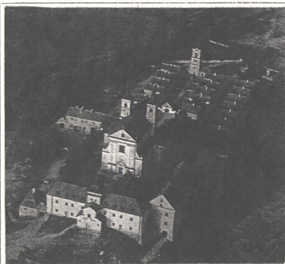
Wigry — fosta mănăstire cameduliană

Ceea ce a readus Fundația în atenția noastră este cel mai recent proiect al său, intitulat „ Borderland School ”, la care am fost invitați să conferențiem despre Transilvania (istorie, comunități specifice, identitate regională, interculturalitate). Școala are o durată de 1 an, studenții — în număr de șazecei — provin din Polonia, Lituania, Ucraina, Bielorusia și sînt selecționați în funcție de competența lor și implicarea în domenii legate de cercetarea multiculturalității. Cursurile sînt organizate pe trei dimensiuni: managementul organizațiilor neguvernamentale, teoria multiculturalității și stagiul practic, fiind conduse de experți vest și est-europeni. Școala este finanțată de Uniunea Europeană, în cadrul Programului PHARE. Cursul inaugural din Săptămîna 1-6 iunie 1996 a fost găzduit în splendid renovată mănăstire cameduliană de la Wigry și a permis primei serii