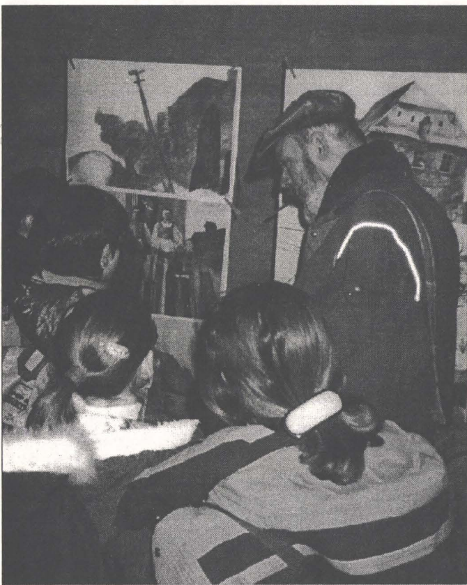
Elevii Liceului de Artă în vizită la expoziția Saschiz — Recviem pentru o comunitate