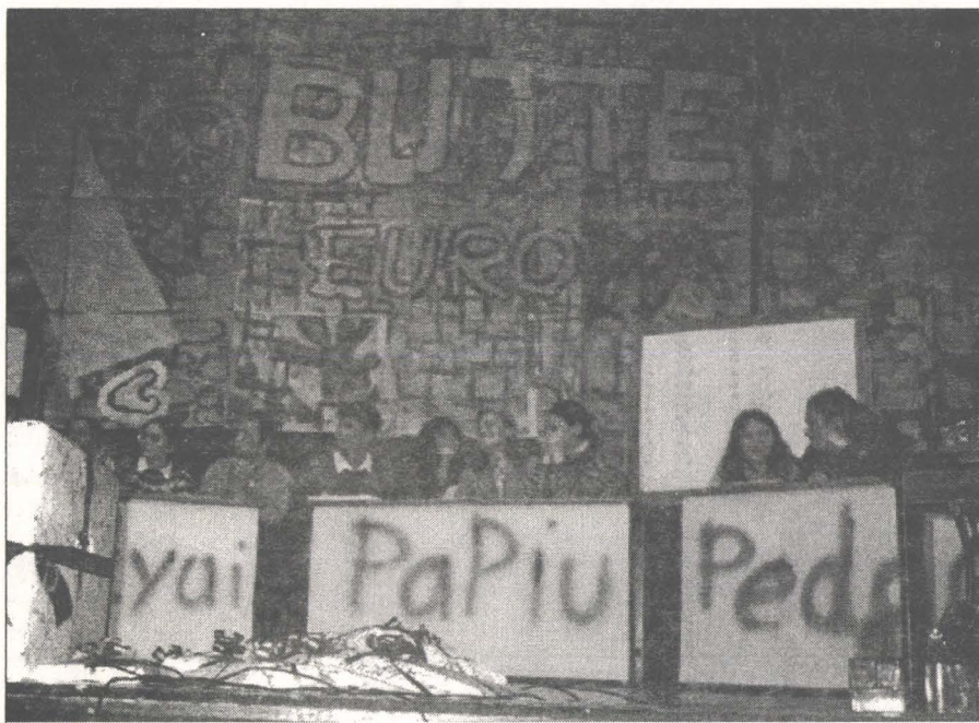
Concursul cu premii Toleranță — intoleranță

În cadrul Săptămîinii Toleranței, în data de 21 martie a.c. a avut loc în Sala Studio a Academiei de Artă Teatrală, concursul cu premii „Toleranță — Intoleranță”. La acest concurs au participat echipele formate din cîte patru elevi, cîte doi de la secția română, respectiv secția maghiară a celor patru mari licee țirgumureșene: Unirea, Papiu, Bolyai și Școala Normală „Mihai Eminescu”.