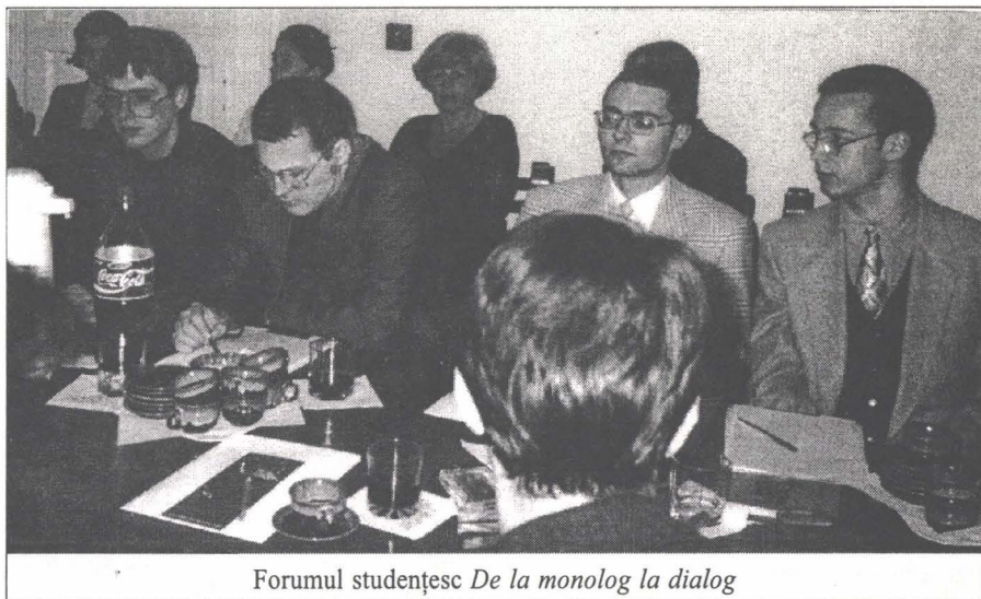
Forumul studențesc De la monolog la dialog

Deși concluzia participanților a fost că relațiile actuale ale studenților români și maghiari, respectiv ale asociațiilor lor studențești, sînt incomparabil mai bune decît acum cîțiva ani, și asta mai ales datorită deschiderii liderilor acestora, repetarea unor astfel de Forumuri, pe cele mai diverse teme de interes studențesc, ar fi nu numai binevenită dar și necesară. (M.I.)