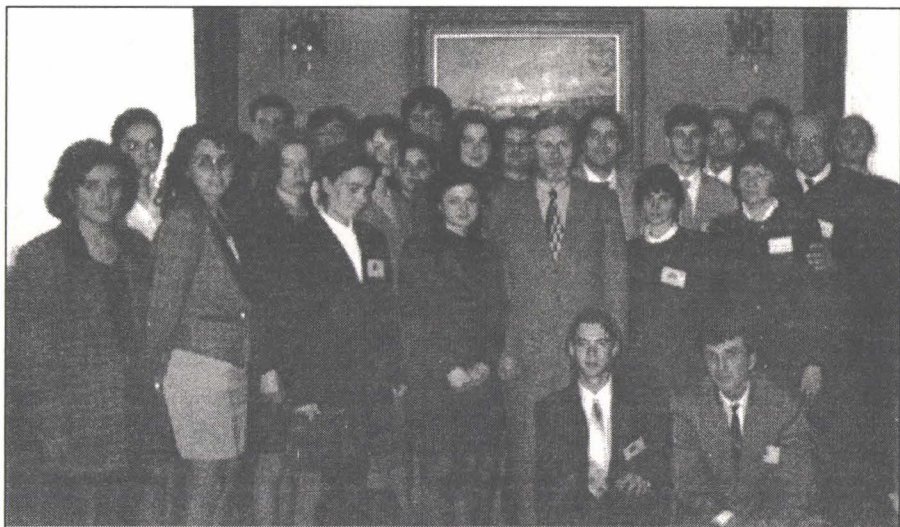
Studentii CD-ului împreună cu președintele României, dl. Emil CONSTANTINESCU

Programul zilei următoare ne regăsește la Camera Deputaților, în impozantă și afît de mediatizată Casă a Poporului, pe ale cărei coridoare i-am întîlnit, întîmplător sau nu, și pe reprezentanții mureșeni în Parlament. Dar sarea și piperul acestei incursiuni au fost adăugate în timpul unei dezbateri pe tema preconizatei reforme a învățămîntului românesc, între cîțiva membri ai Comisiei pentru Învățămînt și membrii Colegiului Democrației.