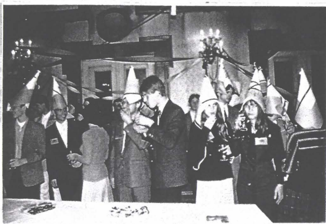
Începem cu plăcutul: balul bobocilor democrației...

Faptul că România a pornit pe drumul respectării regulilor democrației, a dreptu-