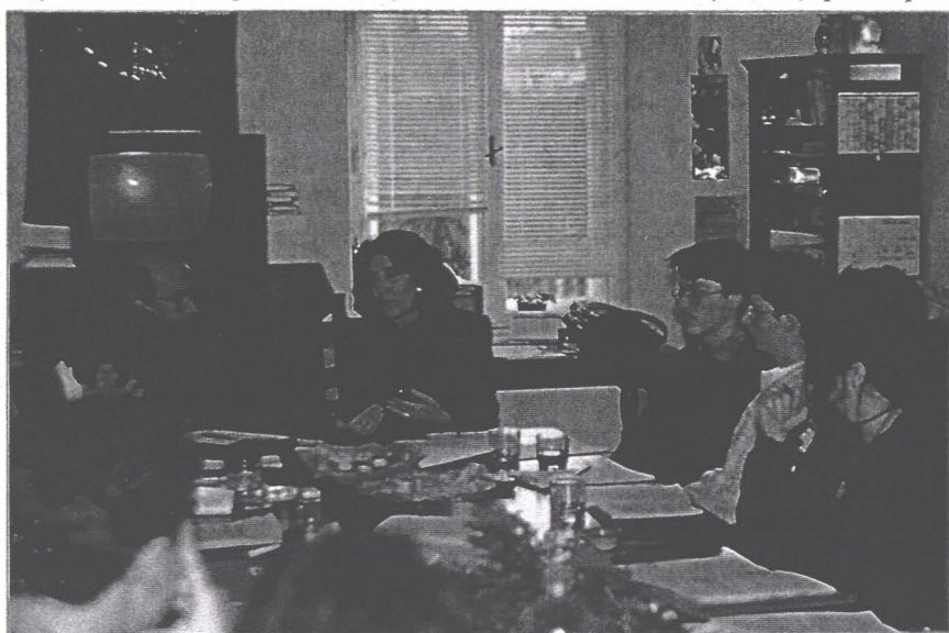
... și continuăm cu utilul: prima lecție a democrației.

homo politicus . ONG-urile care au lucrat sub regimuri opresive reflectă adeseori în activitatea lor tendințe nedemocratice. În perioada de tranziție către