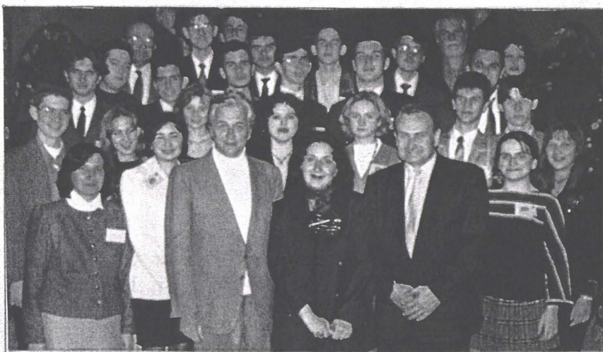
Colegiul Democrației, ediția a IV-a, 1997-1998