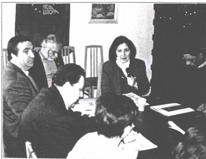
Integrarea rromilor în societate e și în interesul majorității