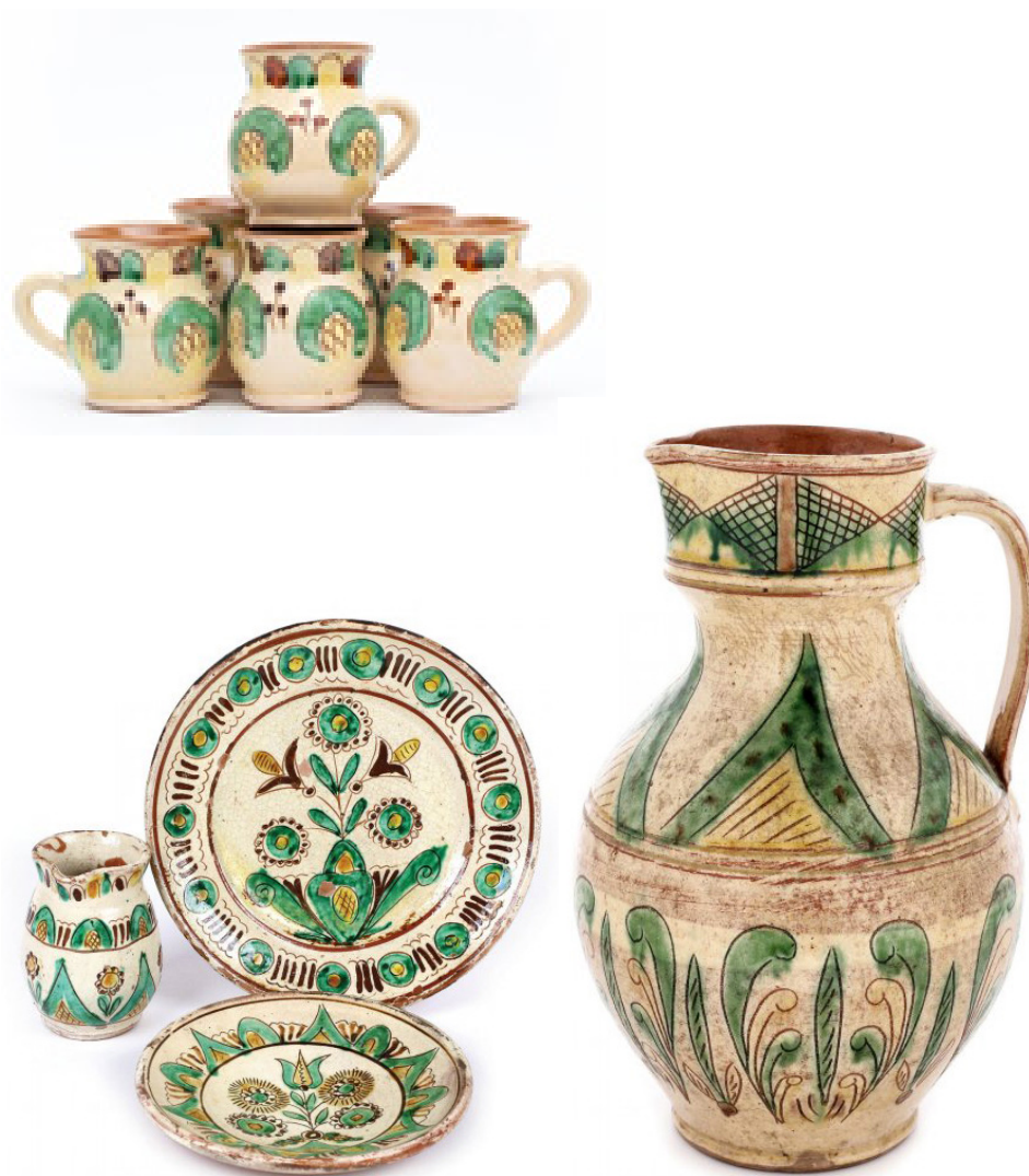
Ceramică de Kutu (Botoșani) - cănițe, farfurii, ulcior