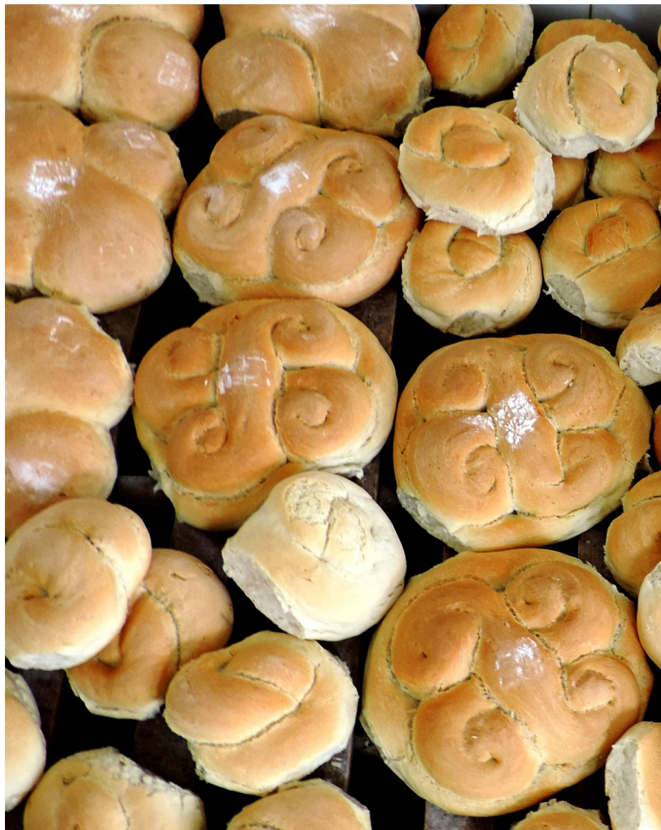
Colcaci funerari pristorniciți - 2010, județul Gorj.

atașat un mâner-apucătoare. Suprafața plană a plăcuței este acoperită cu motive spiralice sau unghiulare (zig-zag-uri, cruci etc.), realizate în tehnica exciziei sau a inciziei. Prin analogie, pintadera este asemănătoare ca formă cu pristolnicul.