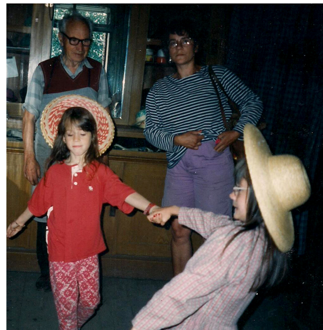
Atelierul Josif Tischler - spațiul destinat clienților.

Presa hidraulică funcționa cu apă la o presiune de 6 atmosfere și era folosită pentru călcat. Pe vremuri exista o sobă cu petrol, iar ulterior s-a trecut pe gaz. Pe urmă se pune din nou pe calapod și se lua o formă de lemn și se tăia marginea pălăriei cu cuțitul, exact distanța care se dorește, special pe calapod-colac.