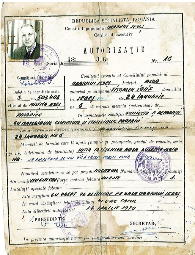
Autorizație de funcționare a atelierului de pălărier Josif Tischler din 17 aprilie 1970.

expresă a lui Ludovic - ca la masa comună să își păstreze pălăria pe cap, cu condiția, ca ori de câte ori se conversa cu regele, să își descopere capul. Pe vremea aceea se mânca cu mâinile, tacâmurile fiind, practic, necunoscute. Ne putem imagina cu ușurință cum arăta pălăria regelui englez la finalul mesei 4 . În secolul al XVI-lea, în Europa, pălăriile erau considerate un accesoriu destinat exclusiv membrilor de rang înalt ai societății 5 , fiind confecționate în diferite forme: conice, pătrate cu onduleuri. Pălăriile cel mai des întâlnite, erau cele bărbătești, confecționate după moda spaniolă - înalte, din fetru (pâslă din fibră fină), închise la culoare, cu borul întors în față, decorate cu o cataramă sau o broșă prinse pe o panglică și uneori cu pene 6 . Pălăria își depășește condiția de necesitate și devine încet, dar sigur, un accesoriu la modă, un însemn social. În secolul al XVII-lea, în moda pălăriilor bărbătești a fost creată pălăria bicorn și tricorn din fetru negru, cu panglici aurii și pene de struț. Pălăriile de damă și-au început ascensiunea tot în acea perioadă, devenind unul dintre cele mai controversate accesorii, cunoscând evoluții spectaculoase de-a lungul timpului.