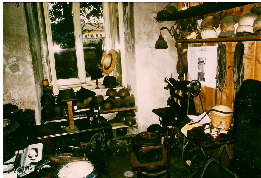
Atelierul pălărierului Josif Tischler, 2003.

avea următoarea compoziție: trei uncii păr de vidră, \frac{1}{2} uncie păr de castor, \frac{1}{2} uncie lână roșie, două uncii de păr netratat de vidră. Din aceste materiale se confecționau patru bucăți egale de fetru, care se uneau prin udare și pâslare. Acest fetru era dat la piuă într-un cazan cu apă și vin din drojdie; apoi, pălăria se trăgea peste o formă și se lăsa la uscat 8 .