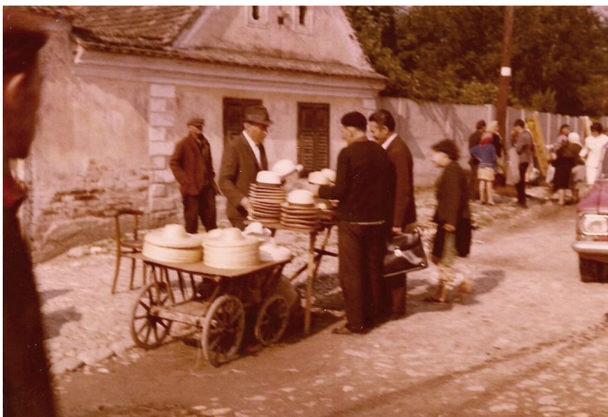
Târgul din Sebeș- Pălării de vânzare.