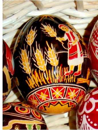
Spic de grâu pe „ouă muncite” de Iolanda Fejer, Brașov.