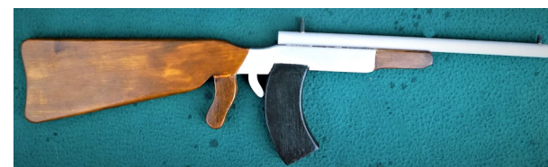
Pușcă din lemn.