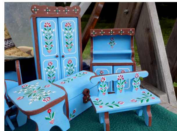
Mobilier țăranesc pentru păpuși.