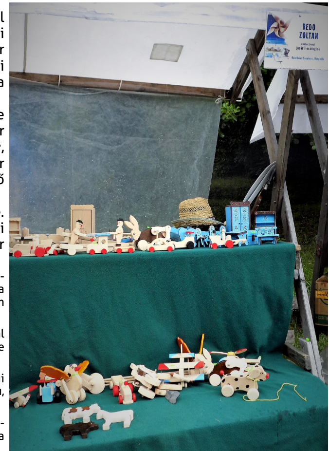
Jucării din lemn.