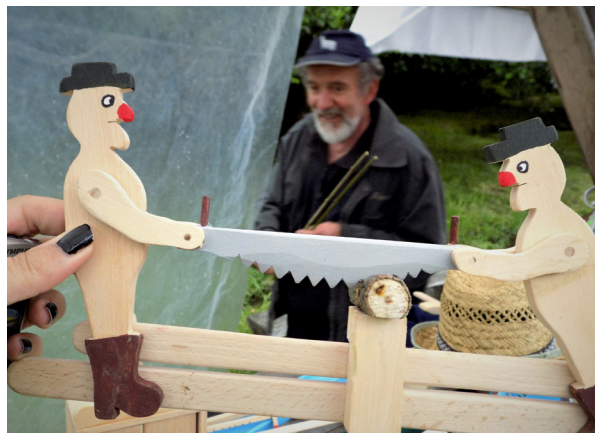
Tăietori de lemn cu fierăștrăul.

ce a fost lipsit de instrumente demonstrative atractive pentru elevii claselor a VI-a și a VII-a: „Proiectez jucării cam de vreo 20 de ani. (...) Atunci nu aveam materiale didactice prin care se puteau demonstra legile fizicii. (...) Și m-am gândit să fac ceva în acest sens. Și iată! Am jucării cu care se pot studia legile fizicii: forța de frecare, centrul de greutate al corpurilor, echilibrul corpurilor, forța gravitațională” 6 .