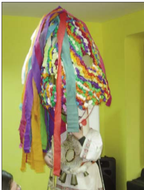
Mască de cuc - Brănești, 2 martie 2009