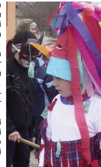
„Cuc” și „Batman” - lovirea rituală

Ziua Cucilor sărbătorită pe 2 martie 2009 în satul Brănești din județul Ilfov reprezintă un moment-cheie al calendarului popular, deoarece, ca în orice moment cosmogonic, și acum instituirea ordinii este precedată de o etapă în care lumea este redusă la haos prin intermediul răsturnării ierarhiilor și al încălcării intenționate a regulilor și este o marcă identitară a minorității bulgare din România.