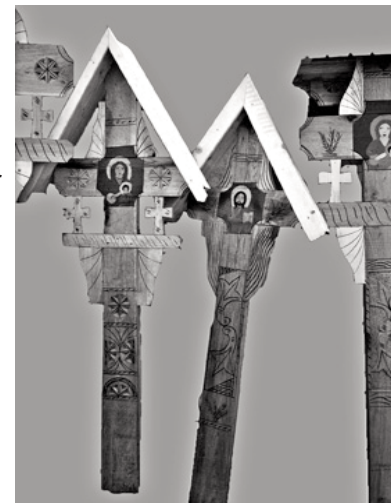
Crucile - semne și însemne

Marianne Mesnil, în prefața pe care a scris-o amintitei lucrări, pornește de la definiția culturii aparținând lui L. U. Thomas, potrivit căruia „ceea ce numim cultură nu este nimic altceva decât un ansamblu organizat de credințe și ritualuri create pentru a se împotrivi efectelor subversive ale morții individuale sau colective”. Renumita cercetătoare este de părere că nicio altă definiție nu pare să fie mai potrivită pentru a caracteriza cultura română, pornind de la ideea că în România moartea ocupă acel loc privilegiat care, în secolul al XIX-lea, l-a determinat pe un occidental rătăcit în estul Europei să scrie