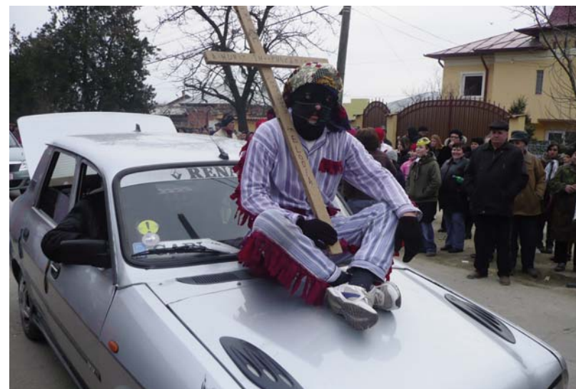
„Înmormântarea“ – Ziua Cucilor – Brănești, 2 martie 2009

Dacă în trecut performerii obiceiului practicau bătutul ritual cu „chiulichiul”, am constatat că în primăvara anului 2009 acesta a fost substituit de o nua sau de simpla atingere pe umăr, însoțite de urarea „Să fii sănătos tot anul!”. Actul de însămânțare rituală, ce se realiza prin tragerea unei brazde rituale în centrul satului și prin aruncarea unor grăunțe în mod simbolic, în prezent s-a simplificat, manifestându-se prin gestul de aruncare a făinii de grâu peste performerii pasivi, care s-au adunat să privească defilarea Cucilor.