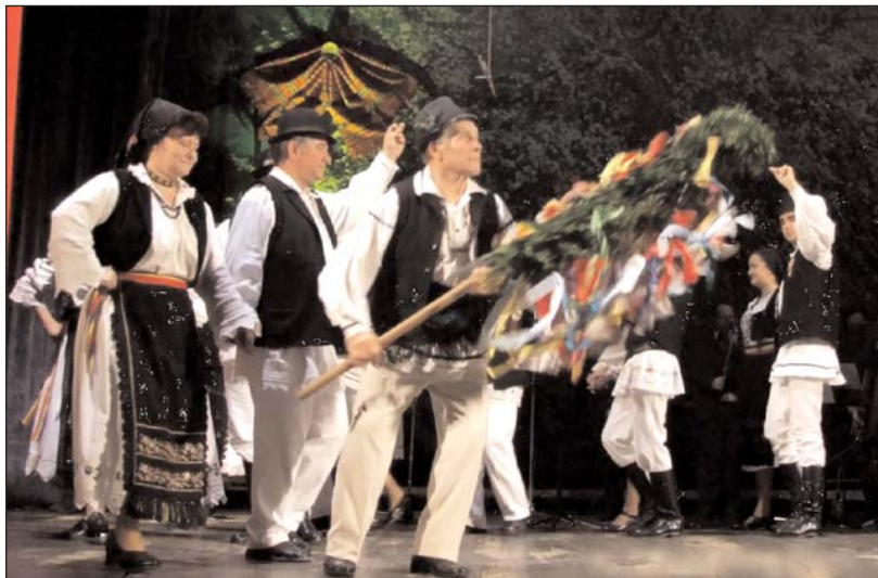
Format9ia de jocuri tradit9ionale "Zorile" din Mociu