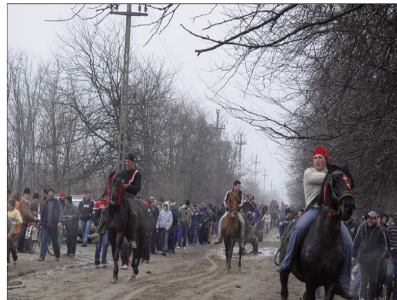
Imagini de la Încuratul cailor - Desa, județul Dolj, 7 martie 2009

Și fiindcă tot este Sâmbăta cailor lui Sântoader, în unele sate din sudul județului Dolj, cum este Desa, avea, și mai are încă, loc obiceiul alergării sau încurării cailor sau, uneori, cailor erau lăsați slobozi să se încure, ferindu-se toți din calea lor. În alte sate, cum ar fi Moțaței și Dobridor, încuratul cailor are loc la Bobotează când, cal și călăreț vin la biserică, iar după ce preotul slobozește