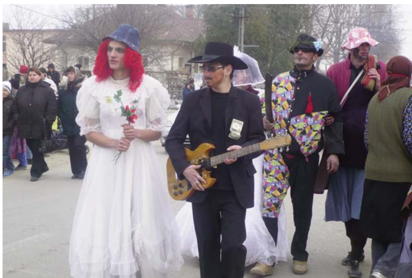
Alaiul de miri, nași și muzicanți – Cucii din Brănești, 2009