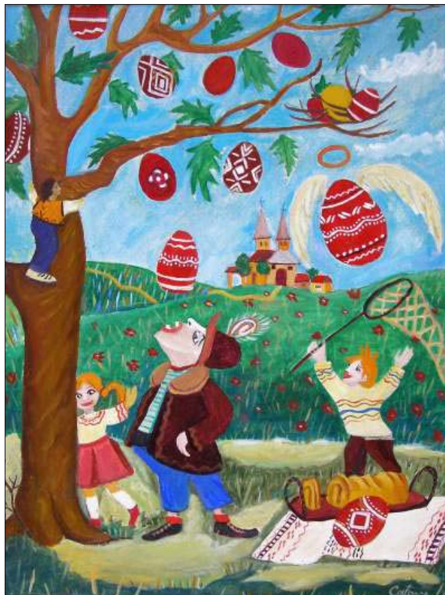
Catinca POPESCU (Bacău) - Pomul Paștelui