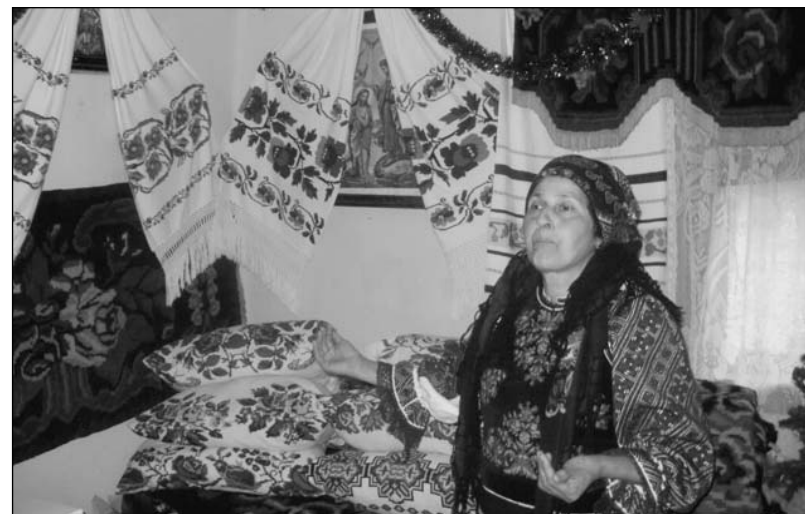
Informatoarea Mina Galben din Susenii Bârgăului

● În fiecare duminică din luna august, Centrul de Cultură și Artă organizează manifestări etnofolclorice la Muzeul Satului din Timișoara, sub genericul „Casa Bănățeană”.