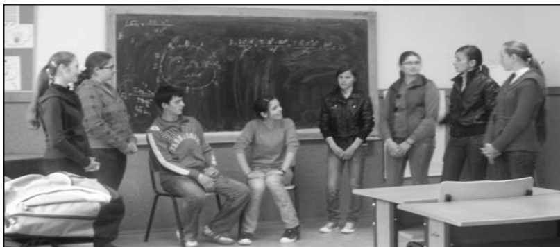
Repetiții pentru șezătoare la Școala din Ilva Mică, jud. Bistrița-Năsăud, 19 aprilie 2010