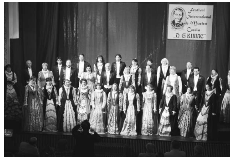
Corul de Cameră „Madrigal”, invitat de onoare al celei de-a XXVIII-a ediții a prestigiosului festival argeșean

Astăzi, centrul ceramic Horezu continuă să fie un adevărat creuzet al creației ceramice românești, izvorul tradiției pulsând încă viu în viața comunității. Ca și odinioară, olarii contemporani - descendenți ai unor vestite familii precum Frigură, Vișoreanu, Iorga, Mischiu, Pop - trăiesc pe aceeași vatră strămoșească, devenită astăzi strada cu numele Olari; ei modelează argila cu aceeași neîntrecută