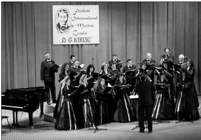
Corala „Ioan Cristu Danielescu” din Ploiești, pe scena Festivalului Internațional de Muzică Corală „D. G. Kiriac”