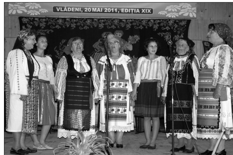
Grupul Folcloric Tradițional „Izvoarașul” (Ghimpați, jud. Ialomița) - Premiul II la Secțiunea Grupuri folclorice tradiționale