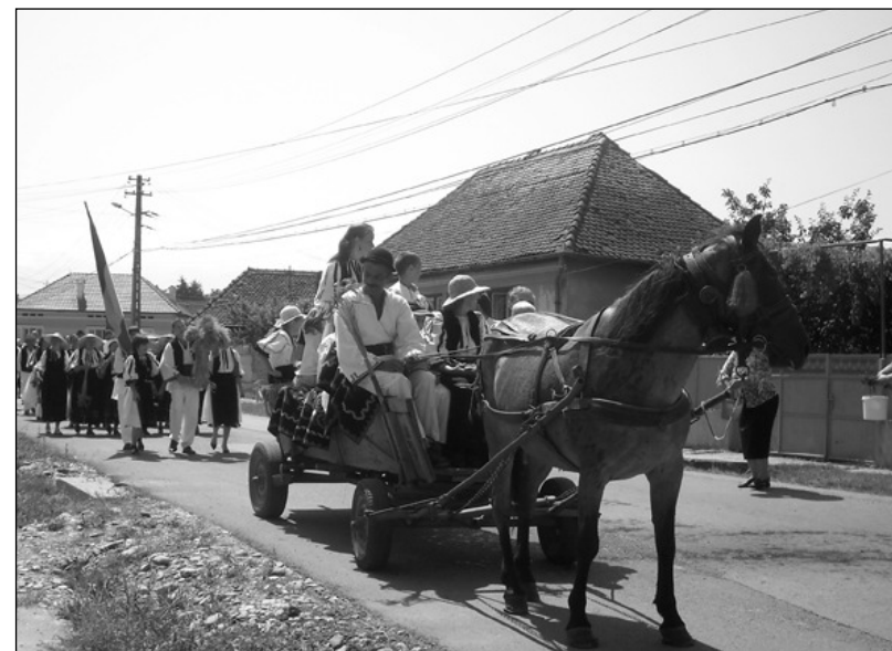
Alaiul secerătorilor pe străzile Cârței

La întoarcerea în sat, buzduganul, purtat de două copile sau de un băiat și o fată, deschide drumul. Versurile din Pe Dealul Mohului anunță localnicilor intrarea alaiului în sat și, cum tradiția trebuie păstrată, femeii „înnarmate” cu câni și găleți, ies la poartă pentru a uda secerătorii cu apă curată sau apă cu busuioc, într-un ritual de prosperitate, belșug și sănătate. La casa gazdei, alaiul se oprește pentru a-și primi răsplata pentru ajutorul dat, așa că secerătorii sunt așteptați cu masa întinsă, după cum spun versurile „Stăpână,