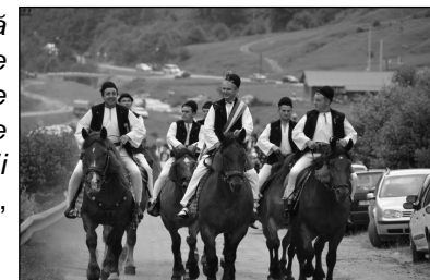
Junii din Gura Râului, în întâmpinarea oaspeților sosiți la festival