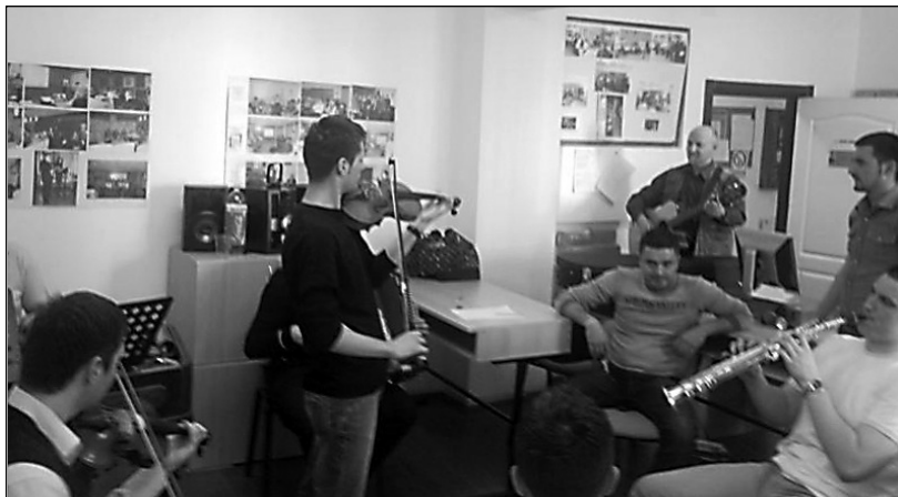
Studentii de la Facultatea de Muzică din Târgu Mureș - workshop la Muzeul Etnografic din Reghin

fost: înregistrări în studio, postprocesare, editarea diverselor fragmente melodice, realizarea prezentării pieselor muzicale, activități specifice filmării.