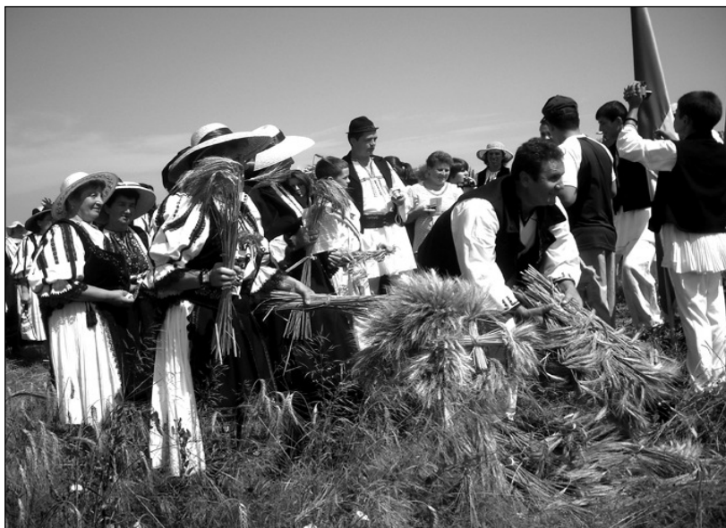
Pregătirea snopilor pentru confecționarea buzduganului de seceriș

Sfânt Ilie, la claca de la seceriș. Din inima satului și până la pământul gazdei, lumea merge cântând, iar aici, cu gesturi familiare de zeci de ani, bătrânii comunei le arată tinerilor cum să taie spice și să lege snopi. La final, când munca-i gata, se ivește și buzduganul, făcut de femei în vârstă. Cele mai pricepute femei leagă snopii în formă de cruce, iar apoi așază crucile în buzdugan: „Crucea din vârful buzduganului reprezintă comunitatea, apoi mai jos sunt reprezentați oamenii care se duc la ajutor, la clacă, și toți sunt legați într-un buchet pe care-l ducem gazdei”, spun bătrânele satului.