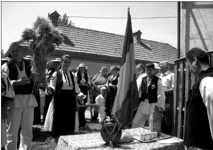
La casa gazdei: „Stăpână, stăpână/Gată cina bine/ Că cunună-ți vine”

cruci în buzdugan. Motivația localnicilor pentru acest fapt este următoarea: „Durează prea mult să-l facem cu totu' și-i prea cald pe vremea asta ca să putem noi, bătrânii, sta atâta în holdă”.