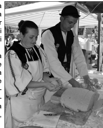
Pregătirea bulzului ciobănesc - „Cina ca la stână”, moment al Festivalului „Bujorul de Munte”, Gura Râului, jud. Sibiu, 2011

Atmosfera a fost întreținută de ansambluri din județul Sibiu și de soliști binecunoscuți pe scena muzicii populare naționale. Astfel,