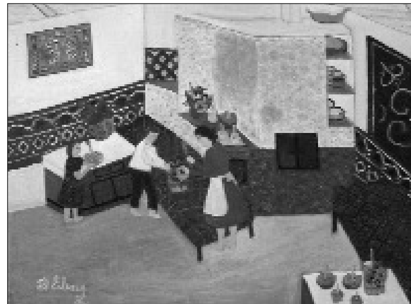
Interior din casa părintească - Elena Zbanț (Iași)

De la o vreme: „Dacă voi vreți să le stric, ia că le stric!”. Așa am început prima dată.