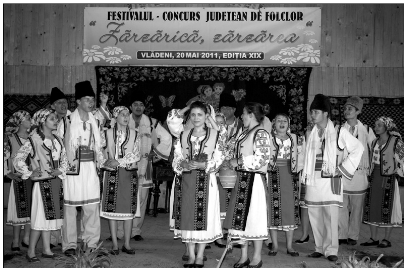
Ansamblul Folcloric „Colinda“ (Jilavele, jud. Ialomița) - Premiul I la Secțiunea Ansambluri folclorice

Trofeul Festivalului Zărzărică, zărzărea: Ansamblul Folcloric „Dorulețul“ (Făcăeni).