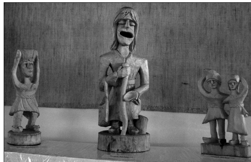
Lucrări ale artistului realizate în Tabăra de Artă Naivă de la Zimnicea, 2010

Eu am și prevăzut că, dacă nu se va putea face nimica, am făcut ceva lucrări și le-am adus... Dar am făcut bătrânul ăsta cu cofița, am făcut dansatorii aceștia, am făcut o bătrână în cameră și, cum s-ar spune, am făcut trei lucrări în 3-4 zile, cât s-a putut, că a mai și plouat.