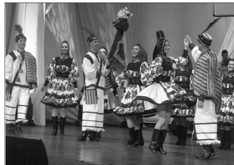
Imagini de la Festivalul Național de Folclor „Ioan Macrea”, ediția a XIII-a, Sibiu, 17-19 noiembrie 2011