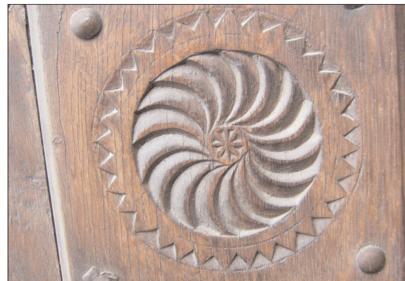
Detaliu din poarta sculptată de Nicolae Purcărea

În cântare veți găsi și „lemnul” - sub orice formă - o poartă, un stâlp de casă, un prag, o laviță, un cadru de fereastră... căutați până veți găsi și atunci așezați-vă cu toată puterea și cu „dreptul de șchean” pe aceste bunuri la care aveți dreptul de „proprietari spirituali”; ca ale Domniei voastre, să le folosiți și valorificați. Astfel se nasc creațiile autentice care cresc din sufletul omului, din locul său de baștină și Dumneavoastră aveți un loc care vă conferă drepturi pe care alții nu le pot avea, căci nu au un loc ca Șcheiul.