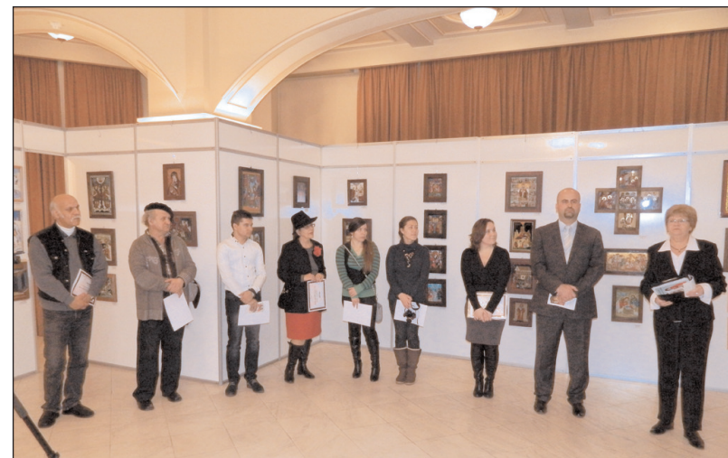
Imagine de la vernisajul Expoziției Crăciunul și Anul Nou în creația populară contemporană , organizată de CNCPCT - 15 decembrie 2011, Centrul Național de Artă „Tinerimea Română”

1992, se înscrie în programele culturale continuate an de an de CNCPCT, în concordanță cu atribuțiile instituției.