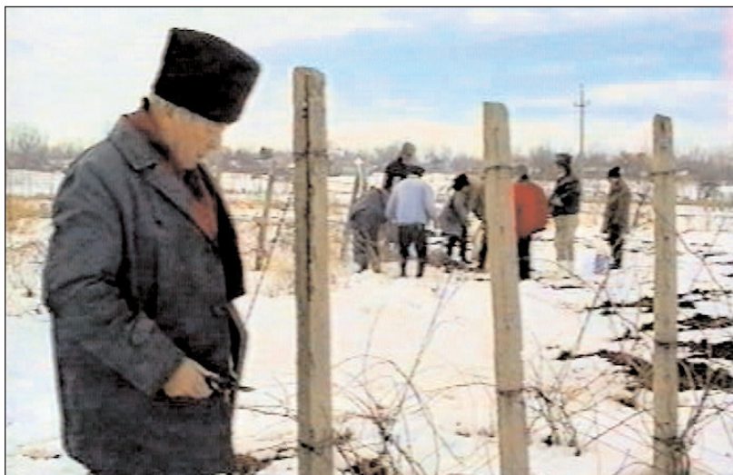
Zarizanu - Ciocănești-Sârbi, jud. Călărași