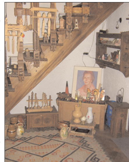
O casă de poveste

Mi-a spus că am mână, că lucrez frumos, dar că n-am școală - se gândea la școala tradițiilor autentice. La sfatul ei, m-am oprit din lucrat și m-am apucat de teorie. Am studiat etnografia și cioplitura tradițională și, încetul cu încetul, după alți câțiva ani, am început să apar din nou la expoziții, de această dată în cunoștință de tainele artei.”