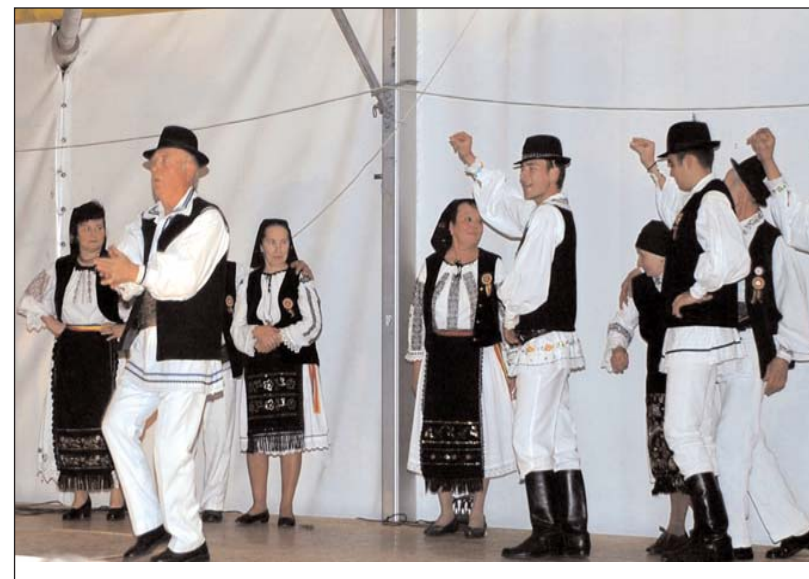
Formația de jocuri tradiționale „Zorile” din Mociu