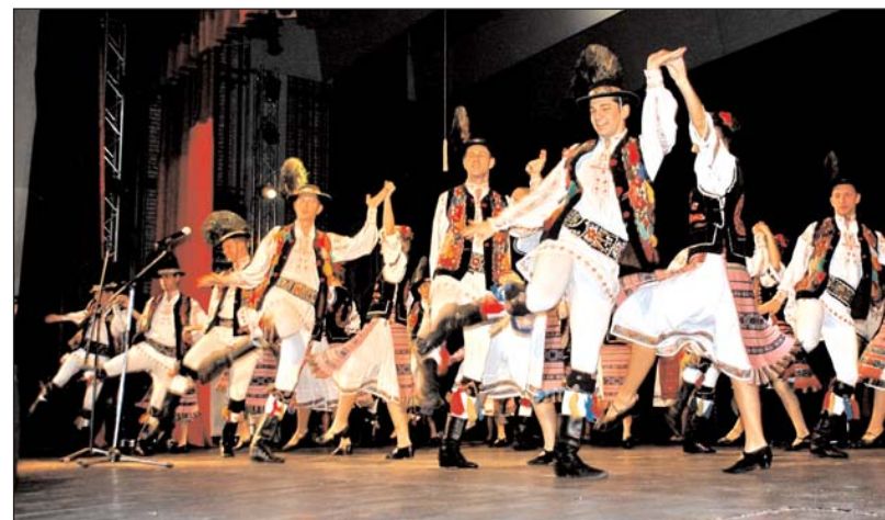
Ansamblul folcloric „Mărțișorul”