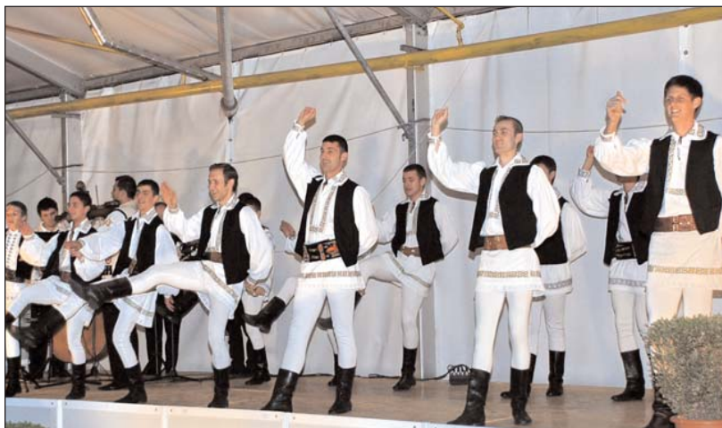
Ansamblul folcloric studentesc „Românașul” al Universității Tehnice

Faptul că în structura formației se regăsesc atât români, cât și maghiari și rromi, demonstrează că și în satele comunei Mociu multiculturalitatea este corect percepută.