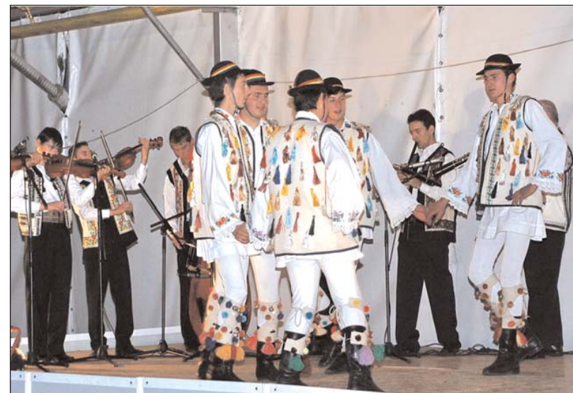
Ansamblul "Bârgăul" din Prundu Bârgăului