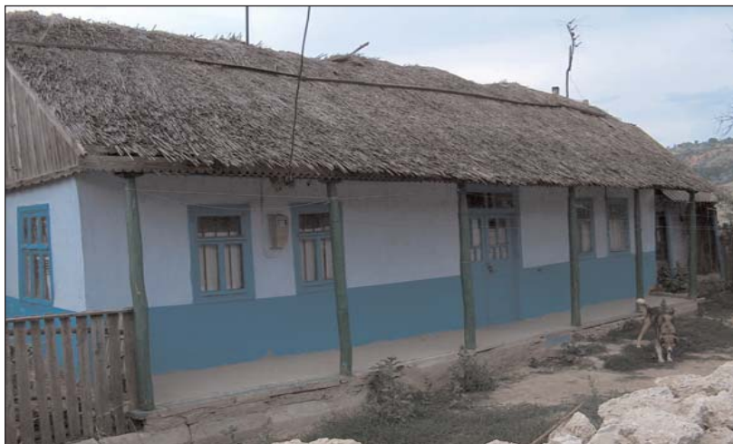
Casă din Colibași, Raionul Cahul, Republica Moldova