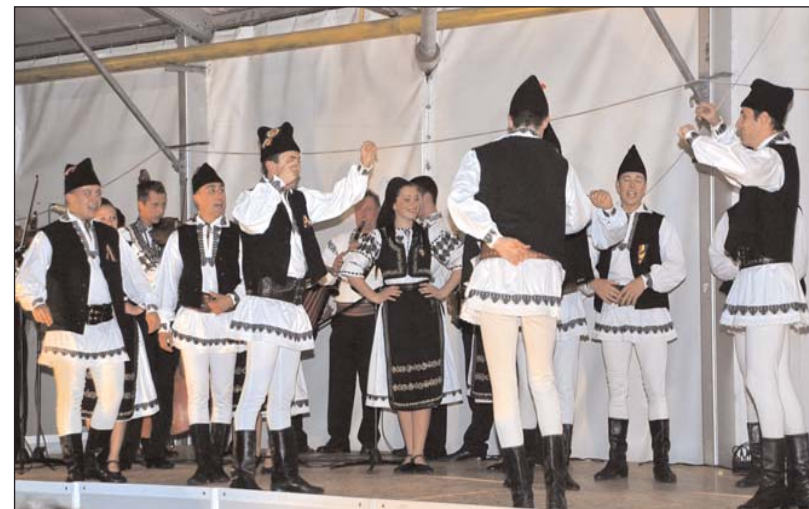
Ansamblul folcloric „Dor transilvan” al R.A.T.U.C