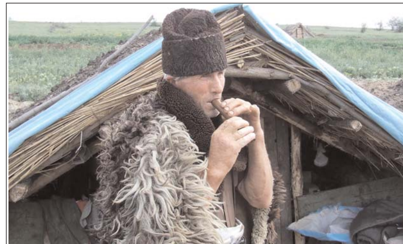
Cioban din Măstăcani (județul Galați) cântând la fluiier

Localitatea Suceveni se remarcă prin varietatea și ineditul formelor pe care le îmbracă obiceiurile calendaristice de peste an și riturile de trecere, păstrate încă vii în memoria colectivă; de asemenea, se remarcă bogăția folclorului coregrafic (jocurile populare precum sfredelușul, hora studenților, joiana, coasa, hora în două părți) și, nu în ultimul rând,