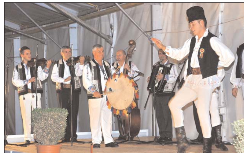
Ansamblul "Someșul Napoca" al Școlii Populare de Arte "Tudor Jarda"