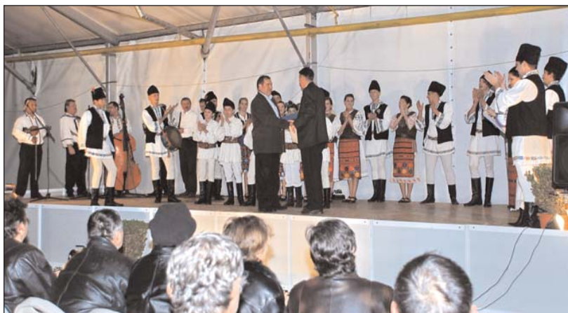
Ansamblul folcloric „Crăișorul” al Sindicatului „Civitas”

Am urmărit cu drag și jocuri din Băgara, interpretate cu pasiune de Ansamblul de dansuri populare „ Bogâncs ”, al Liceului Teoretic „Brassai Sámuel”, care, printre ansamblurile maghiare de dansuri populare, are cea mai îndelungată activitate (din 1985).