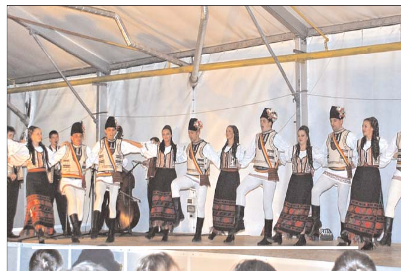
Ansamblului folcloric „Cerbul Carpatin” al S.C. „ARO PALACE,,Brașov