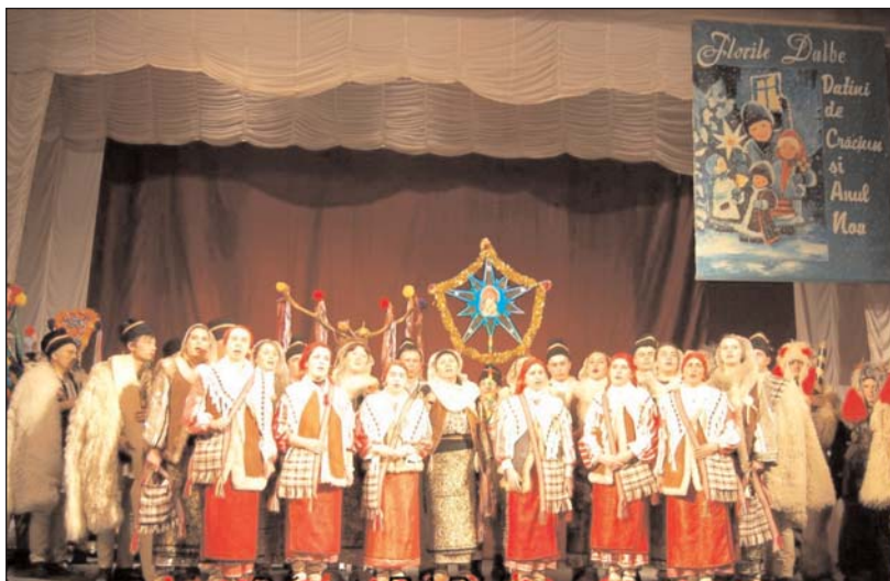
Grup de colindători pe scena festivalului (Pitești, decembrie 2008)