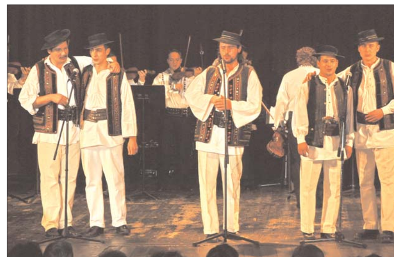
Grupul folcloric Obârșia din Blaj