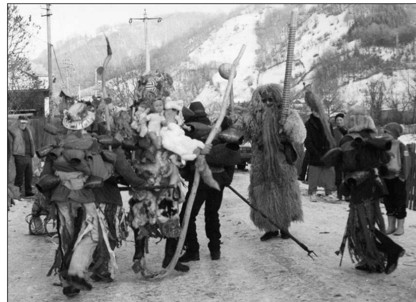
Moși și draci pe ulițele Vișeuului de Sus, jud. Maramureș, decembrie 1995

Denumirea de capră este specifică zonei Moldovei. Caprele din Moldova, cu bot de lemn, au specifice coarnele mai mici și mai puțin împodobite decât în restul țării. Ele sunt acoperite cu covoare sau macaturi și uneori poartă pe spinare o fâșie cu clopoței. Caprele dansează împreună cu ursul dansuri grotești. Celelalte personaje mascate care le însoțesc prezintă adesea scene comice, cu aluzie la comunitate sau la evenimente actuale. Chiar și pe vremea comunismului se făcea aluzie la regim și la condițiile de trai de atunci. În mod tradițional, capra joacă în mijloc, fiind înconjurată de celelalte măști, după cântarea la fluier sau la strigăturile flăcăilor care au sarcina de a o juca.