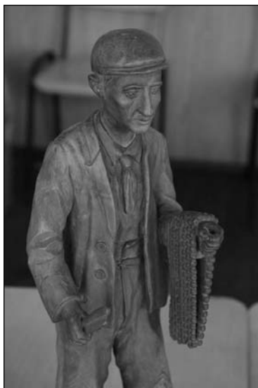
Lucrare aparținând artistului omagiat, aflată în colecția Muzeului Județean Argeș