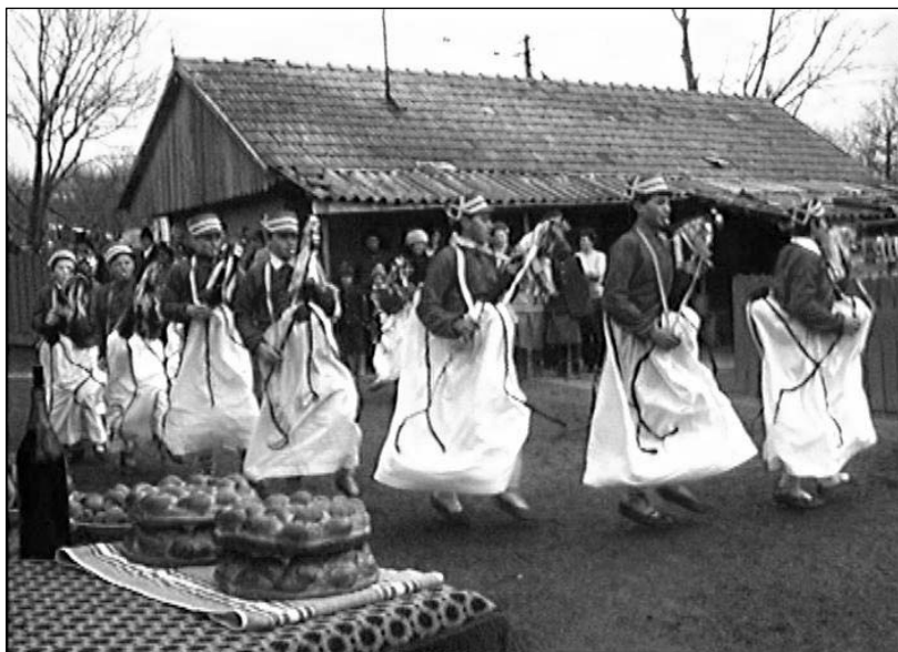
Căiuții din Vârfu Câmpului, jud. Botoșani, în iarna anului 1995

turcii era foarte vast. Conținea și câte 15-20 de cântece, necesitând repetiții îndelungate. La aceste repetiții participau și copiii, pentru a putea prelua obiceiul, în viitor (N. Cojocaru, Cântece, obiceiuri și tradiții populare românești , Editura Minerva, București, 1984, p. 39). Astăzi aceste jocuri sunt de mai mică amploare, păstrând mai mult caracterul spectacular decât pe cel ritual-ceremonial.