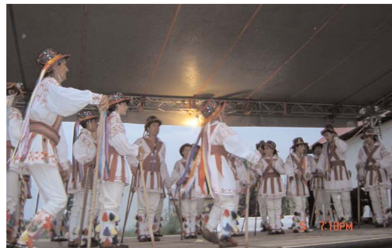
Călușarii din Stolnici - „Întrecerea călușarilor din Argeș”, ediția a XX-a, 5 iunie 2008

Aici au fost intervievați membri ai trupelor de călușari și au fost culese informații despre modul în care se desfășoară obiceiul Călușului în fiecare dintre localitățile participante.