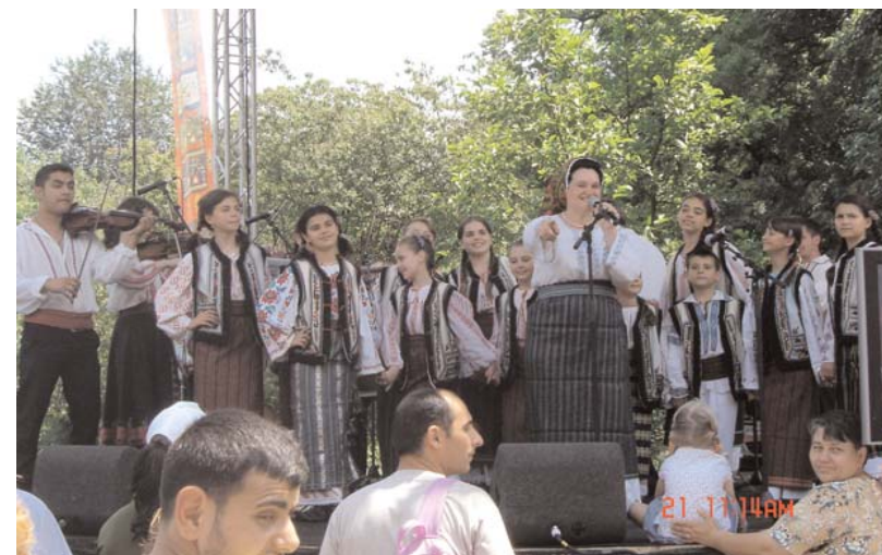
Grupul folcloric „Cununița” (Satu Mare) — Festivalul Național de Folclor „Muzici și tradiții în Cișmigiu”, 20-22 iunie 2008

Prima zi a festivalului a debutat cu parada ansamblurilor folclorice care s-a desfășurat pe ruta Piața Romană - Piața Universității - Bulevardul Elisabeta - Parcul Cișmigiu și la care au participat: Ansamblul folcloric „Prahova” al Casei de Cultură „I. L. Caragiale” a Municipiului Ploiești, Ansamblul folcloric „Prahovița” din Măgureni (Prahova), Fanfara „Augustin Bena” din Alba Iulia, Ansamblul folcloric profesionist „Burnasul” din Alexandria (Teleorman), Fanfara „Chetriș” din Iași, Ansamblul „Carpați” al Casei de Cultură „Tudor Mușatescu” din Câmpulung (Argeș), Ansamblul „Ciuleandra” din Târgoviște și Orchestra „Chindia” a Consiliului Județean Dâmbovița, Ansamblul „Bărăganul” din Călărași, Ansamblul „Doina Gorjului” din Târgu Jiu (Gorj), Ansamblul „Plaiurile Oltului” din Slatina (Olt), Fanfara „Trandafirul” din Suceava și Ansamblul „Kramaric” din Croația.