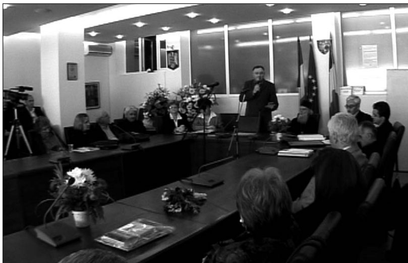
Imagine de la Întâlnirea aniversară a CJCPCT Vâlcea - Râmnicu Vâlcea, 9-10 mai 2008