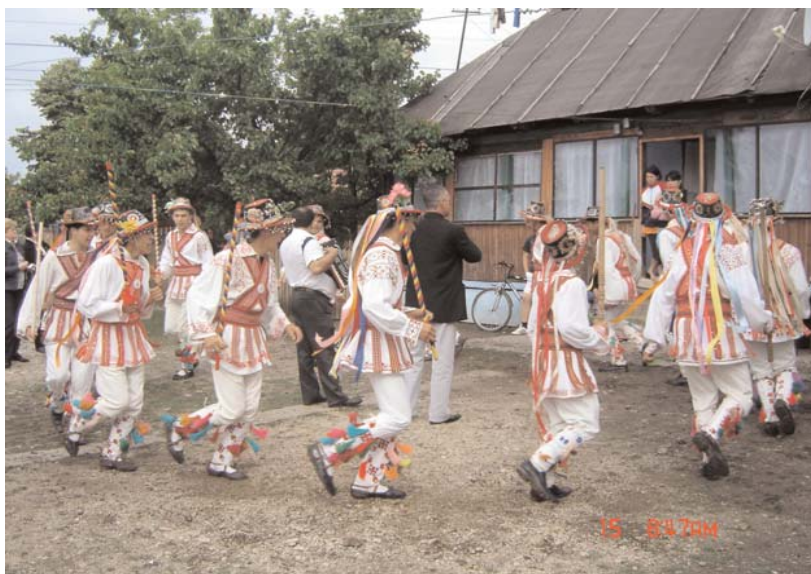
„Călușul“ din Costești, județul Argeș