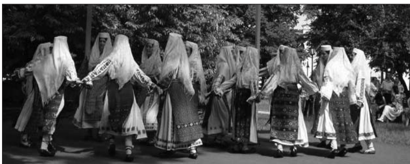
Formații și ansambluri folclorice vâlcene pe scena Muzeului Național al Satului „Dimitrie Gusti“, 2011

Gheorghe Tomescu și Gheorghe Deaconu, Editura Fântâna lui Manole, Râmnicu Vâlcea, 2011.