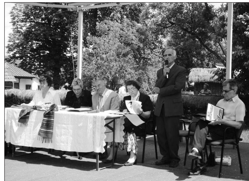
Lansări de carte la Zilele Culturii Populare Vâlcene - Muzeul Național al Satului „Dimitrie Gusti”, mai 2011