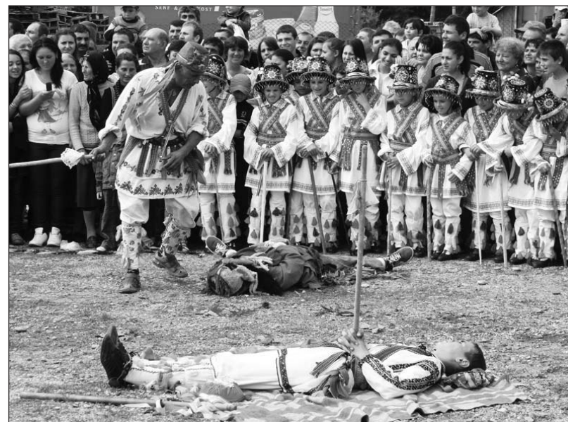
Vindecarea unui călușar doborât (parodie) - Călușarii din Vitomirești, jud. Olt, la Câmpu Mare, 2011

Am constatat că actanții Călușului sunt conștienți de diferența dintre performarea obiceiului în sat și jocul pe scenă, deoarece