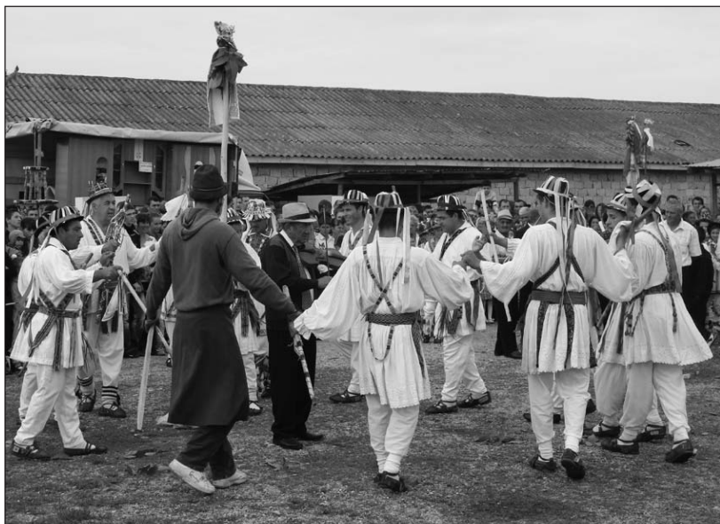
Hora călușarilor - moment final al jocului cetei din Oporelu - Câmpu Mare, com. Dobroteasa, jud. Olt, 2011