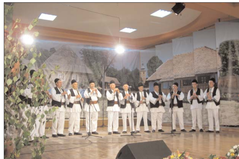
Imagine de la Concursul „Fluierul de Aur”, ediția a II-a, desfășurat în cadrul Festivalului „Sadule, grădina mândră!”, județul Sibiu, 11 iunie 2011

Festivalul a debutat sâmbătă, 11 iunie, cu a doua ediție a Concursului „Fluierul de aur”, desfășurată pe două secțiuni: Formații de fluierași și Soliști instrumentiști . „Prin acest concurs se promovează