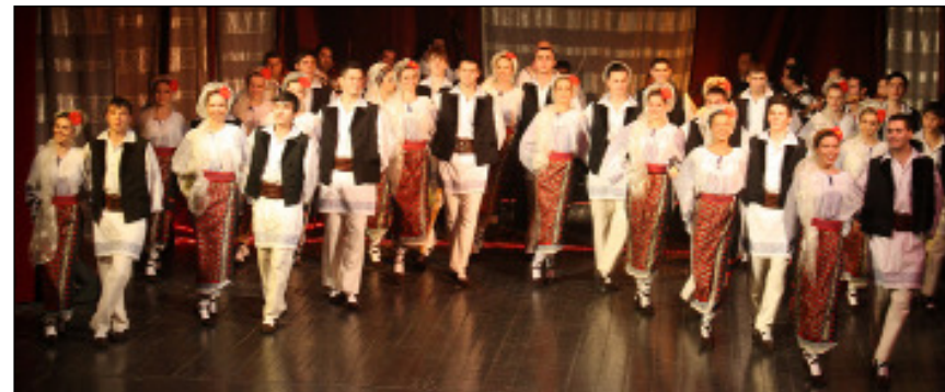
Ansamblul Folcloric „Dorul” - Marele Premiu la Concursul Județean „Gheorghe Popescu-Județ”, Pitești, 26 mai 2012

„Schimb de dansuri” - România - Franța - Suedia - proiect european.