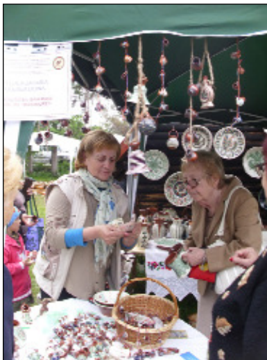
La târg, creatori și consumatori