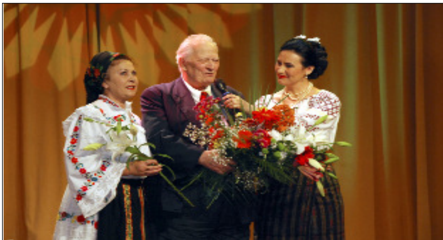
Maestrul Constantin Arvinte, la aniversarea a 86 de ani de viață - Centrul Național de Artă „Tinerimea Română“, 21 mai 2012

creator. S-a consacrat și a fost apreciat ca un compozitor de muzică simfonică (rapsodii, concerte instrumentale, lieduri sau piese camerale), muzică corală și chiar pentru fanfară, deopotrivă un neîntrecut orchestrator pentru acompaniamentele muzicale ale unei întregi pleiade de soliști vocali și instrumentali.