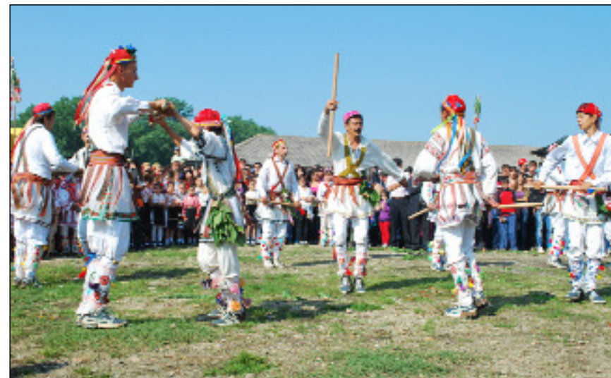
Călușul performat de ceata de călușari din Vitomirești, jud. Olt - „Rusalii la Dobroteasa”, Câmpu Mare, jud. Olt, 3 iunie 2012