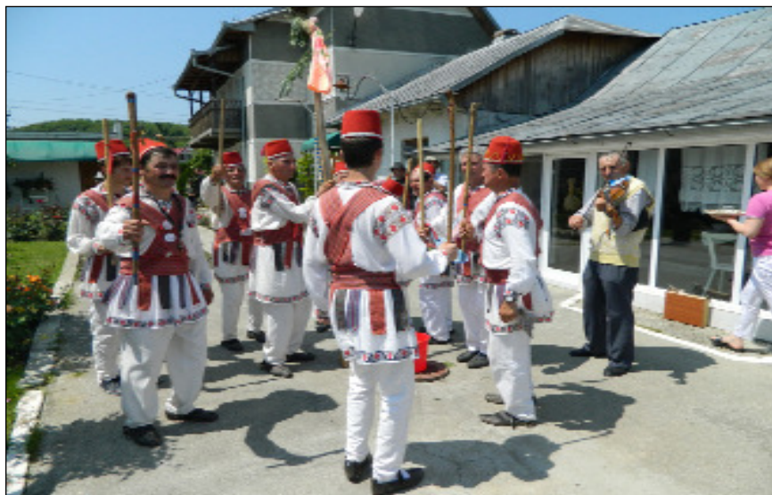
Călușul în sat - ceata de călușari din Cârlogani, jud. Olt, 2012