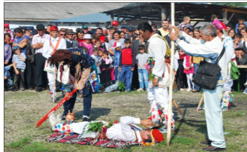
Vindecarea călușarului - parodie - ceata de călușari din Vitomirești, 2012