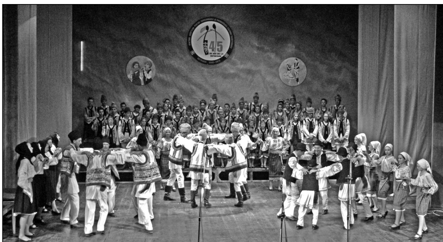
Formația de dansuri „Trei generații” din Flămânzi, jud. Botoșani, la aniversarea a 45 de ani de la înființarea CJCPCT Botoșani – 16 mai 2013

de orchestre, formații corale și de jocuri populare de toate vârstele - de la copiii și elevii, la tinerii și maturii.