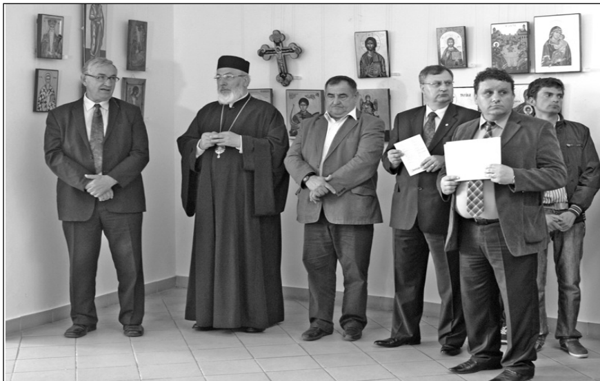
Imagine de la vernisajul Expoziției-concurs Naționale de Icoane „Rugămu-ne Ție!“, Curtea de Argeș, 7 iunie 2013