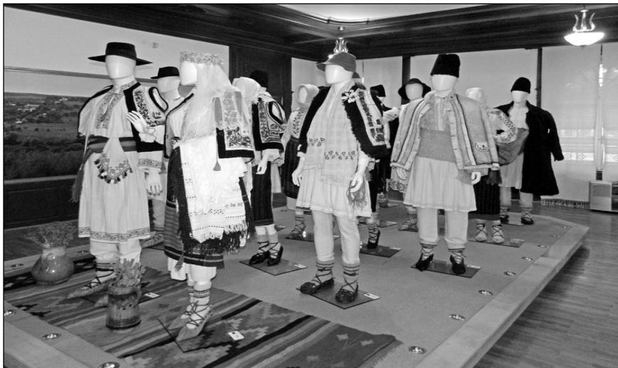
Alai tradițional de nuntă din județul Botoșani, în Muzeul Județean Botoșani – Secția Etnografie