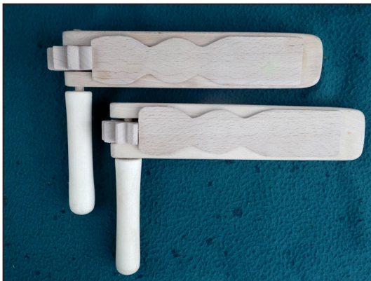
Cârâitoare realizată de creatorul de jucării Zoltan Bed.