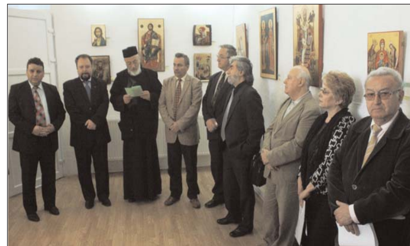
Vernisajul Expoziției Naționale de Icoane „Rugămu-ne Ție!” - ediția a XIII-a - Pitești, Galeria de Artă „Rudolf Schweitzer-Cumpăna”, 15 aprilie 2011

În ediția de anul acesta, la Centrul de Cultură și Arte „George Topârceanu” din Municipiul Curtea de Argeș au participat 12