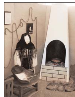
Cuptorul de pâine

Pentru crearea unui punct de contrapondere la teasc (element spectaculos, greu), s-au folosit ca elemente de muzeotehnică cuptorul de pâine + focul din interiorul acestuia și pseudoconstrucția cu fronton, amenajată ca un interior țărănesc.