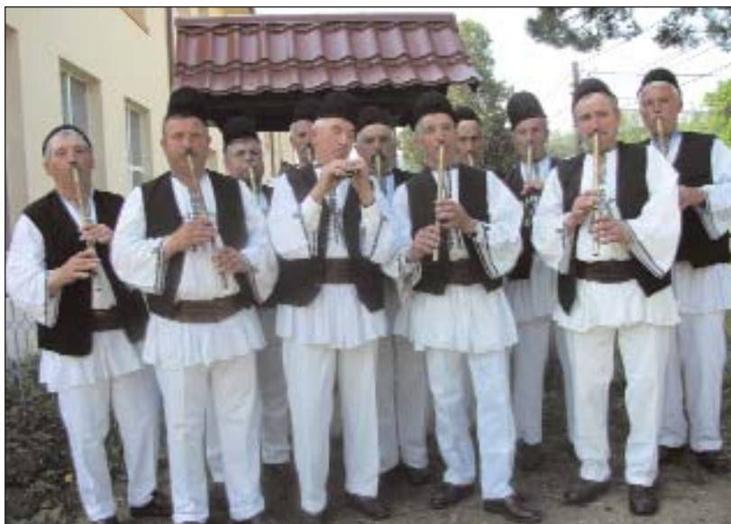
Grup de fluierași la Rapsodia păstorească - Corbi, județul Argeș, 22 mai 2011

cu farmec artistic popular interiorul, îmbiind la creație și continuitate, la respectul rădăcinilor).