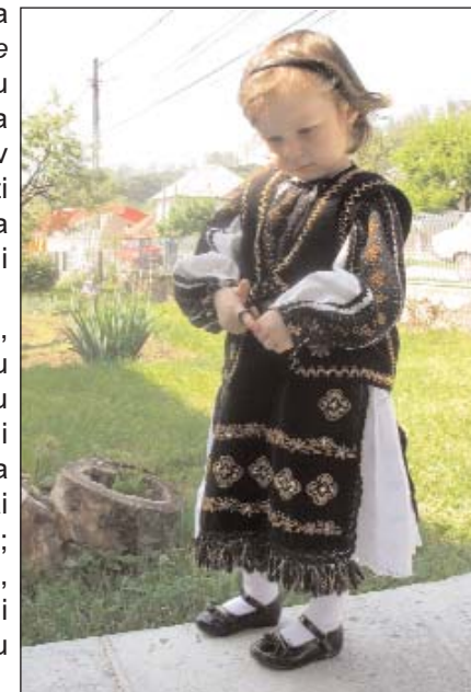
Micuță participantă la aniversarea de 555 de ani a comunei argeșene Corbi

S-au perindat prin fața publicului - unul avizat, iubitor de frumos - copii, tineri sau mai în etate, fete și flăcăi, purtători ai unor însemne ale tradiției - marame, ilice, vâlnice, fote, șorțuri, veste negre, cămăși în cruce, opinci, pantofi, sandale, cioareci, pălării, chimire, ii, baticuri.