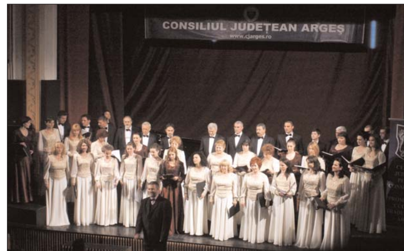
Corul „Ars Nova” în concert, la Teatrul „Al. Davila”, Pitești, 29 aprilie 2011

Actualul CJCPCT a considerat că trebuie să marcheze evenimentul de la „startul” căruia au trecut, iată, 55 de ani. A fost întocmit un bogat program de manifestări sub titlul Zilele Centrului Creației