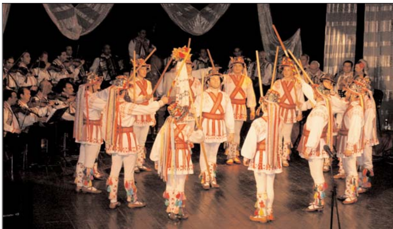
Ansamblul Folcloric „Dorul” - Pitești, Teatrul „Al. Davila”, 2 mai 2011