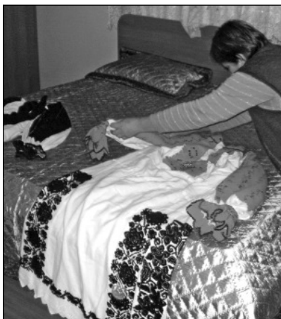
Costum pădurenesc de mireasă - Ciulpăz