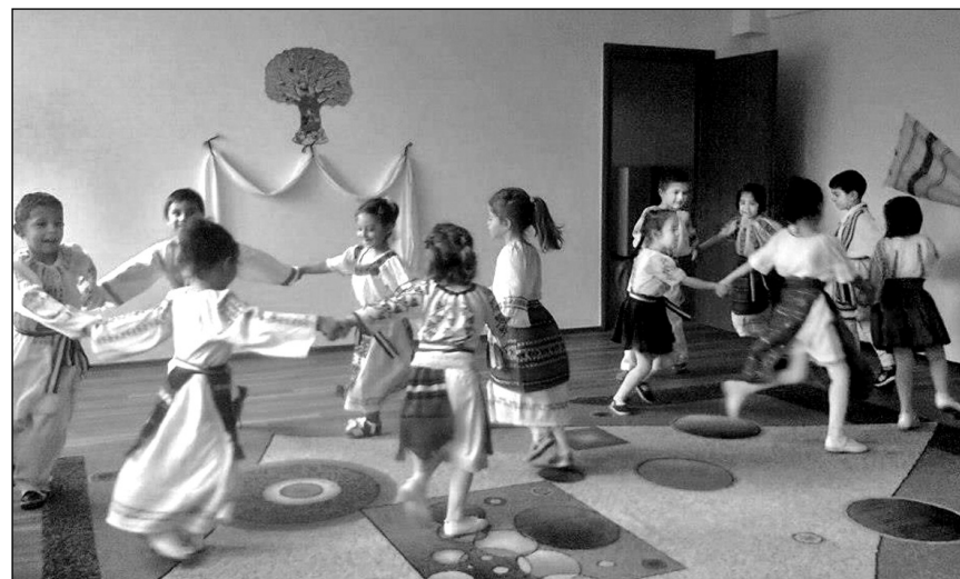
Micul Românaș și Sărbătoarea recoltei, noiembrie 2012

De ce? Pentru că stadiul de dezvoltare psihică preoperațională și cel al operațiilor concrete pot fi cu ușurință antrenate prin acțiuni cu un grad ridicat de concretețe, acțiuni ce au la bază informații nealterate, furnizate de specialiști în domeniul etnologiei. Iar promovarea interinstituțională și