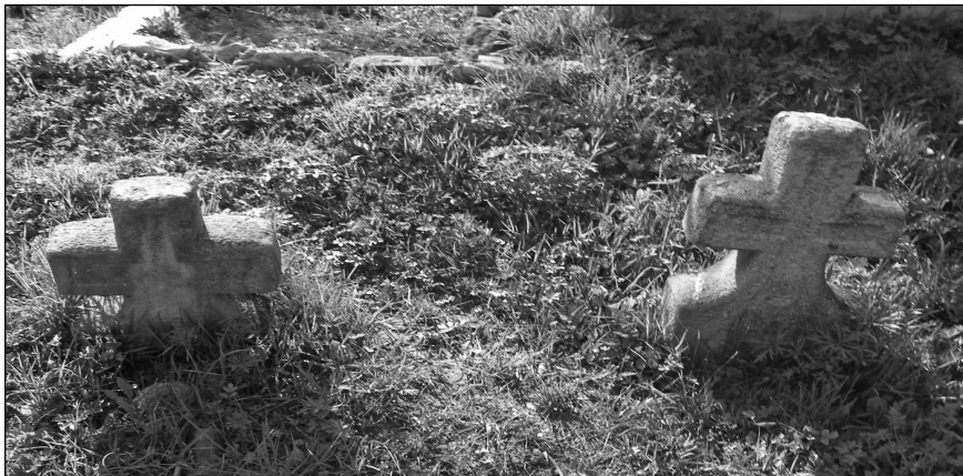
Morminte din Sângeorzu Nou, județul Bistrița-Năsăud

Redăm, din ritualul de înmormântare, câteva piese înregistrate în 2012, cu dorința de a sublinia caracteristicile concepției românești despre moarte.