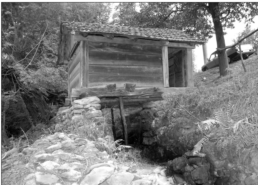
Moară de apă de la Cornereva, jud. Caraș-Severin

ciutură. Am regăsit pe râurile de munte ale Banatului circa 100 de mori cu ciutură. Amploarea reală a restrângerii patrimoniului etnologic al provinciei este dată de faptul că alte două clase ale morii de apă, și anume morile plutitoare și moara cu roată verticală și axul orizontal, aflate de regulă pe marile râuri ale provinciei, au dispărut cu totul din peisajul cultural al Banatului. Viața morii de apă este strâns legată de viața satului românesc din Banat.