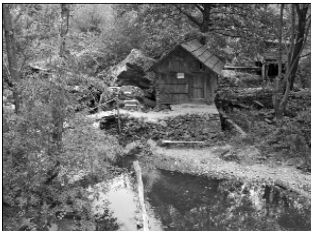
„Îndărătnica între râuri“ (exterior)