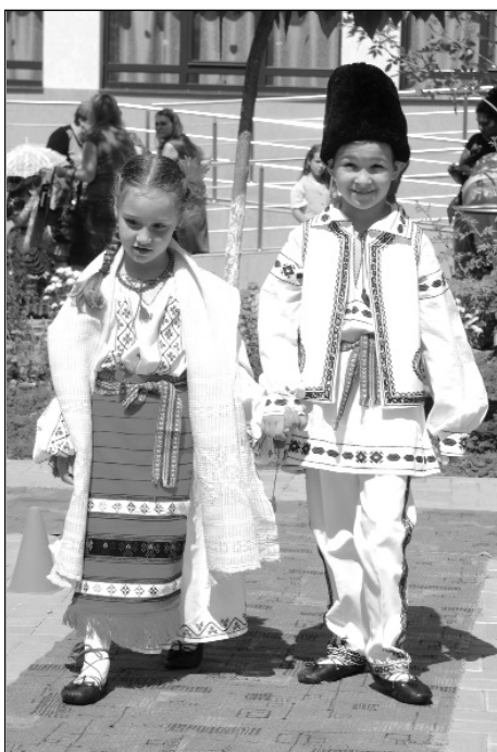
Parada portului popular – iunie, 2013

Atelierele de creație Mâini dibace au venit în sprijinul preșcolarilor și al cadrelor didactice, care și-au dorit să se familiarizeze cu meșteșugurile tradiționale și cu îndeletnicirile populare ale românilor. Scopul a fost familiarizarea preșcolarilor cu ceea ce înseamnă pâinea cotidiană și pâinea rituală. În urma acestei activități practice, copiii au înțeles că pâinea se face prin măcinarea grâului. Apoi, că din făina de grâu se poate obține atât pâinea noastră cea de toate zilele, cât și colivă pentru pomeni, colacii împărțiți de gospodine pentru sufletele celor din lumea de dincolo și cozonacii savurați la marile sărbători de peste an.