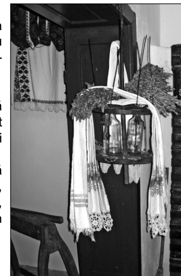
Pomul de nuntă - Casa memorială „Drăgan Muntean”, Poienița Voinii

Notă: Planul de cercetare este realizat din perspectiva activității de cercetare a obiceiurilor de nuntă, cercetarea obiceiurilor de înmormântare și de la naștere înregistrând planificări diferite.