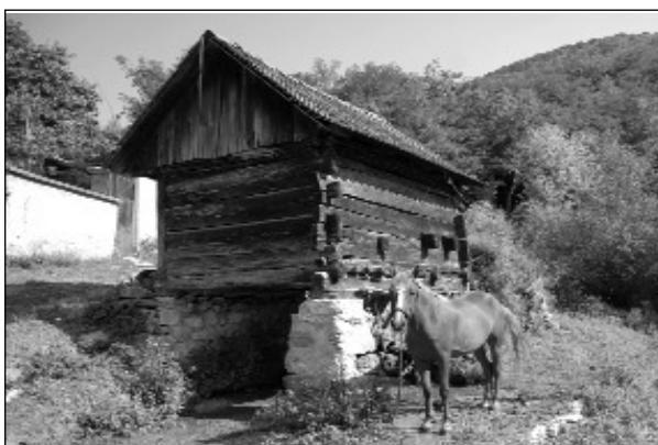
Moară din Topleț