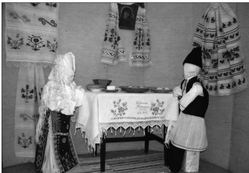
Expoziția temporară „Oul, Crucea și Sfânta Pâine”: Masa de Paști