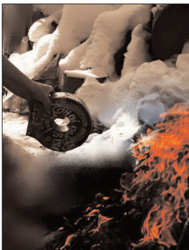
Apă și foc de Sfântul Trif

De la cosorul ce taie prima coardă de viță și până la teascul ce zdrobește strugurii, drumul vinului este marcat de credințe arhaice, practici magice, dar și de aspectele economice intrinseci vieții tradiționale.