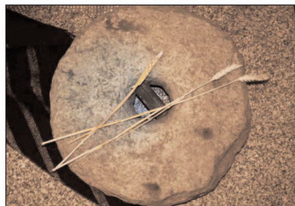
Etapă din drumul pâinii

Drumul pâinii este poate cel mai complex scenariu ritual din cadrul calendarului popular. Acesta începe cu un sacrificiu violent, cel al grâului de anul trecut (de Mucenici), continuă cu practici de asigurare a belșugului și îndepărtare a pericolelor din ogoare (dintre care vom aminti doar legarea magică a ciocului păsărilor și ritualurile de tipul Caloianului sau Paparudei) și se termină aparent printr-o moarte simbolică, cea a spicelor (în timpul secerișului). Acesta este însă numai ciclul vegetativ. Urmează etapele treieratului, măcinatului și în cele din urmă realizarea aluatului și coacerea pâinii, în multiplele sale forme.