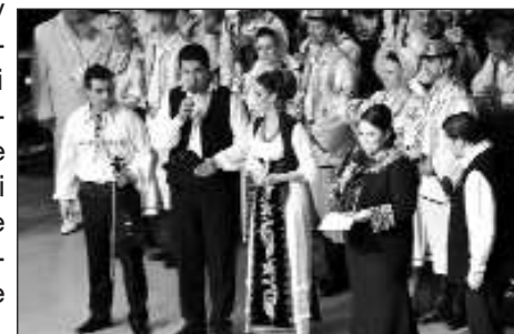
Ansamblul Folcloric Profesionalist „Cindrelul-Junii Sibiului” - Gala Muzicii Populare Românești, Sala Palatului, 14 aprilie 2011