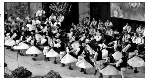
Dansatorii Ansamblului Folcloric Profesionalist „Cindrelul-Junii Sibiului”