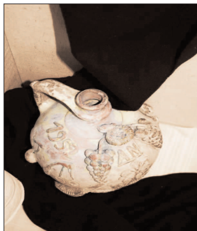
Urcior de nuntă