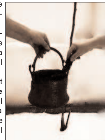
Sfințirea viței de vie

Vinul de anul trecut este stropit peste focul în care ard coardele de viță tăiate anul acesta. Dublul sacrificiu al viei (vinul vechi și vița nouă) trebuie corelat cu dubla naștere a zeului Dionysos (din pântecul Semelei și apoi din coapsa lui Zeus, ambele în prezența focului).