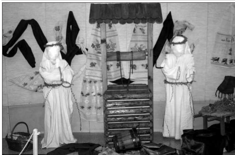
Paparude expuse în cadrul aceleiași expoziții tulcene

Expoziția prezintă tradiții laice și religioase legate de marea sărbătoare creștină: înroșitul ouălor, coacerea prescurilor, simbolistica crucii, sfântul bucatelor de Paști; Paparuda, Caloianul - obiceiuri de invocare a ploii; Ropotinul țestelor - sărbătoare a femeilor în care se confecționau capacele pentru gura sobei și cuptorul de pâine, copacul dorințelor .