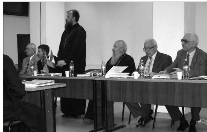
Imagine de la Colocviile de Etnografie și Folclor „Gheorghe Pavelescu”, Alba Iulia, 25-27 martie 2011

Poate mai mult decât în ceilalți ani, sesiunea științifică de la Alba Iulia s-a desfășurat impecabil din punct de vedere organizatoric, anul acesta fiind implicați mai mulți colegi de-ai noștri în organizarea sesiunii. De un interes deosebit s-a bucurat și excursia documentară.