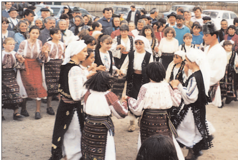
Imagini de la „Hora costumelor“, manifestare devenită tradițională în Pietrari, jud. Vâlcea