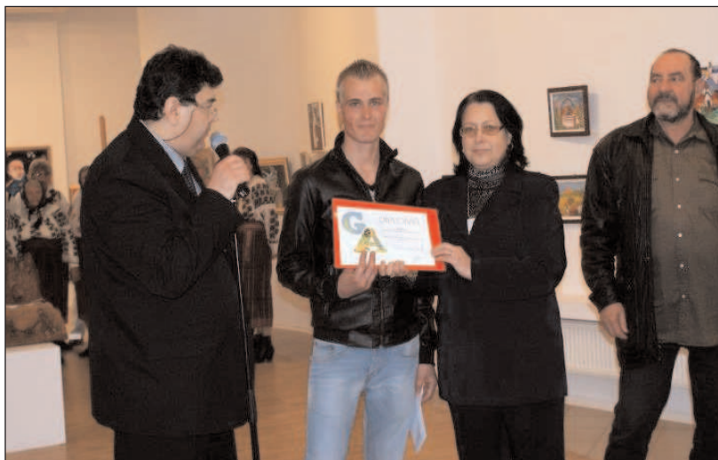
Imagine de la festivitatea de premiere - Salonul de Primăvară al Artei Naive, Bacău, 2012