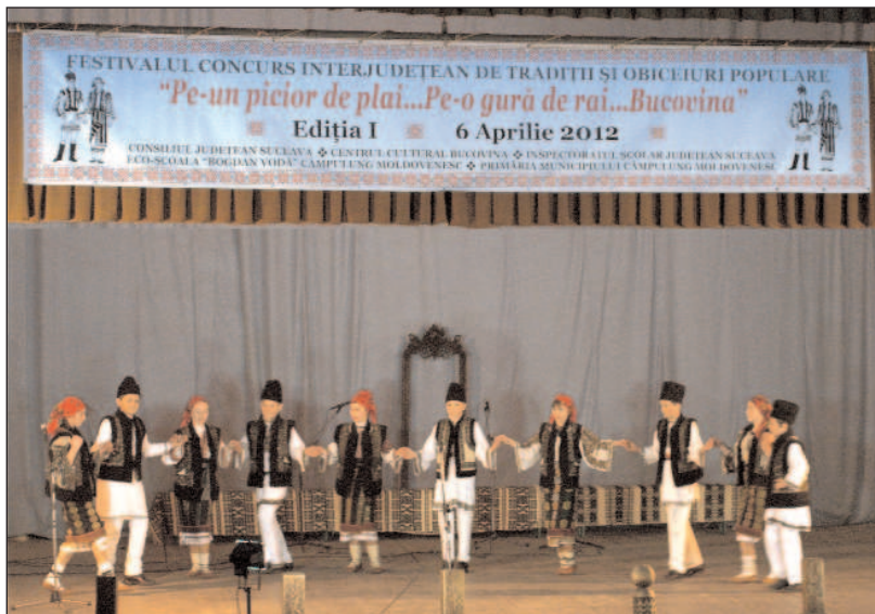
Pe scena Festivalului „Pe-un picior de plai... Pe-o gură de rai... Bucovina”, ediția I, Câmpulung Moldovenesc, jud. Suceava, 6 aprilie 2012

bucovenienii o cinstesc în mod deosebit, mai ales prin încondeierea ouălor, valoare a patrimoniului lor). Nu în ultimul rând, am remarcat și admirat prezența câtorva formații din județele Maramureș, Neamț, Galați, Bistrița-Năsăud, care au prezentat cântece, dansuri și obiceiuri specifice zonei lor.