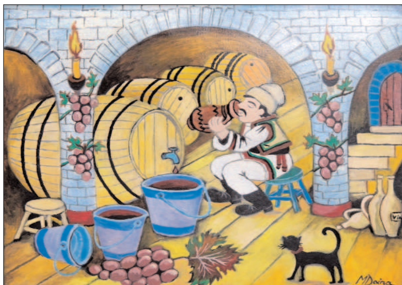
În cramă - Doina Moldoveanu (Galați)

O mătușă de-a mea desena și îmi plăcea atât de mult, încât m-a determinat să pictez în continuare, să desenez.