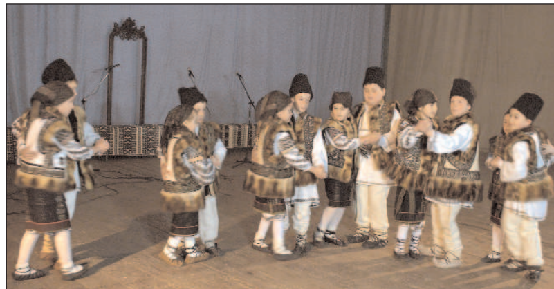
Grup de dansatori copii participanți la festival

Nu exagerăm cu nimic dacă spunem că a avut loc un regal al culturii populare, mai ales al celei bucovinene, majoritatea formațiilor reprezentând această zonă. Un spectacol lucrat serios, profesionist, curajos; căci este și un curaj să dai libertate pe scenă unor copii de până la clasa a VIII-a să interpreteze piese, uneori de mare complexitate, muzicale sau coregrafice. Iar această virtuozitate a elevilor nu a trecut neobservată de specialiștii prezenți.