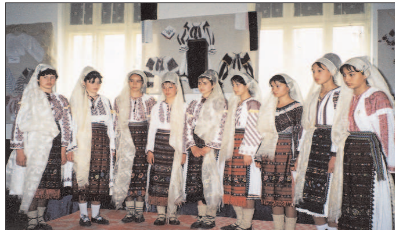
Purtătoare ale costumului popular tradițional din Pietrari

Hora costumelor - Sărbătoarea portului popular - ediția a XXX-a. Una dintre cele mai durabile inițiative ale instituției din primii săi ani de activitate.