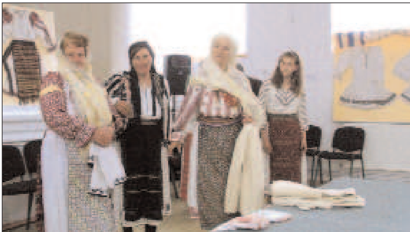
Reprezentativa comunei Bărbătești la Festivalul Hora costumului, Pietrari, 2012