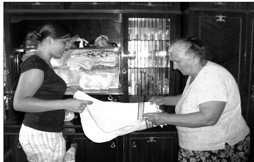
Lecția despre ștergarele din Aluniș