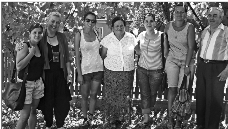
Echipa de cercetători și informatori în satul Aluniș, august 2012