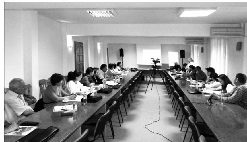
Participanți la colocviile CNCPCT, ediția a XIX-a, Băile Herculane, 2012