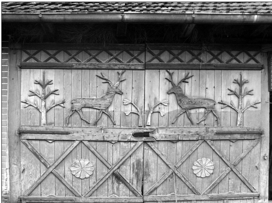
Porți de șură la Aluniș

izolate și subzona Almaș-Agrij, mult mai deschisă influențelor din afară datorită drumului ce leagă Clujul și Dejul.