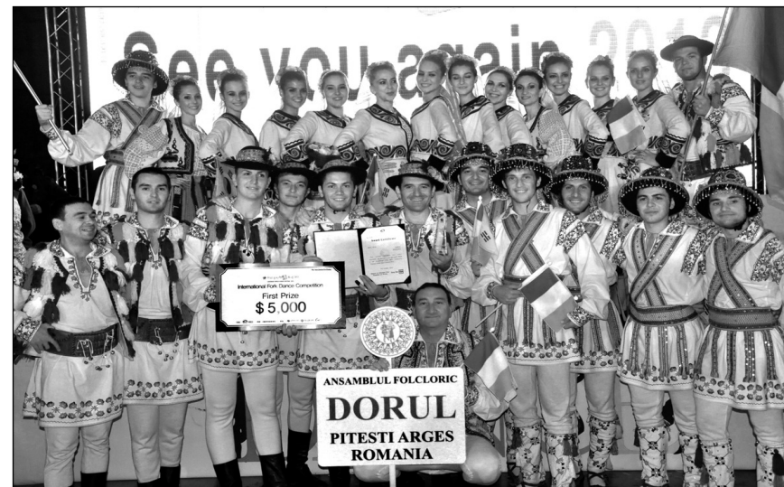
Ansamblul „Dorul“ al CJCPCT Argeș, câștigătorul locului I la Festivalul Mondial al Dansului din Coreea „Let's dance in Cheonan!“, octombrie 2012

Spectacolele concursului au fost impecabile, fiecare participant la această sărbătoare dedicată zeiței Terpsichora era responsabilizat,