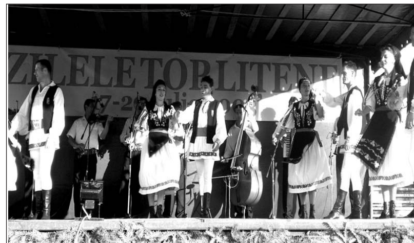
Imagine din spectacolul Ansamblului profesionist "Rapsodia Călimanilor", Toplița, iulie 2008