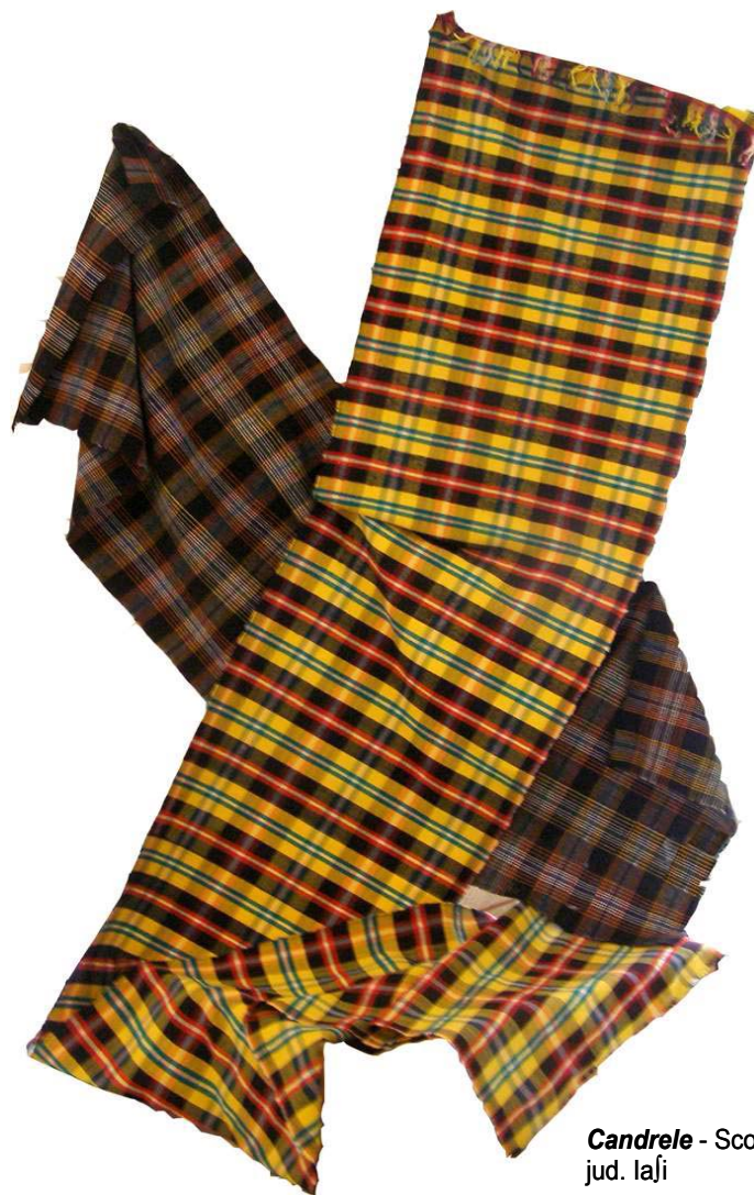
Candrela - Scobinț, jud. Iași

Organizatori: Centrul Național pentru Conservarea și Promovarea Culturii Tradiționale și Centrul Județean pentru Conservarea și Promovarea Culturii Tradiționale Iași