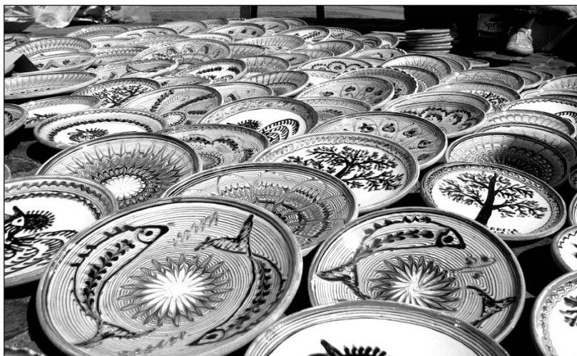
Taiere de Horezu expuse la târgul sibian