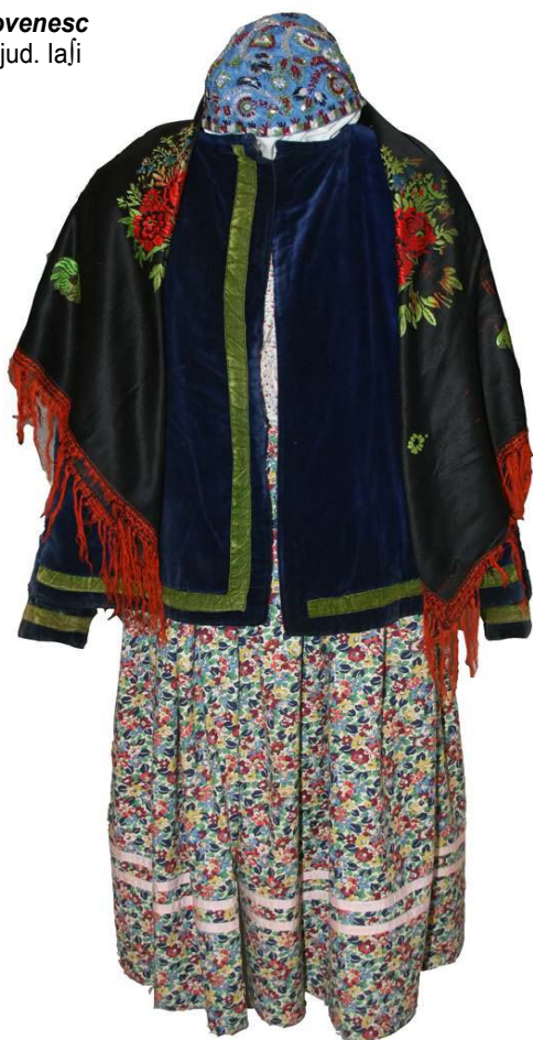
Costum lipovenesc din Lespezi, jud. Iași

Imagini din expoziția Patrimoniul cultural imaterial al județului Iași - meșteșuguri tradiționale și elemente de patrimoniu imaterial la Iași, 23 septembrie - 7 octombrie 2008