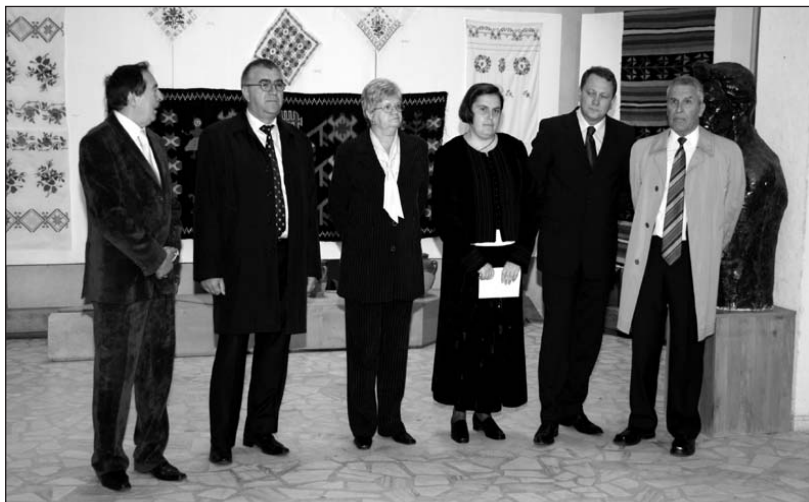
Oficialități și specialiști la vernisajul expoziției - Iași, 24 septembrie 2008