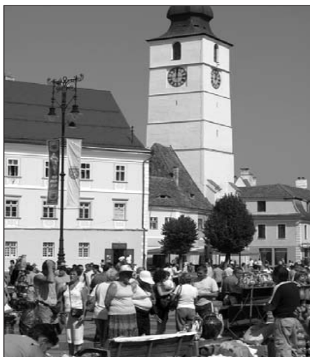
Sibieni și turiști în Piața Mare din Sibiu: Târgul olarilor, ediția 2008