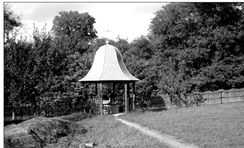
Fântână cu acoperiș din curtea bisericii din Dobrovăț

Duminica avea loc cununia religioasă, urmată de o masă la casa miresei dată de părinții acesteia, apoi urma luatul miresei cu zestre și mersul la casa mirelui. Fata își pregătea zestreă din timp, iar băiatul venea cu tineretul din sat, cu nașii, cu fast mare să-și ia mireasa cu tot cu zestre. Zestreă era luată cu un car cu boi. La casa miresei, mirele era supus la diverse probe: socrul mic încuie poarta ,