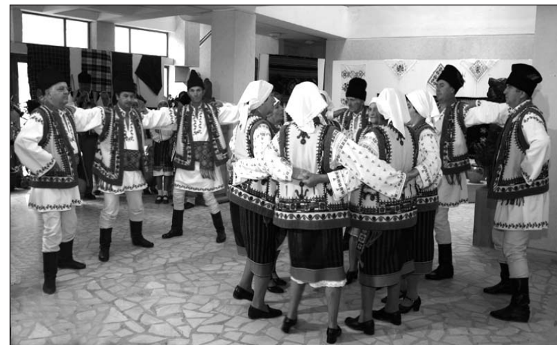
Formația de dansuri din Sticlăria-Scobinți, jud. Iași

Expoziția din Parcul Copou se constituie drept una dintre modalitățile de finalizare a proiectului Elemente de multiculturalitate