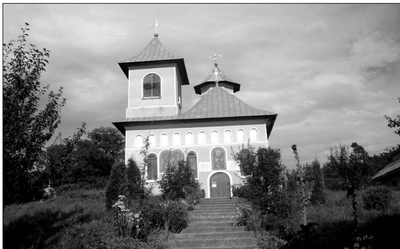
Biserica din satul Ruși, comuna Dobrovăț, județul Iași

la răsărit pe niște perne puse pe un covor, iar vornicelul zicea iertăciunea.