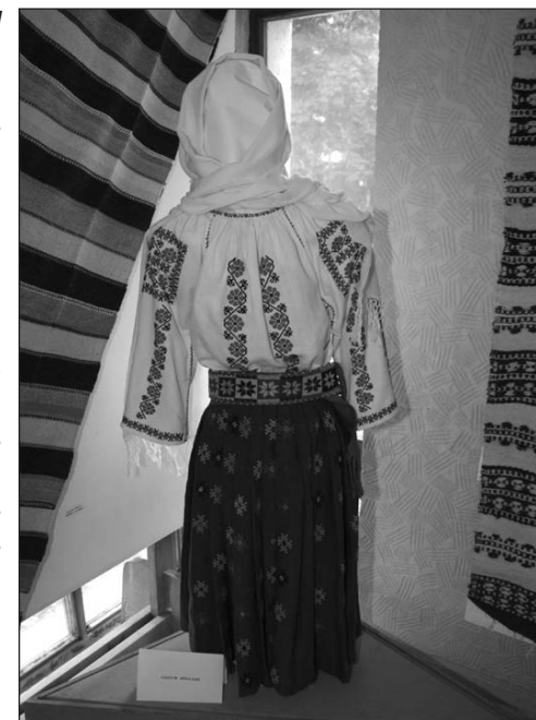
Costum românesc din zona Iași, în expoziția de artă populară contemporană Patrimoniul cultural imaterial al județului Iași

La vernisajul, care a avut loc în data de 24 octombrie 2008, a fost susținut un spectacol de muzică și dansuri tradiționale de către grupul vocal lipovenesc Vasilioc al Liceului „Ion Neculce” din Târgu Frumos și Ansamblul folcloric Stejărelul din Scobinți. De asemenea, meșteri populari din județ au făcut demonstrații privind meșteșugul