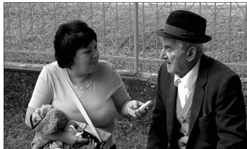
Cercetător și informator sau despre „Cum a fost cândva”

Expoziție de artă populară și artă plastică, cu participarea unor creatori și artiști plastici amatori din localitățile: Beiuș, Budureasa, Pietroasa, Ceica, Lunca și Vașcău.