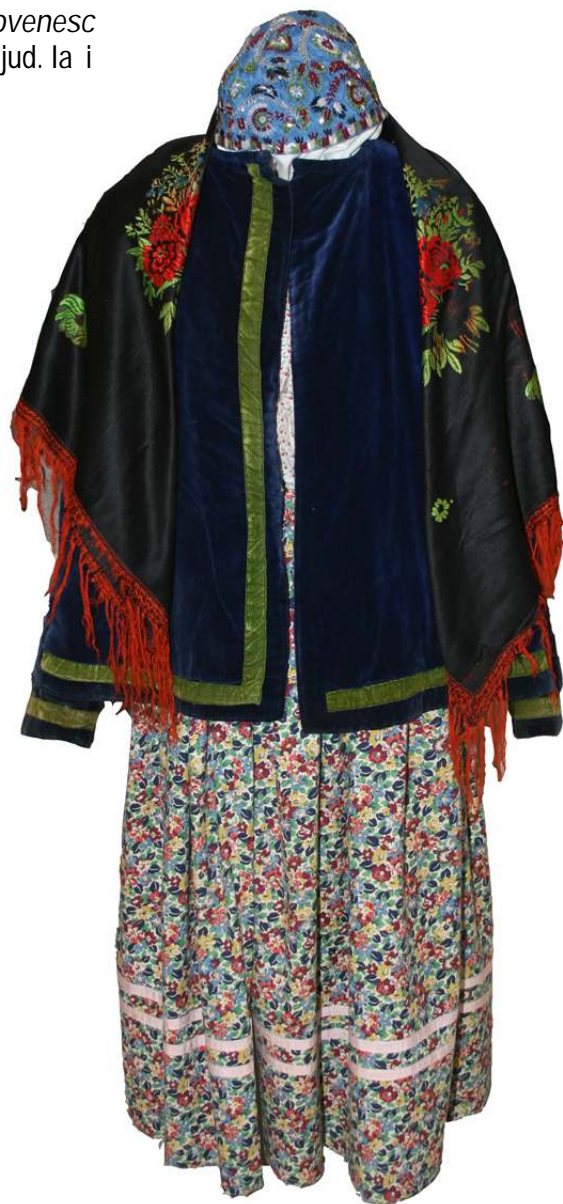
Imagini din expoziția Patrimoniul cultural imaterial al județului Iași - meșteuguri tradiționale și elemente de patrimoniu imaterial Iași, 23 septembrie - 7 octombrie 2008

Organizatori: Centrul Național pentru Conservarea și Promovarea Culturii Tradiționale și Centrul Județean pentru Conservarea și Promovarea Culturii Tradiționale Iași