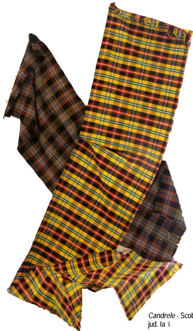
Candrele - Scobin, jud. Iași

Organizatori: Centrul Național pentru Conservarea și Promovarea Culturii Tradiționale și Centrul Județean pentru Conservarea și Promovarea Culturii Tradiționale Iași