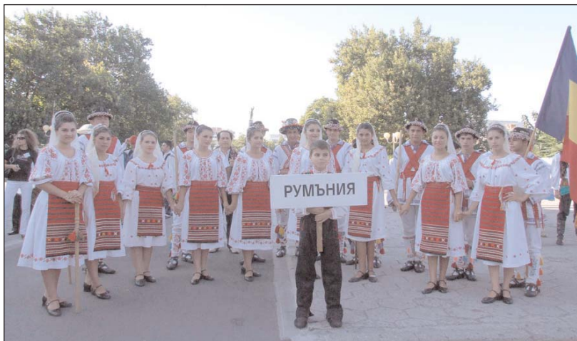
Dansatorii din comuna Corbu - Olt în turneu la Burgas (Bulgaria), august 2010

Am respectat întocmai cerințele regulamentului de participare și am fost bine primiți la sosirea în orașul Burgas, beneficiind și de un translator. Programul artistic al ansamblului nostru a fost foarte bine