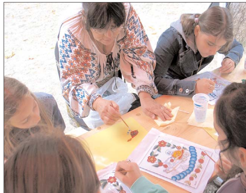
Lecție de pictură în Tabăra de creație „Toamnă la Chindie”, Târgoviște, septembrie 2010

Tabăra Internațională de Arte Vizuale „GORJFEST” - fotografie artistică, film documentar, sculptură mică, grafică și pictură - ediția a V-a. În context: