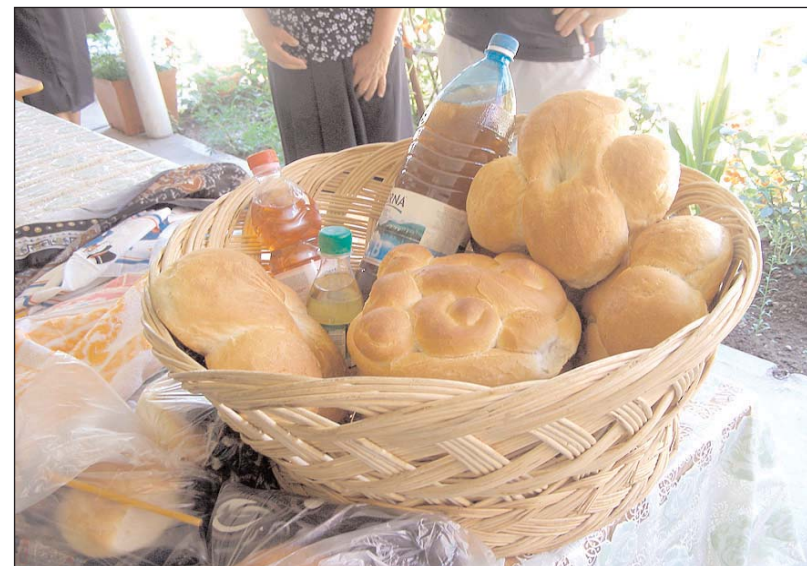
Coș cu ofrande funerare - Novaci, jud. Gorj, iunie 2010

S-au păstrat în schimb, nealterate, o mulțime de rituri postliminare, cum ar fi căratul apei, cinci sau șapte săptămâni după ce moare omul. Practicat de copii sau, în mod excepțional, de o femeie bătrână, curată, și acest ritual a suferit unele modificări. Conform tradiției, copilul trebuie să se trezească dis-de-dimineată, să