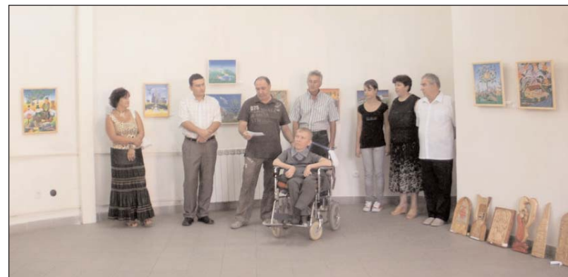
Imagine de la vernisajul Expoziției Deutsche Kunst Reschitza , Pitești, 26 august 2010

Zilele Orașului Comarnic - ediția a VI-a.