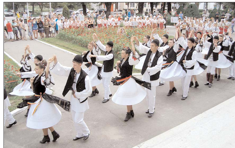
Ansamblul „Valea Sadului“ al Căminului Cultural Sadu, județul Sibiu