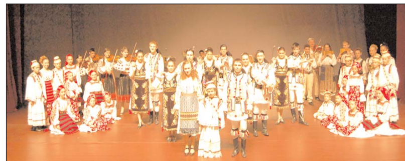
Ansamblul Folcloric „Perinița“ - Otopeni, jud. Ilfov