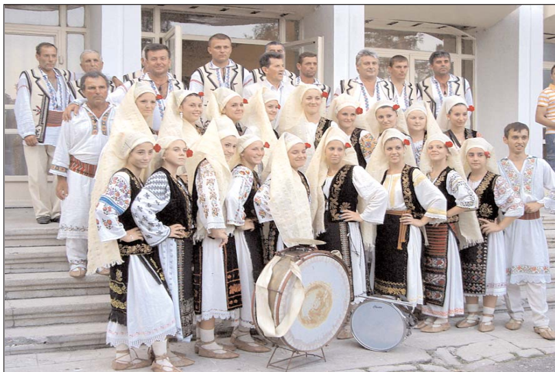
Ansamblul „Brăulețul“ al Consiliului Local al Comunei Saelele, județul Teleorman, august 2010

Tinerețea și exuberanța, calitatea interpretării cântecului și dansului popular, alegerea repertoriului, ca și frumusețea costumelor populare din fiecare zonă au făcut ca evoluția pe scena în aer liber din Parcul Casei de Cultură să fie apreciată atât de publicul iubitor de folclor care s-a alăturat în dese momente interpreților cântând și jucând împreună, cât și de juriul festivalului.