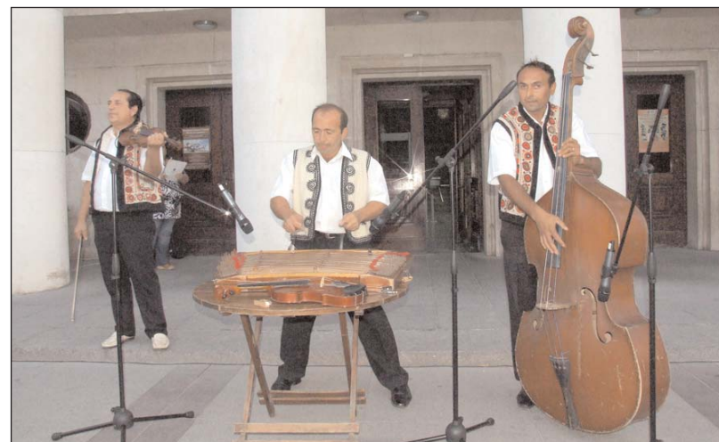
Taraful „Enache” din comuna Morunglav a asigurat acompaniamentul Ansamblului „Mărțișorul” la Festivalul Internațional de Folclor de la Burgas (Bulgaria)

Expoziția Națională de Artă Naivă - ediția a XLII-a. Vernisajul expoziției are loc duminică, 31 octombrie, ora 12,00. Lucrările pentru expoziție, în număr de cel mult trei, pot fi trimise pe adresa: Muzeul Județean Argeș, str. Armand Călinescu, nr. 44, C.P. 110047, Pitești, jud. Argeș, până la data de 15 octombrie.