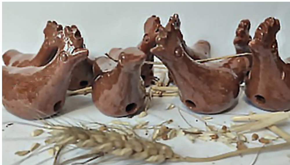
Jucării muzicale din lut avimorfe – Centrul de Ceramică Piscu, jud. Ilfov, 2022.

Fiind ingenioase și expresive, acestea nu sunt doar simple ludeme obiectuale primite de copii în dar de la părinții și cumpărate de la târgurile de produse meșteșugărești ori de la bâlciurile organizate la hramuri și sărbători câmpenești, ci sunt, deopotrivă, opere de artă populară incluse în colecțiile marilor muzee naționale și teaurizate în „Inventarul patrimoniului cultural mobil clasat” 21 .