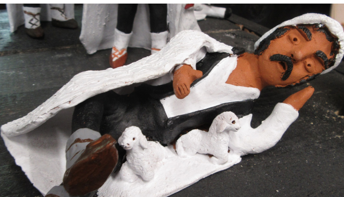
Figurine din lut masculine modelate olarii din familia Pătru din Vlădești, jud. Vâlcea, 2022.