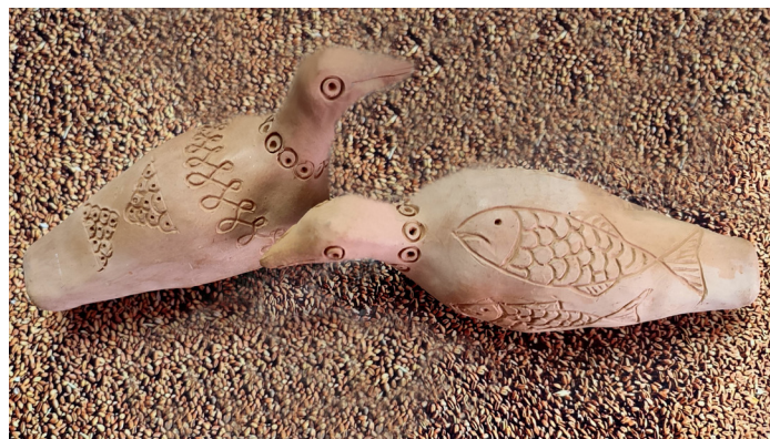
Fluiere avimorfe realizate de Mihai Trușcă, 2022 – Centrul de Ceramică Oboga – Olt.