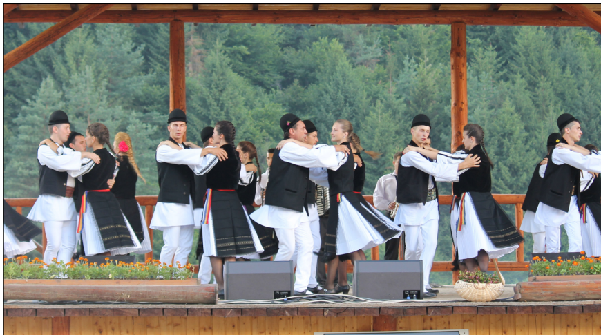
La început de Cuptor, o nouă ediție a Festivalului „Bujorul de Munte”, Gura Râului, jud. Sibiu

tradiția este la ea acasă. Iar de atunci, gurenii ne demonstrează, an de an, că, într-adevăr, în satul lor, cântecul și jocul popular, obiceiurile de altădată sunt prețuite așa cum se cuvine. S-a întâmplat și în acest an, în 7 și 8 iulie 2012, când la Gura Râului s-a desfășurat cea de-a IX-a ediție a Festivalului „Bujorul de Munte”.