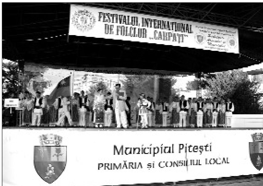
Pe scena Festivalului Internațional de Folclor „Carpați”, ediția a XXIX-a, Pitești, august 2012

10 august, în sala mare a Teatrului „Al. Davila” din Pitești. Festivalul Internațional de Folclor „Carpați 2012” marchează începutul acestor sărbători în județul Argeș.