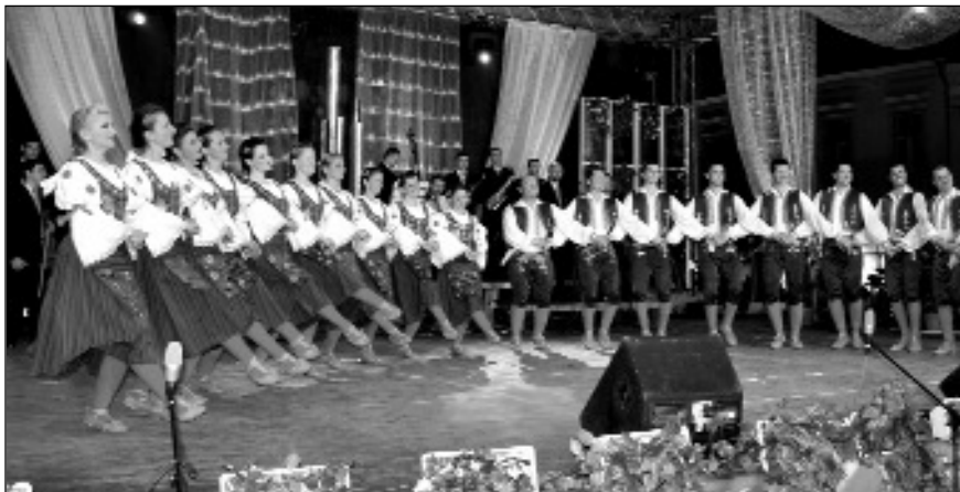
Festivalul Internațional de Folclor „Cântecele Munților”, ediția a XXXVII-a, Sibiu, 1-6 august 2012

Ansamblul „Ioanninon” - Grecia și din România: Ansamblul Ministerului Apărării Naționale - București, Ansamblul „Timișul” - Timișoara, Ansamblul „Crișana” - Oradea, Ansamblul „Mugurelul” - Cluj-Napoca, Ansamblul „Cununița” - Caransebeș, Ansamblul „Mureșelul” - Târgu Mureș, Ansamblul „Ardealul” - Sibiu, Ansamblul „Ceata Junilor” - Sibiu, Ansamblul Folcloric Profesionist „Cindrelul-Junii Sibiului”, Ansamblul Folcloric „Veteranii Junii Sibiului”.