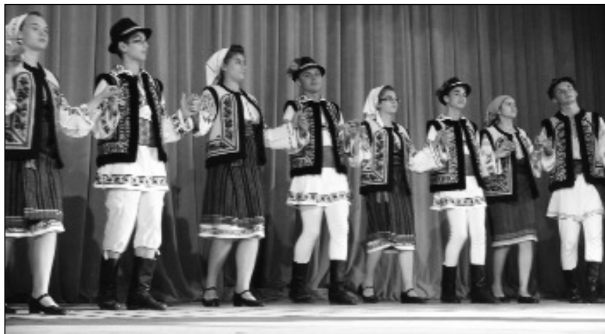
Imagine de la Festivalul Formațiilor Folclorice Coregrafice și Grupurilor Vocal-instrumentale de Amatori, Slănic Moldova, 20-22 iulie 2012

Măgurel” și cea din Săucești au impresionat cu jocuri populare moldovenești.