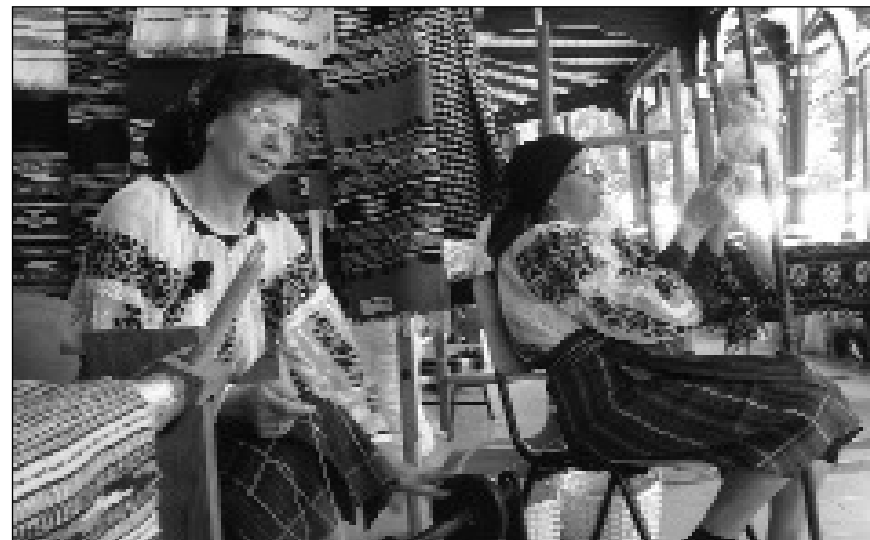
Aspect din Târgul meșterilor populari, organizat în cadrul Festivalului de la Slănic Moldova