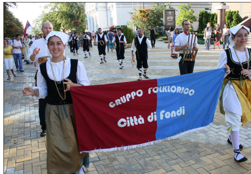
Ansamblul Folcloric „Città di Fondi” (Italia), defilând la parada portului popular care a precedat spectacolele

Ansamblul gruzin promovează, încă din anul 1995, moștenirea culturală a țării în lume. În ansamblu sunt peste 50 de dansatori. Au avut