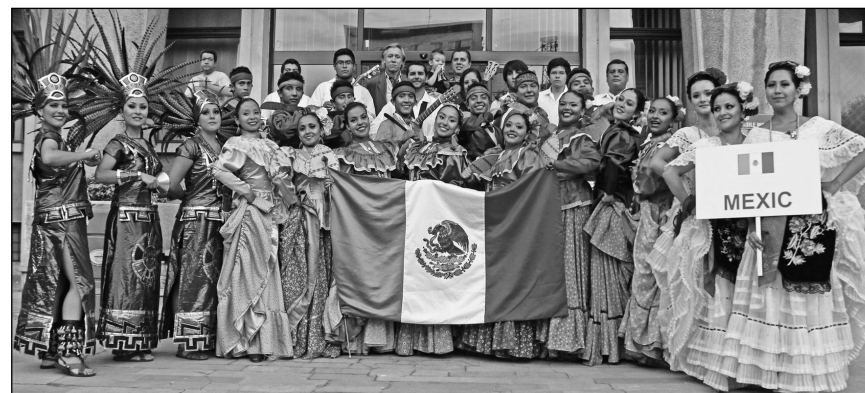
„Estampas de Mexico“ (Mexic) - locul III