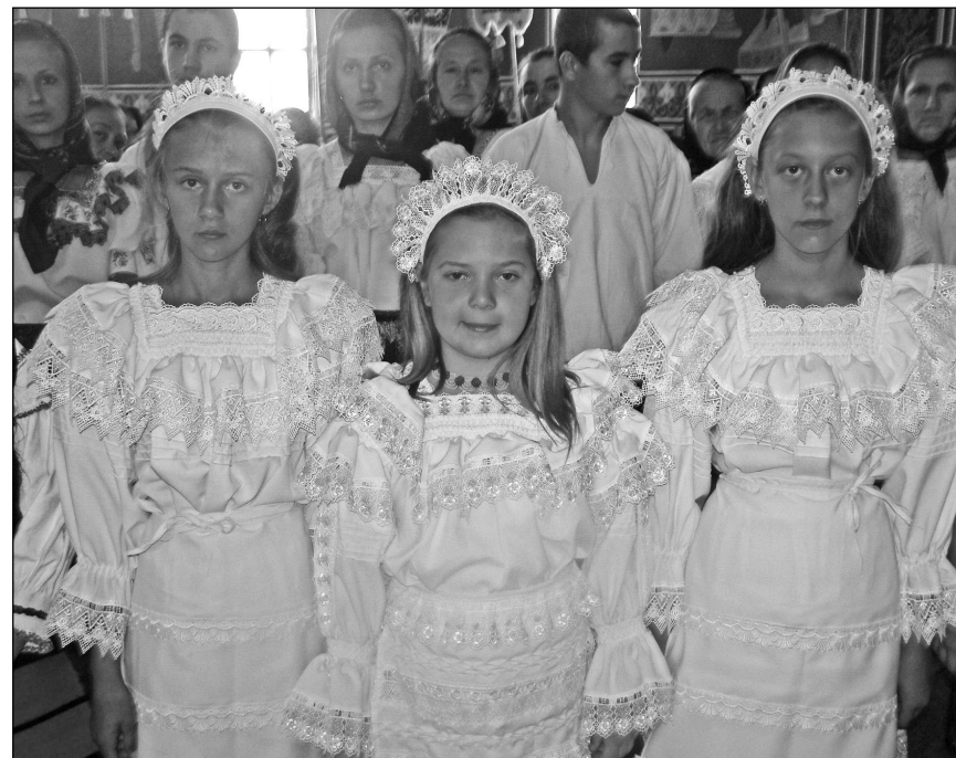
Costume de profeți, de la al căror nume vine denumirea locală a procesiunii - Mersul în profeți

Am avut, de asemenea, bucuria de a lansa o carte dedicată procesiunilor de la Moisei, publicată de Asociația Pro Culturalia Aurea , la Editura CNI Coresi (proiect editorial finanțat de Administrația Fondului Cultural Național ); un document pentru viitor; pentru cei care înțeleg sau vor înțelege ce reprezintă procesiunile la Adormirea Maicii Domnului pentru comunitatea multietnică și pluriconfesională maramureșeană, pentru cei care luptă să conserve și să transmită aceste valori de patrimoniu - pe care dorim să le integrăm și în patrimoniul universal, în viitor -, pentru cei care o iubesc și o cinstesc pe Măicuța milelor, care veghează viața fiecărui muritor, înălțând rugăciuni fierbinți pentru fiecare durere, necaz, nădejde, întristare și oricâte îi este dat omului să trăiască și să sufere pe acest pământ.