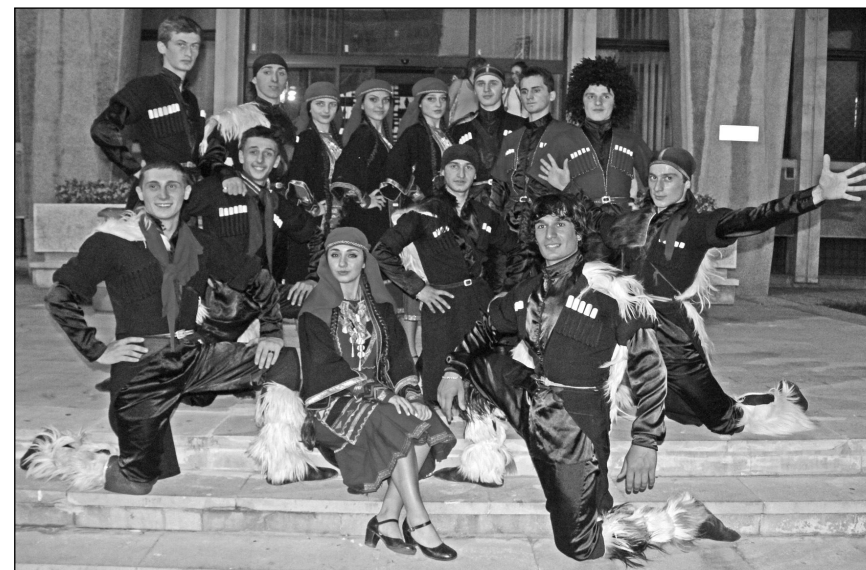
Ansamblul „Batumi State Ensemble - KHORUMI“ (Georgia), câștigătorul locului I

un caracter grav, provenind dintr-un ritual solemn , care trebuie săvârșit pentru o acțiune serioasă, chiar dacă forma sa spectaculară, pe care-o aplaudăm în zilele noastre, derivă din chora-bucurie . Dar acest lucru s-a petrecut mai târziu, când au fost admiși în ritual femeile și copiii, inițial doar ca isonari-acompanatori și, mult mai târziu, ca interpreți. Inițial, dansul era apanajul bărbaților, când omul se exprima pentru el însuși, nu ca să servească pe cineva, fiind născut în procesul muncii și practicarea magiei, fie pentru stimularea rodirii pământului, fie în vederea pregătirii psihice pentru vânatoare. Treptat, dansul devine mereu mai complex, concentrând tainele rituale profane, cinegetice, solare ori selenare (simbolul ocrotirii femeilor și, deci, al fertilității), dansuri agrariene de magie imitativă, ca reminiscențe ale cultului totemic (cum sunt călușarii argeșenilor), pirice , având rol purificator (precum dansul solstițial estival propus de jucătorii galez), calavrismos (militare - dansul săbiilor prezentat de georgieni, dansul galez clogging ), dionisiace (dansul florilor galez a devenit o sarabandă a fericirii și mulțumirii pentru revărsarea de mireasmă și cromatică, o mulțumire adusă divinității), dramatice . Religioase sau