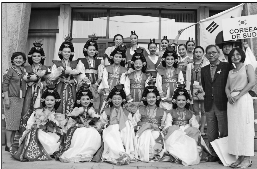
„Korea Union Dance Company“ (Coreea de Sud) - locul II

Nacional de Danza Folklorica (Mexic), Folk Dance Group „Elektroporcelan“/Arandzelovac (Serbia), Efem Youth and Sports Club (Turcia) și Folk Dance Group „Dawnsyr Nantgarw“ (Țara Galilor), care au evoluat pe scenele special amenajate de primăriile locale la Pitești, Costești, Câmpulung, Mioveni, Topoloveni, Curtea de Argeș și, din nou, la Pitești, alături de grupurile reprezentative argeșene: Dorul , Doina Argeșului , Mugurelul , Plaiuri Muscelene , Doruri Muscelene , Plai cu dor , Dorulețul , Ciuleandra , Haiducii Vlădicii , Argeșul , Doruri Argeșene . În primele trei zile la Pitești, Costești și Câmpulung, au participat și grupurile folclorice, invitate de Primăria Orașului Mioveni, din Bulgaria - Heraklea (Petrich), Na Sever ot Balcana (Debovo), Dunavschi Zvuti (Nicopol), din Grecia - Stalatina și din Turcia - Sarkikaagac Halk Egitim Merkezi Mudurlugu .