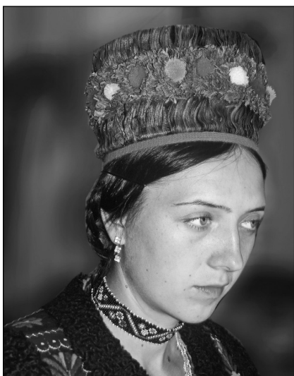
Găteala capului fetelor ucrainene, la plecarea în procesiune - Poienile de sub Munte, jud. Maramureș

Lansăm și noi, cu bucurie, mesaj de pace, de rugăciune, de slavă a Maicii Domnului, alături de pioasele procesiuni maramureșene și lăsăm această carte să vorbească singură, în limba română, franceză, dar și în limbajul universal al imaginilor despre sufletul maramureșean aflat într-un moment de sărbătoare și de har, cu credința și nădejdea că Maica Domnului va privi și către comunitatea noastră aflată în încercări și nevoi, dăruind alinare și un colțisor de rai celor care o cinstesc.