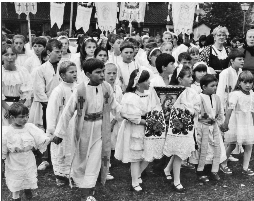
Diacon în Precesiunea de la Bocicoel, jud. Maramureș, 1994