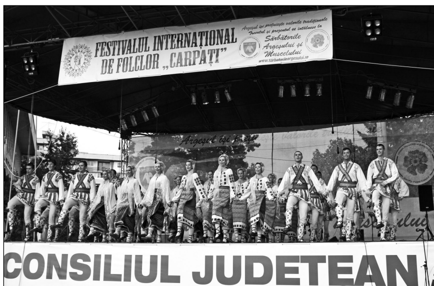
Ansamblul „Dorul“ pe scena celei de-a XXX-a ediții a Festivalului Internațional de Folclor „Carpați“, august 2013

un caracter grav, provenind dintr-un ritual solemn , care trebuie săvârșit pentru o acțiune serioasă, chiar dacă forma sa spectaculară, pe care-o aplaudăm în zilele noastre, derivă din chora-bucurie . Dar acest lucru s-a petrecut mai târziu, când au fost admiși în ritual femeile și copiii, inițial doar ca isonari-acompanatori și, mult mai târziu, ca interpreți. Inițial, dansul era apanajul bărbaților, când omul se exprima pentru el însuși, nu ca să servească pe cineva, fiind născut în procesul muncii și practicarea magiei, fie pentru stimularea rodirii pământului, fie în vederea pregătirii psihice pentru vânatoare. Treptat, dansul devine mereu mai complex, concentrând tainele rituale profane, cinegetice, solare ori selenare (simbolul ocrotirii femeilor și, deci, al fertilității), dansuri agrariene de magie imitativă, ca reminiscențe ale cultului totemic (cum sunt călușarii argeșenilor), pirice , având rol purificator (precum dansul solstițial estival propus de jucătorii galez), calavrismos (militare - dansul săbiilor prezentat de georgieni, dansul galez clogging ), dionisiace (dansul florilor galez a devenit o sarabandă a fericirii și mulțumirii pentru revărsarea de mireasmă și cromatică, o mulțumire adusă divinității), dramatice . Religioase sau