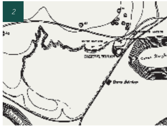
PLANUL FORTIFICAȚIEI ROMANE ȘI A NECROPOLEI DE LA BARBOȘI

Indiferent de existența sau nu a unui presupus drum care mergea până la Tyras, ipoteză susținută de Tocilescu, dar de care Pârvan se îndoia, este foarte posibil ca și perioada antică să fi funcționat un drum prin care să se fi ajuns la nord de Noviodunum, unde cursul fluviului putea fi traversat printr-un vad