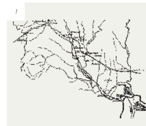
TRASEUL DRUMULUI ROMAN DIN MOLDOVA DE JOS

Localizarea castrului de la Barboși (ISM V 296) IMAGINEA 2 în perioada Principatului rămâne o chestiune deschisă. Locul în care a staționat garnizoana romană, constituită din vexilații ale unor diverse unități militare, este încă neclar, deși propunerile pentru amplasarea acestuia variază în jurul promontoriului Tirighina. Rolul acestui areal a fost remarcabil interpretat de Pârvan ca emporium . Așadar, în acest loc a funcționat un port foarte important și o zonă antreprenorială pe măsură, din care mărfurile au fost distribuite prin transport fluvial pe întreg arealul bazinului râului Siret. Astfel poate fi explicată dezvoltarea importantelor dava / emporia de la Poiana, Brad sau Răcătău.