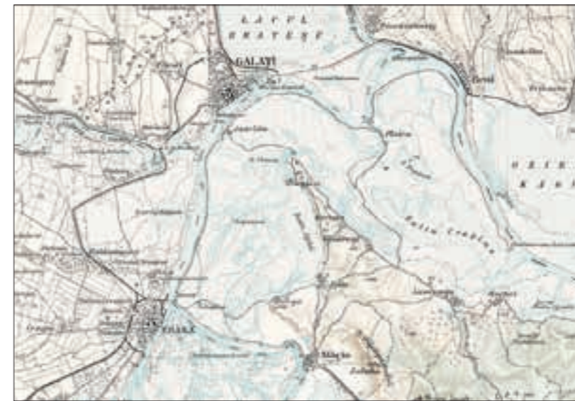
HARTA AUSTRIACĂ [1910]

Despre extinderea necropolei romane de la Barboși vom vorbi cu altă ocazie. ●