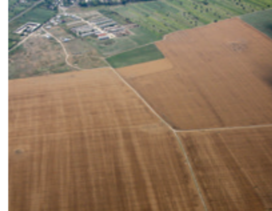
TUMULI SITUĂȚI LA EST DE COMUNA BRANIȘTEA - FOTOGRAFIE AERIANĂ DIN ANUL 2008; 2. TUMULUL 184 (MOVILA BRANIȘTEA), FOTOGRAFIE AERIANĂ