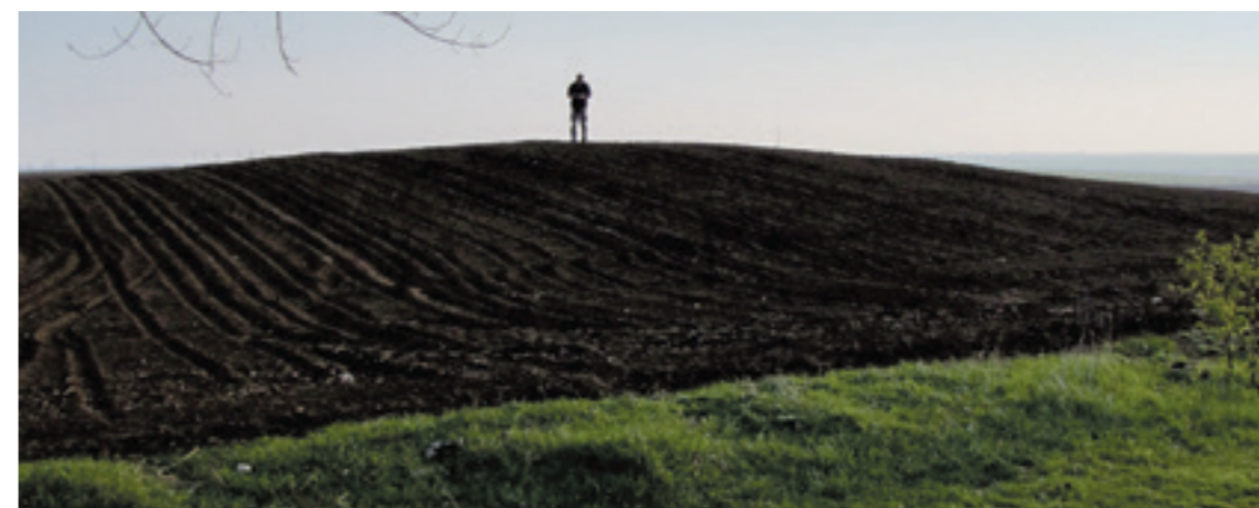
VEDERE PANORAMICĂ CU ZONA AFLATĂ LA EST DE COMUNA BRANIȘTEA - PERIEGHEZĂ DIN ANUL 2012

Cunoscând faptul că necropolele tumulare, cu sarcofage sau alte astfel de monumente funerare, erau amplasate de-a lungul drumurilor în perioada romană, este poate mai mult decât o coincidență faptul că și astăzi cel mai lung și important bulevard din municipiul Galați se află amplasat exact pe același traseu cu cel al tumulilor antici. Acest fapt confirmă o