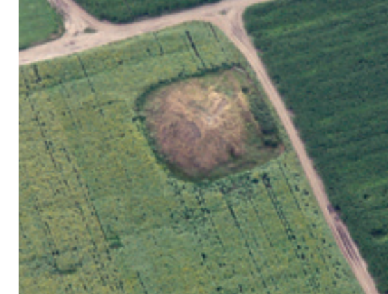
TUMULUL - „MOVILA CRACUL FĂLOAIEI”, SITUAT LA EST DE COMUNA SMÂRDAN

Pornind de la ipoteza lui Vasile Pârvan privind existența unui drum roman care străbătea acest areal pe direcția est – vest, ar fi fost de presupus că distribuția tumulilor aparținând epocii romane să fi avut o concentrare semnificativă de-a lungul acestei axe. Situația din teren este însă mult mai diversă. Majoritatea descoperirilor funerare cartate sunt tumuli amplasați în aliniamente vizibile de la mare depărtare și având întinderi considerabile, multe dintre aceste aliniamente au orientarea Nord – Sud. Principalele descoperiri funerare romane sunt sarcofagul de marmură cu menționarea numelui Alphenus Modestus , descoperit în vecinătatea promontoriului Tirighina, cavoul din cartierul Dunărea databil în secolul IV p. Chr. sau sarcofagul „mithraic” descoperit în anul 1867 pe strada Lozoveni. În necropola de la Barboși au fost cercetați de-a lungul timpului mai mulți tumuli, acestora adăugându-li-se descoperirile de din extremitatea estică, din zona denumită convențional cart. Dunărea .